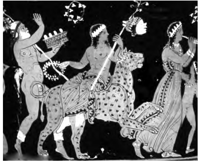
αριστερά: Αττικός ερυθρόμορφος κρατήρας (500-490 π.Χ.), με παράσταση τραγικού χορού μπροστά στο βωμό του Διόνυσου. Τα μέλη του χορού φορούν προσωπεία νεανικά και ομοιόμορφα. Προσωπείο έχει και το είδωλο του Διόνυσου. δεξιά: Ο Διόνυσος πάνω σε λεοπάρδαλη. Στο ένα χέρι κρατάει στεφάνι και στο άλλο θύρσο και προσωπίδα.

στοί έβλεπαν τον ίδιο τον Διόνυσο, που συμμετείχε στις γιορτές και στα μυστήρια.