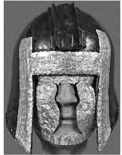
αριστερά: Η ολόχρυση προσωπίδα του Αγαμέμνονα (13Τ΄π.Χ. αιώνα) που βρέθηκε στους τάφους των Μυκηνών μέσο: Χάλκινο κράνος και χρυσή νεκρική προσωπίδα. Αρχαϊκή περίοδος, (520 π.Χ.)Σίνδος, αρχαϊκό νεκροταφείο, Μουσείο Θεσ/νίκης δεξιά: Χάλκινο κράνος και χρυσή νεκρική προσωπίδα πολεμιστή, Αρχοντικό Πέλλας

Τα χαρακτηριστικά στις περισσότερες προσωπίδες (εκτός αυτής του Αγαμέμνονα) φαίνεται να είναι σχηματικά τυποποιημένα. Δεν προσπαθούν να αποδώσουν ρεαλιστικά τα χαρακτηριστικά του προσώπου αλλά μόνο το φύλο, την ηλικία και ίσως κάποια στοιχεία της προσωπικότητας του νεκρού.