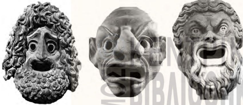
πάνω: Μαρμάρινο θεατρικό προσωπίο, 300-250 π.Χ. (αριστερά), Μαρμάρινο τραγικό προσωπίο, 1ος αι. π.Χ. (κέντρο), Πύλινο προσωπίο από το ιερό της Ορθίας στη Σπάρτη, 6ος αι. π.Χ.