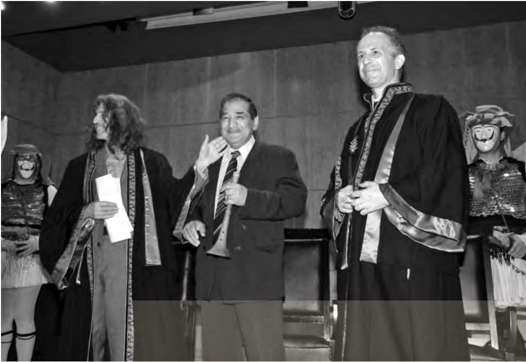
Η ανακήρυξη του Βαγγέλη Ψαθά σε επίτιμο διδάκτορα του Τμήματος Μουσικής Επιστήμης του Πανεπιστημίου Μακεδονίας το 2008

χορευτική ομάδα της περιοχής να κάνει πατινάδα με αυτόν τον σκοπό. Ο σκοπός αυτός έμοιαζε πολύ με την «Παπαδιά» και με κάποιους άλλους σκοπούς της Νάουσας. Σκέφθηκα ότι θα ταίριαζε πολύ να παιχτεί σαν πατινάδα στη Νάουσας, καθώς η μελωδία ήταν πολύ κοντά στα ακούσματά μας. Κάποια στοιχεία από την «Παπαδιά» και κάποιες καταλήξεις και έτσι έγινε το κομμάτι».