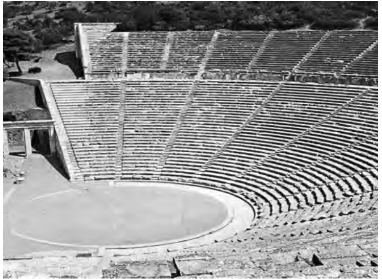
αριστερά: Τρεις ηθοποιοί μέλη χορού σατυρικού δράματος. Οι δύο αριστερά κρατούν το προσωπίό τους στο χέρι, ενώ ο τρίτος το φορά. Αρχές 4ου αι. (Σίδνευ, Μουσείο Nicholson), δεξιά: Το Αρχαίο θέατρο της Επιδαύρου