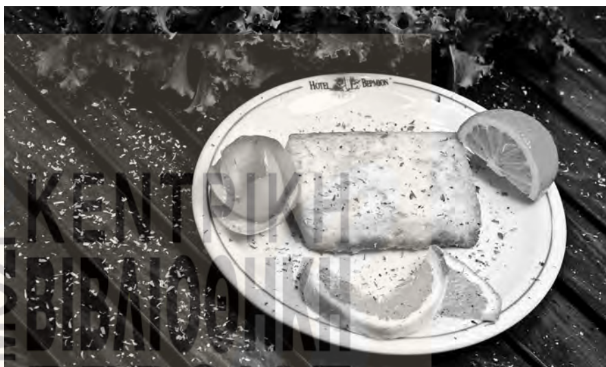
Μάντζια (επάνω), μπάτσιο σαγανάκι (κάτω)

στη διατροφή με χειμερινά κηπευτικά όπως το λάχανο, το κουνουπίδι, τα πράσα και τα σέλινια. Η σκληρή εργασία των αγροτών στις περισσότερες περιοχές δεν αφήνει πολύ χρόνο για την παρασκευή του φαγητού και έτσι έχουμε μία λιτή διατροφή κυρίως με όσπρια, αποξηραμένα λαχανικά και τουρσιά.