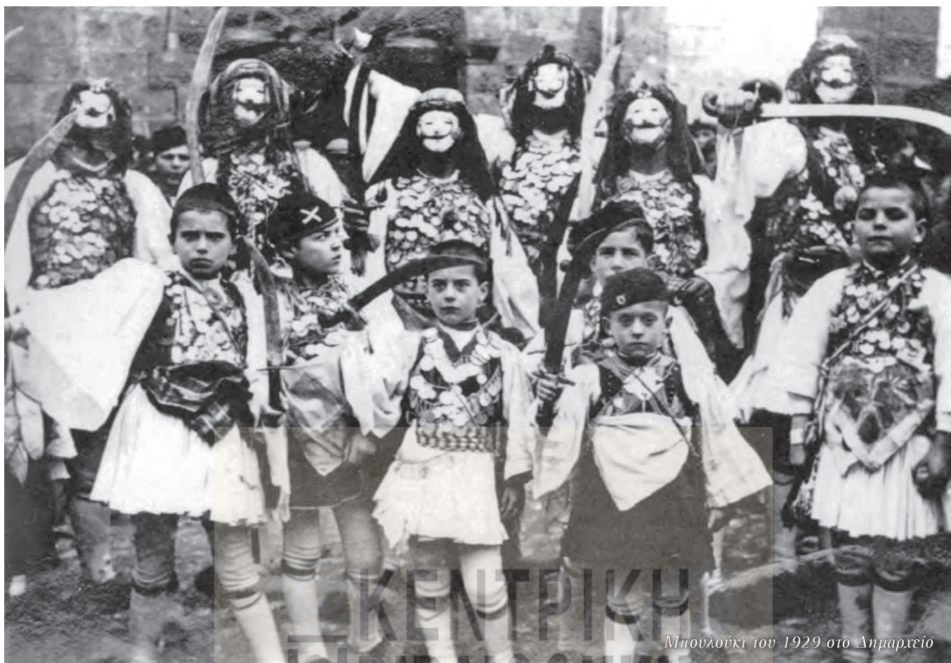
Μπουλούκι τον 1929 στο Δημαρχείο