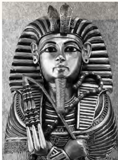
Η χρυσή προσωπίδα του φαραώ της Αιγύπτου Τουταγχαμών

Ο νεαρός φαραώ Τουταγχαμών, ήταν γιος του φαραώ Ακενατόν και σύζυγος της βασίλισσας Νεφερτίτης. Η βασιλεία του εντάσσεται στην 18η δυναστεία (1550-1295 π.Χ.) του Νέου Βασιλείου, που ήταν ένας από τους ισχυρό-