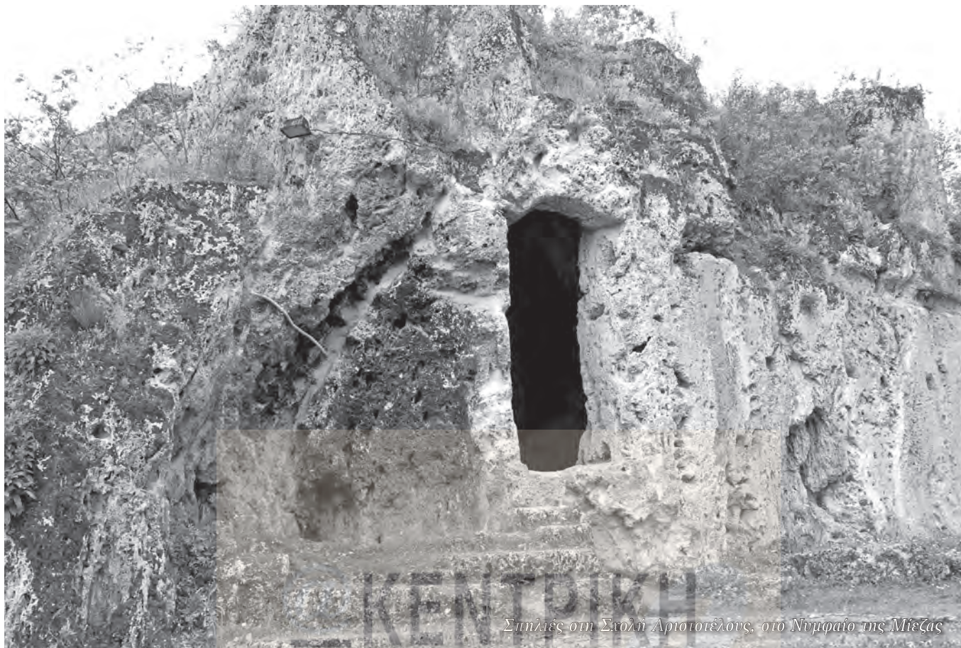
Σπηλιές στη Σχολή Αριστοτελέως, στο Νυμφαίο της Μιέζας