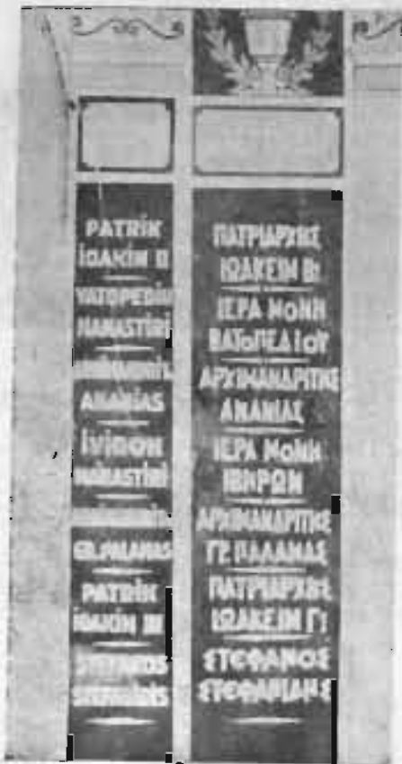
Στήλη τῶν εὐεργετῶν

Μετὰ τὸν ὕμνον τῆς Ἀνεξαρτησίας διὰ καταλλήλου προσφωνη