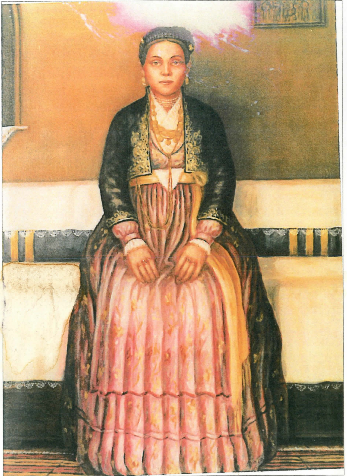
Βεργιώτικα βυσσινιά "ορχα".