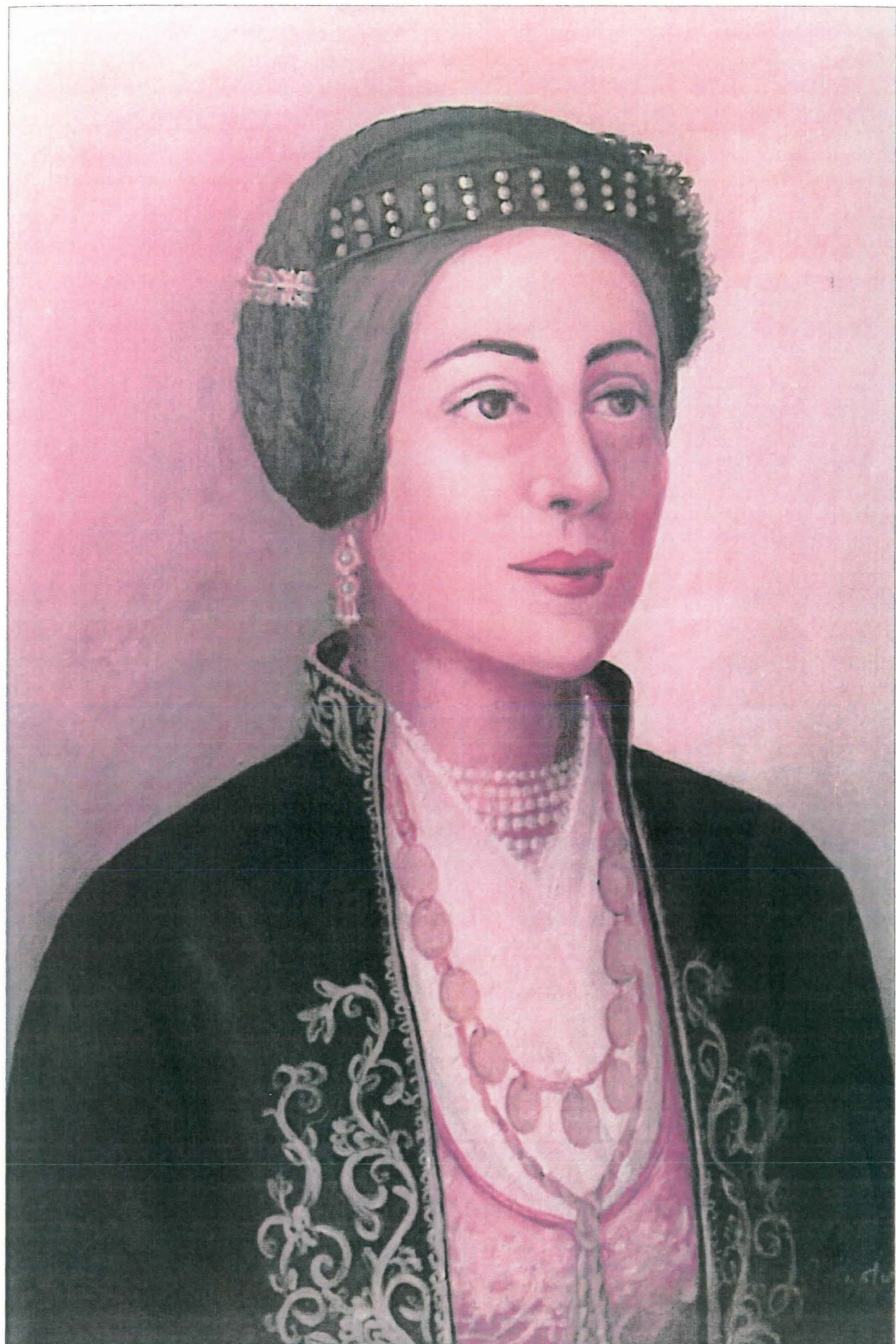
Βεροϊώτισσα. Με το "φακιότι" (κεφαλόδεμα) και το "βαϊταράκι" (ζακέτ).