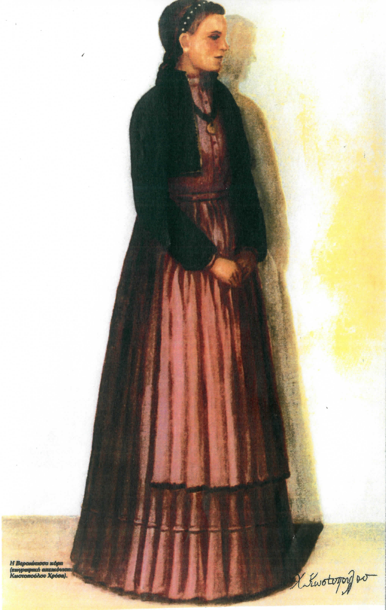
Η Βεροιώτικα κόρμ (επιγραφική απεικόνιση: Κωστοπούλου Χρόση).