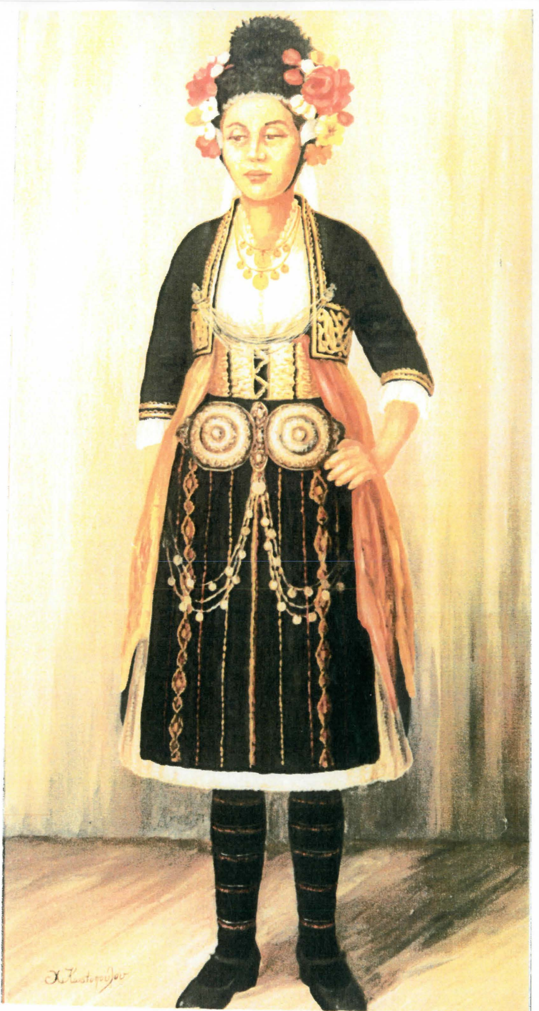
РΟΥΜΛΟΥΚΙ: Παραβοβιανή επίσημη φορεσιά