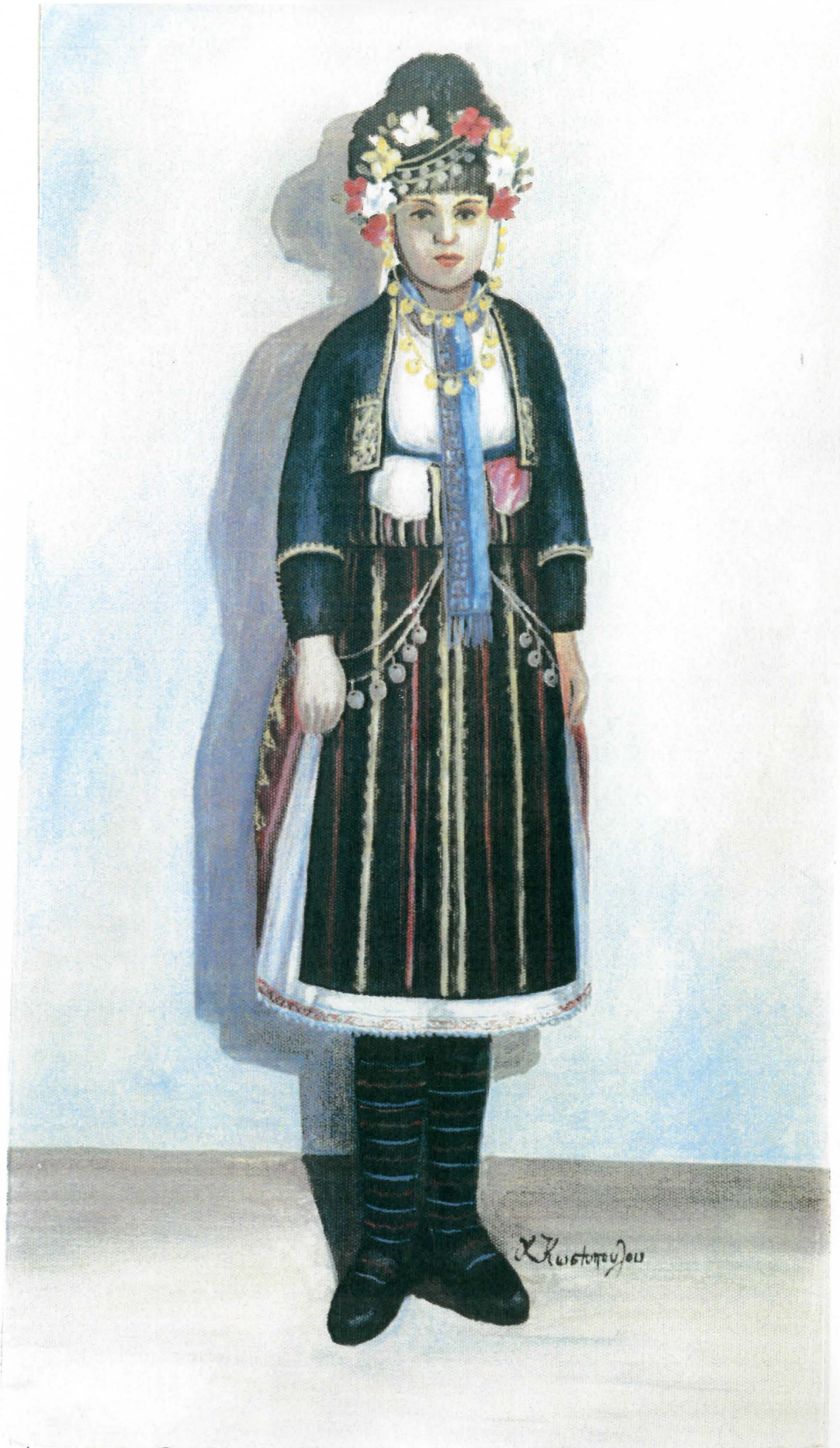
Αλεξάνδρεια. Παραδοσιακή φορεσιά.