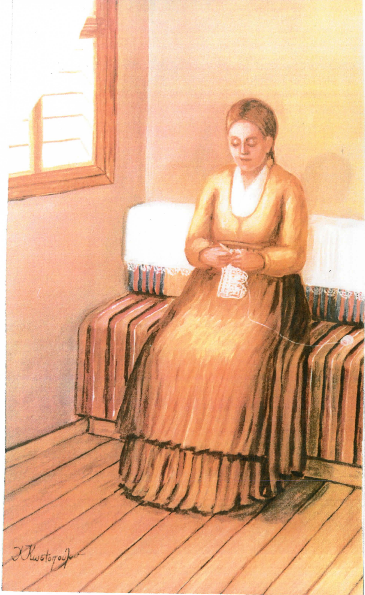
Βερσιώεσσα στον "Ορέα" της Κέρκυρας.