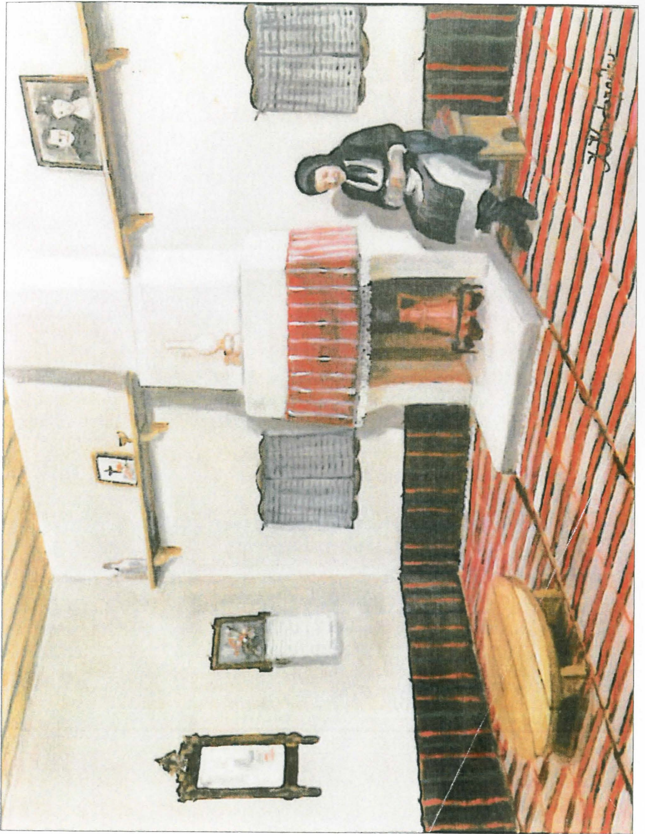
Ρουμλούκι: εσωτερικό ρουμλουκιώτικον σημειόν.