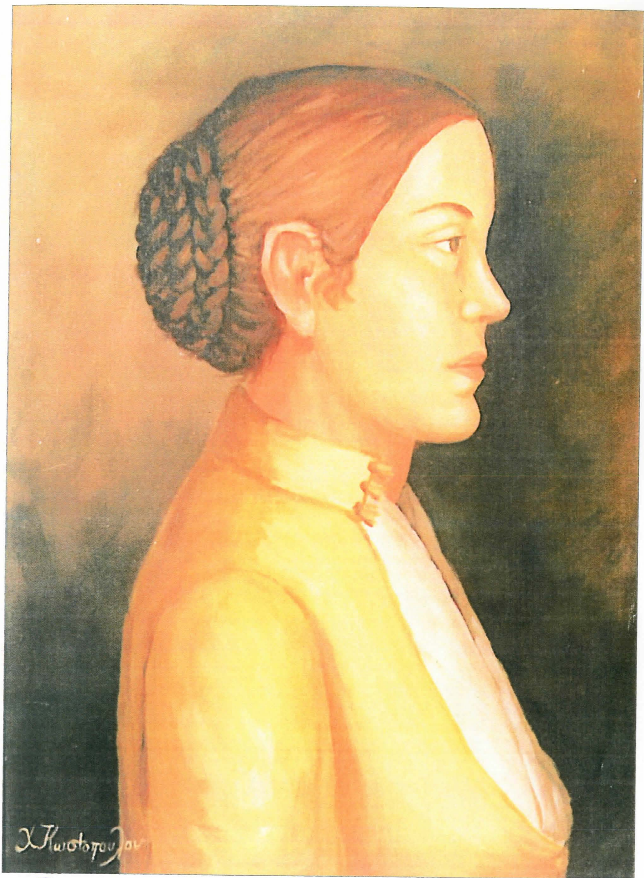
Βερσιέτσα, με το χτένισμα "φωδιά".