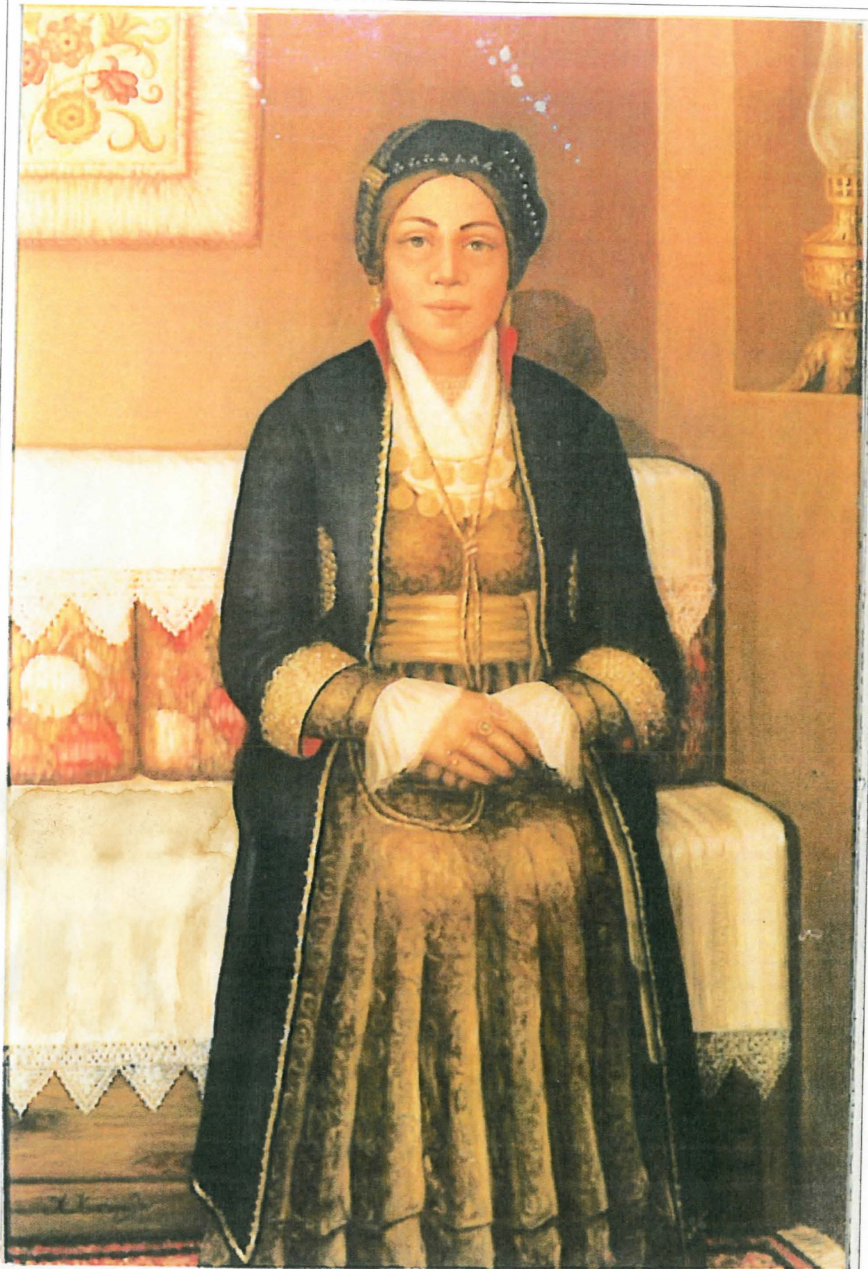
Βεροιώτισσα βγού "ονεά", με το "μακροδέμπαντο".