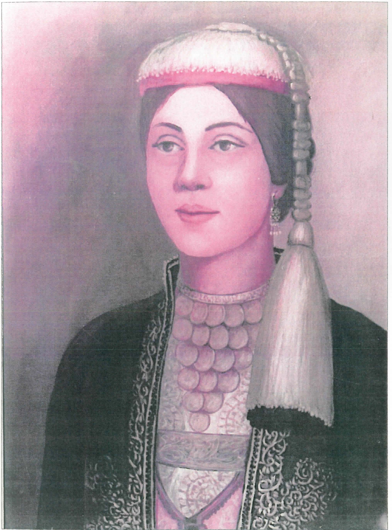
Ναουσαία. Με τα κομμάτια στον λαϊκό χρυσό.