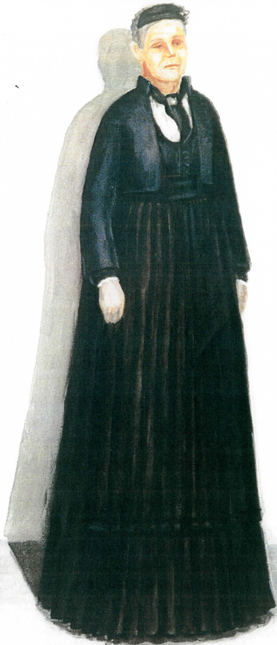
Υ Κωνσταντίνου Βεδοιώεσσα η Νικημένη.