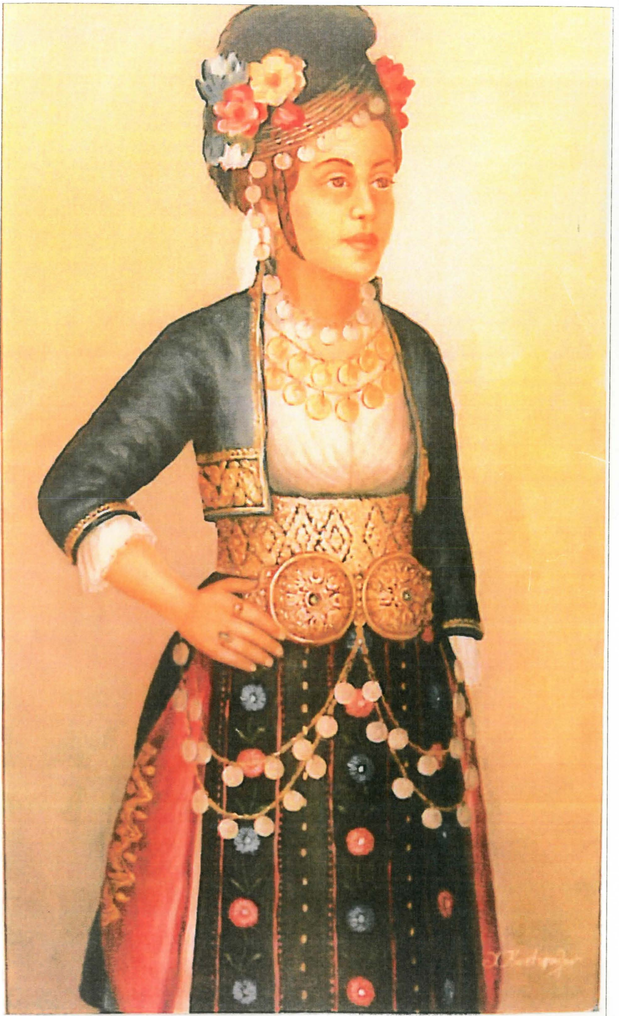
Μεθίωνα: Παραδοσιακή φορεσιά.