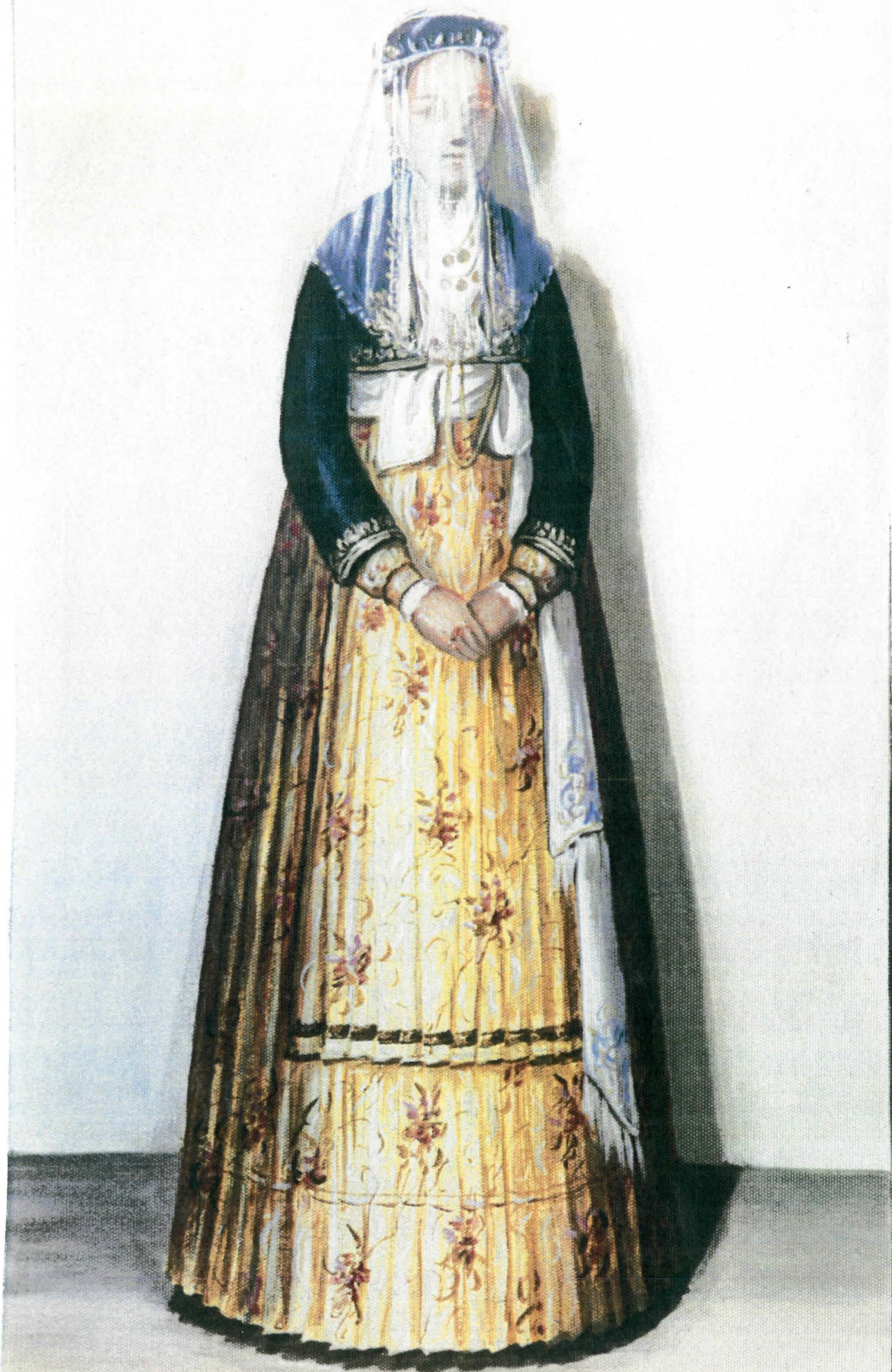
Βεροιώτισσα . Νυφιαϊκή φορεσιά τον 1910. (X. Κωστοπούλου)