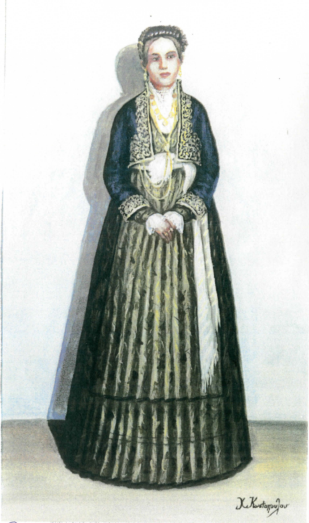
Βεροιώτισσα: Επίσημη φορεσιά.