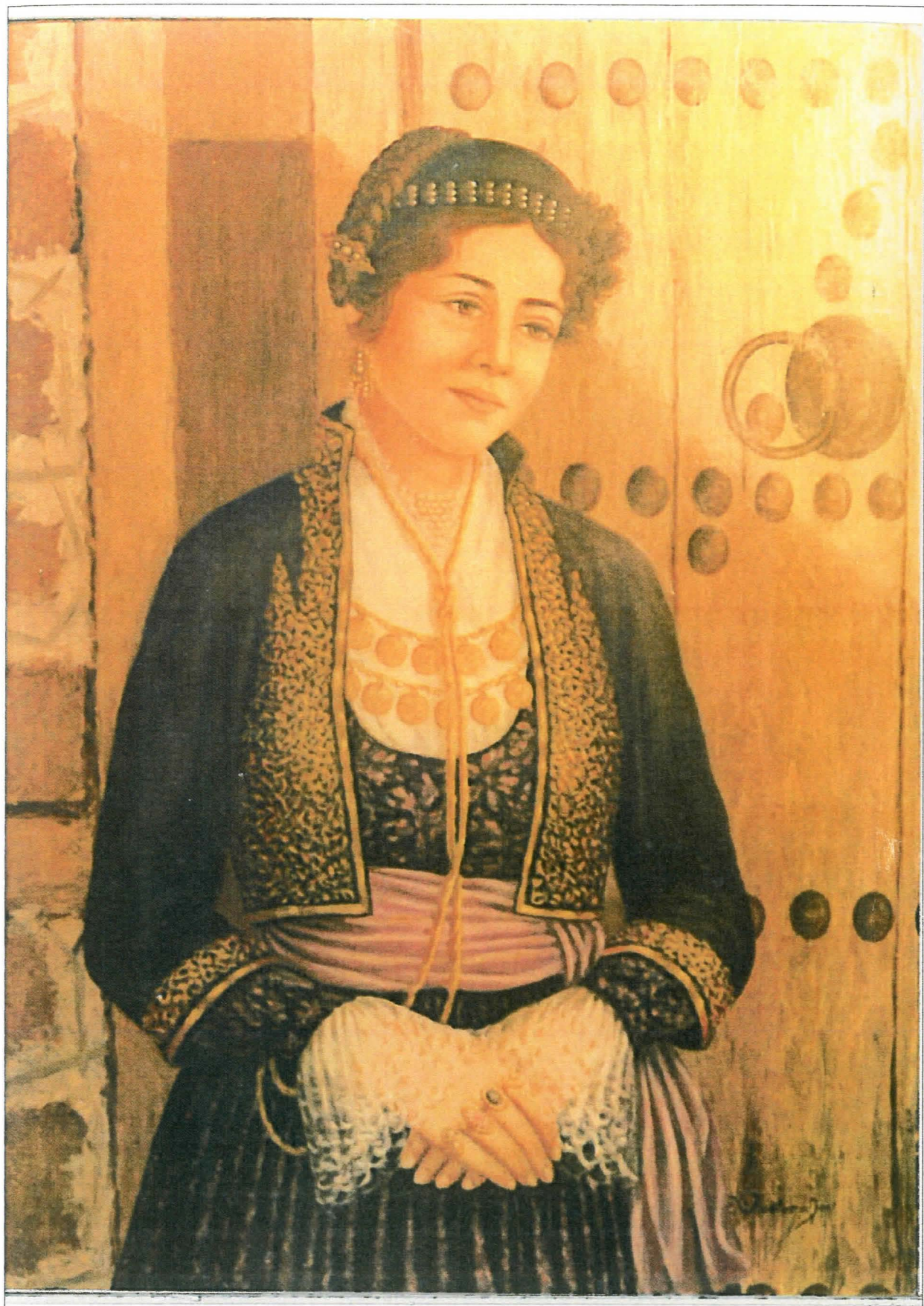
Βεροιώτισσα με ενν επίσημη ενδυμασία.