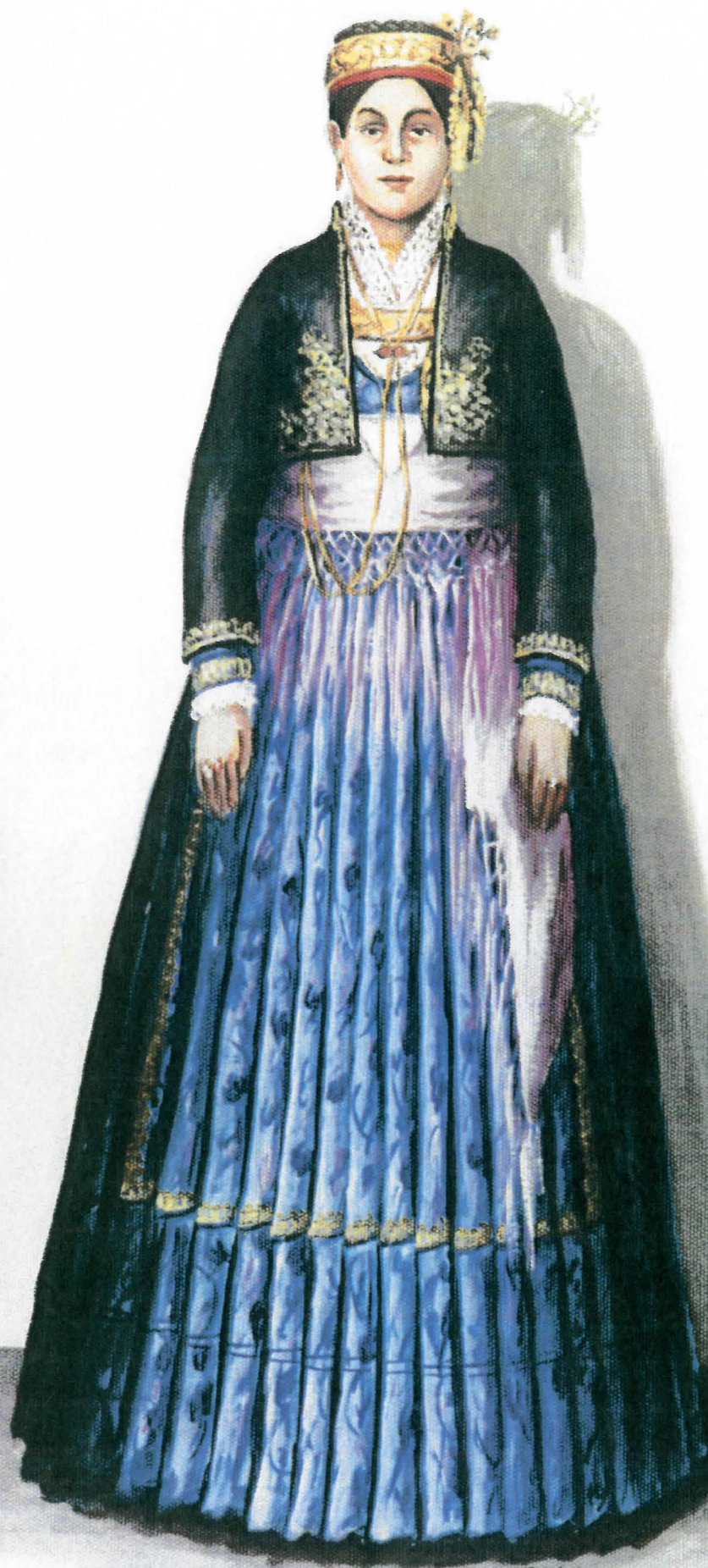
Ναουσαία. Επίσημη φορεσιά, με το παλαιότερο κεφαλό- δέμα.