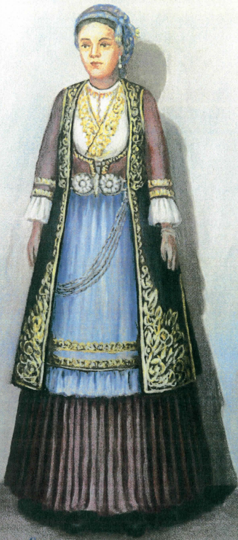
ΑΡΚΟΧΕΡΙ: Επίσημη παραδοσιακή φορεσιά.