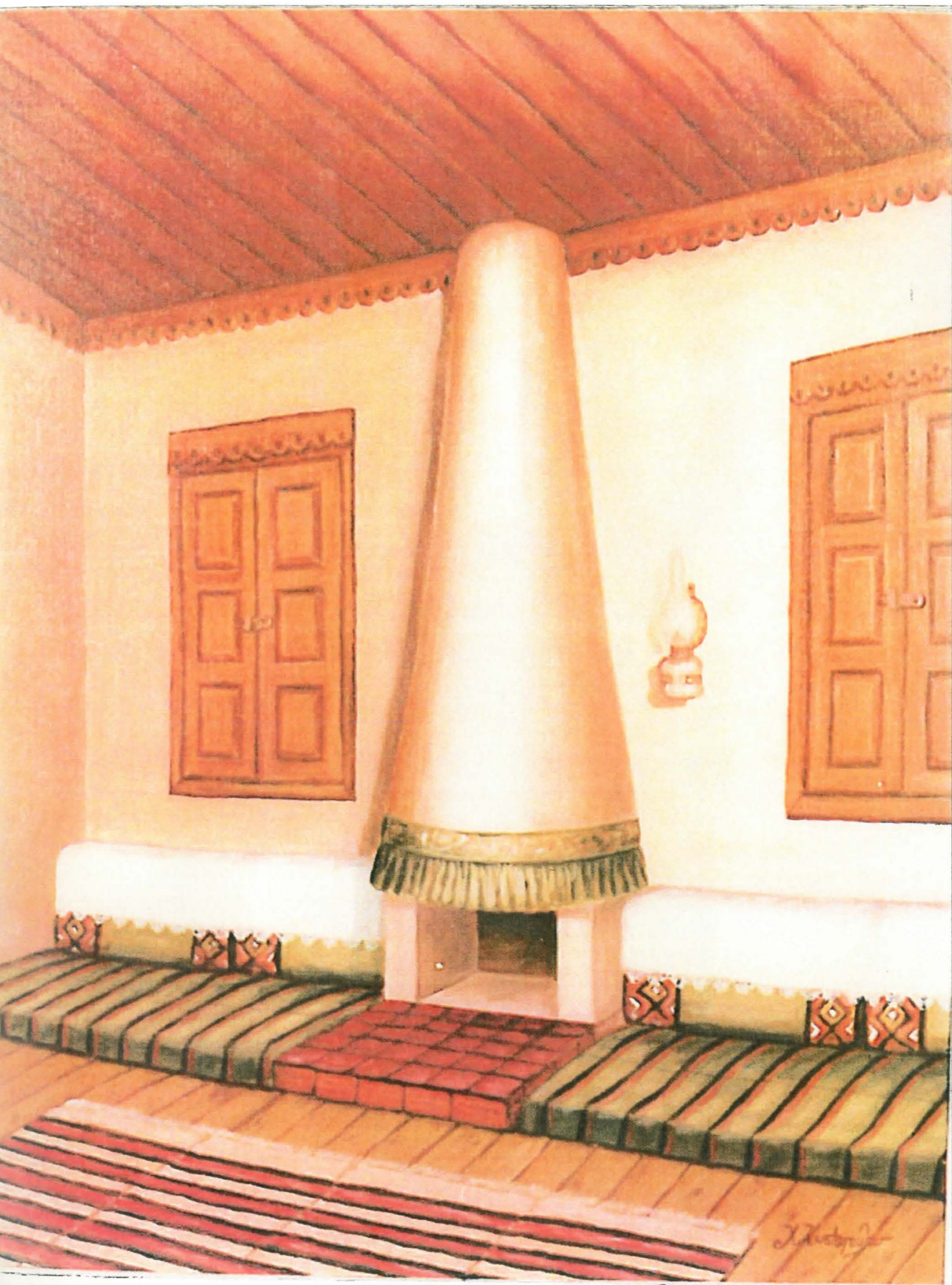
Ξενοεργικό "καθημερινού" δωμάτιον, Βεροιώτικον βημίου