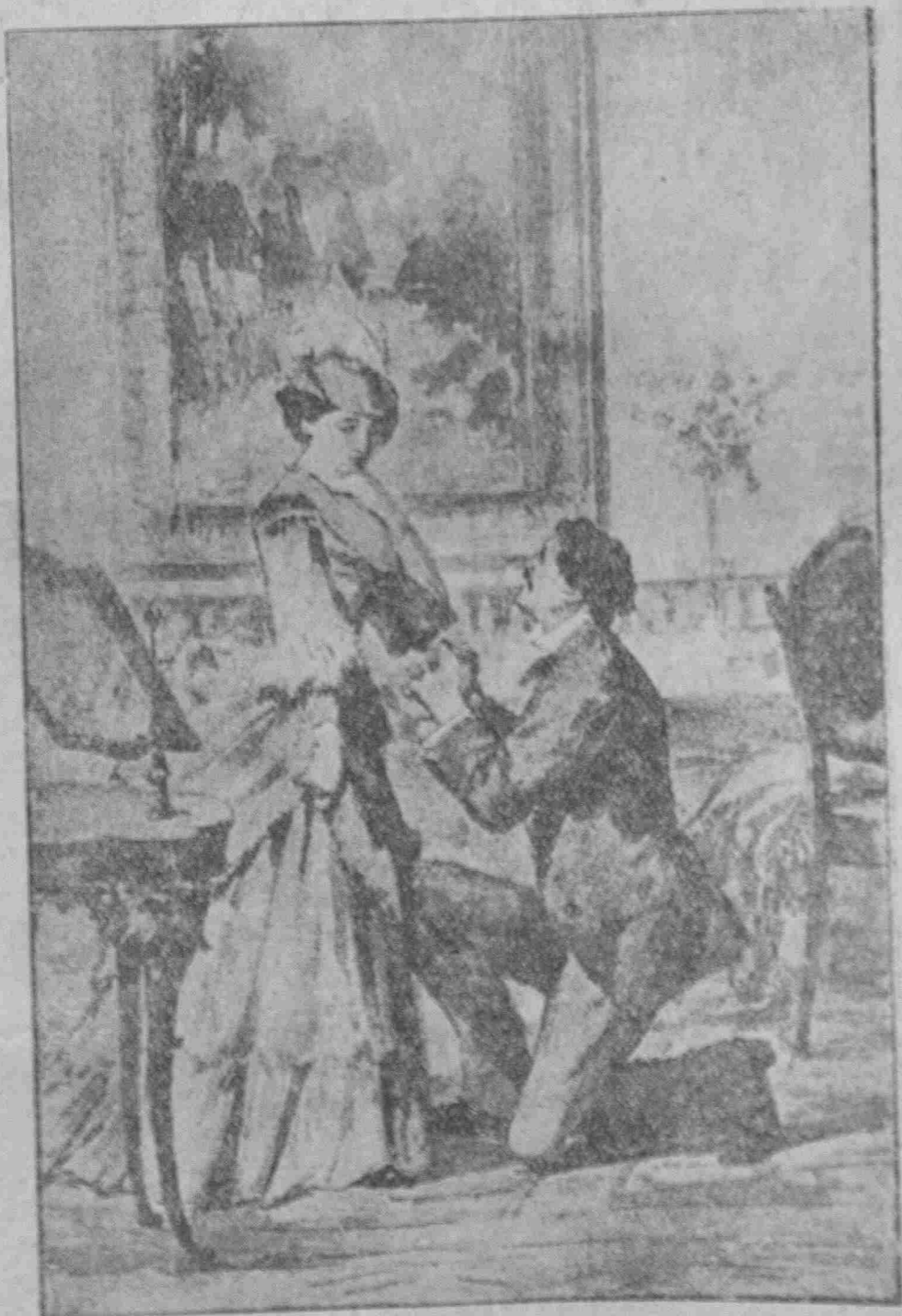
Παῦ ἡμῶν καὶ παρὰ τοῦ Πρακτ. ἠφημερίδων πωλεῖται : Ασπασία, Κλεοπάτρα, Θεοδόρα ἱστορικὴ μελέτη ὑπὸ Ἐφ. Οὐραϊ, τόμος κορυφαίος ἕκ σελ. 200, ἀντὶ γροσίων 3.

— Μορκεσία, εἶπεν ὁ Γεράλδης, κάμπιων τὸ γόνυ ἐνώπιον αὐτῆς, συγχωρήσατέ μοι διότι οὕτως προσέβαλον !