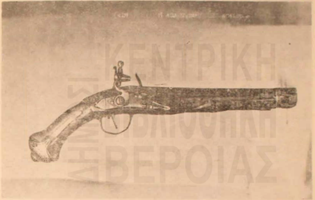
Ἡ πιστόλα «τσιακματούρα» τοῦ καπετάνιου Ἀναστασίου Καμπίτου (πρσελεύσεως, μᾶλλον, ἐκ τῶν φημισμένων ὀπλουργείων τῆς Ναούσης).