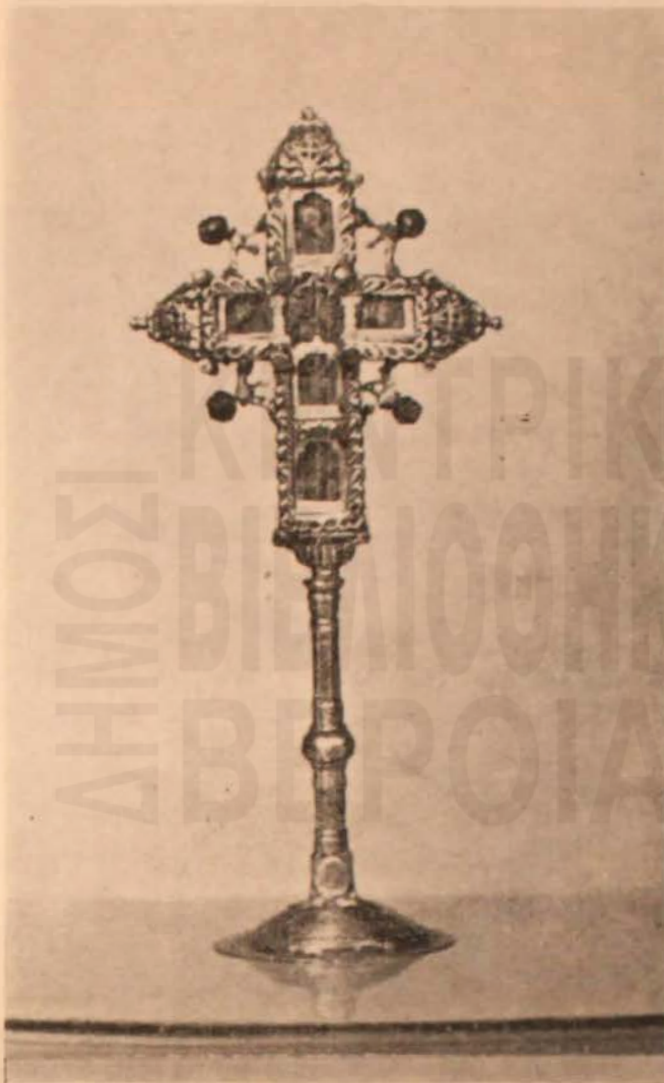
Ὁ τίμιος σταυρὸς τῆς οἰκογενείας Καμπίτου