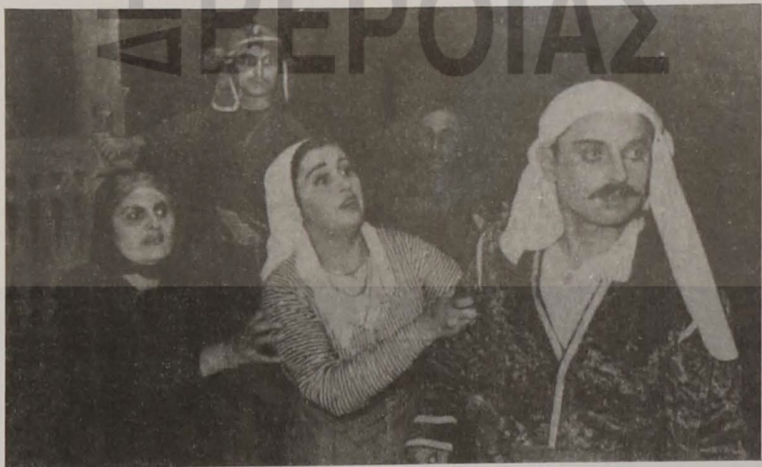
Θ. Κανονίδης, "Της Τρίχας το Γεφύρι" — Παράσταση θεατρικού ομίλου Σοχούμ.

Όλη αυτή η πρόοδος κράτησε ως το 1937 γιατί τη γόνιμη περίοδο του 1917-1937 διαδέχτηκε η αρρωστημένη περίοδος της προσωπολατρίας και του στείρου εθνικά σωβινισμού. Μ' άνωθεν εντολές και χωρίς προσκώματα οι αρχές άρχισαν τις συλλήψεις και εκτελέσεις των Ελλήνων διανοουμένων, έκλεισαν όλα τα ελληνικά σχολεία, τα θέατρα και τις ελληνικές εφημερίδες. Κατέστρεψαν τις ελληνικές εκκλησίες. Εκτόπισαν χιλιάδες Έλληνες στη Σιβηρία και το Τουρκμενιστάν. Εφάρμοσαν με άλλα λόγια συστηματικά πολιτισμική γενοκτονία με αποτέλεσμα οι Έλληνες που φτάνουν σήμερα στην Ελλάδα να είναι τα θύματα αυτών των μέτρων. Έτσι εξηγείται, γιατί πολλοί απ' αυτούς δε γνωρίζουν τη μητρική τους γλώσσα και το λαϊκό τους πολιτισμό.