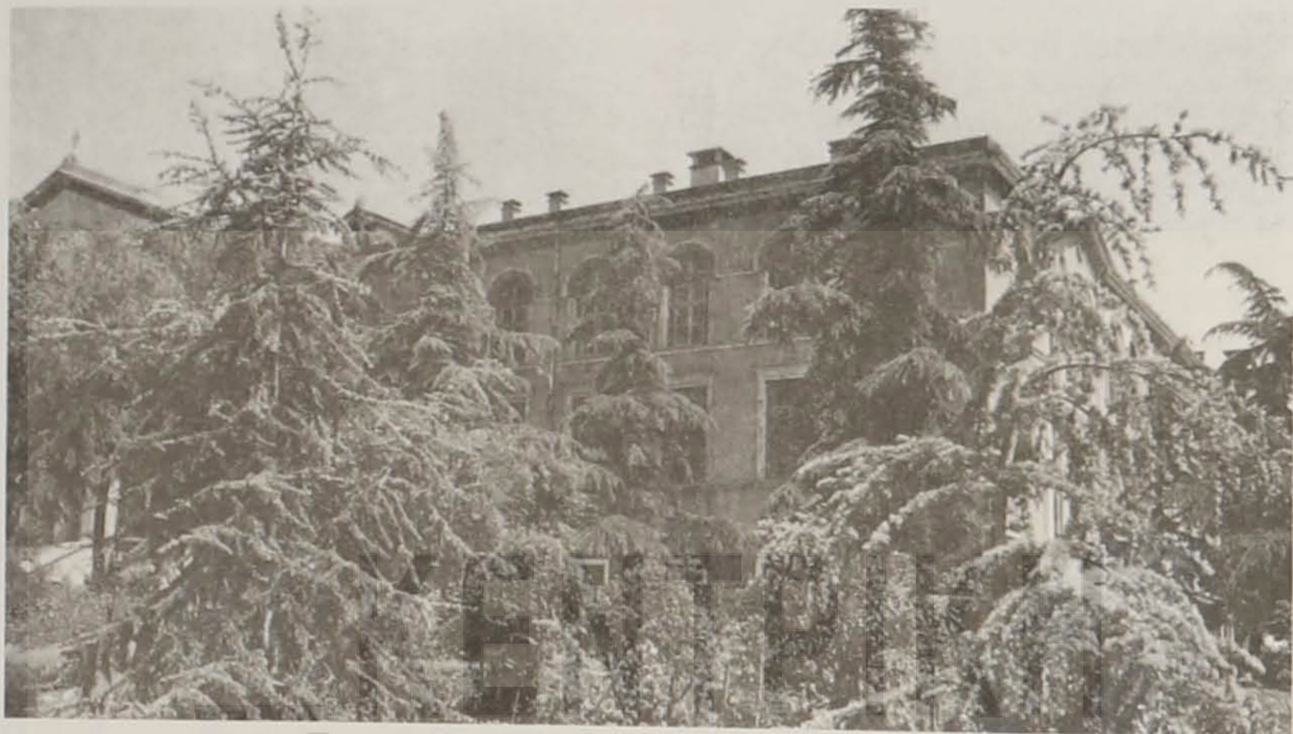
Χαρακτηριστική γενική άποψη της Θεολογικής Σχολής Χάλκης.