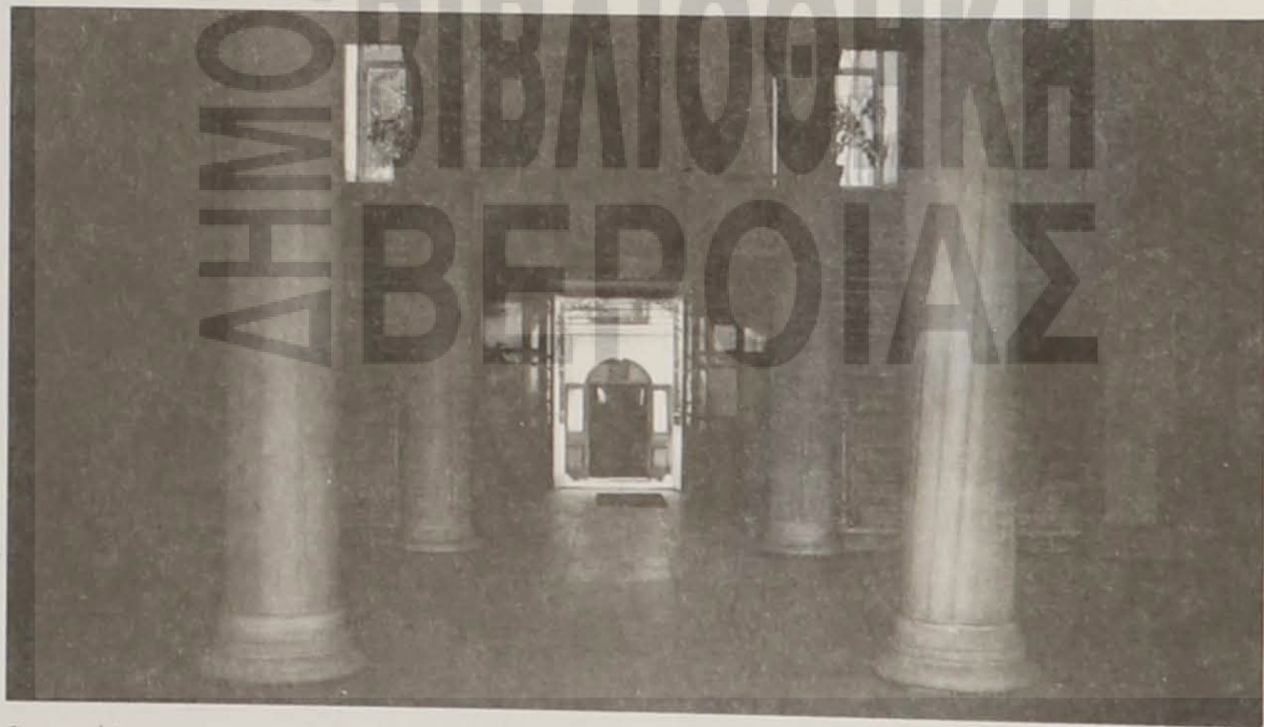
Οι σκάλες που οδηγούν στους πάνω ορόφους της Σχολής — Στο βάθος ο Ναός.

μείο. Την ίδια εκείνη μέρα, με τύλιξε μια πηχτή, γκρίζα ομίχλη και βγήκα από το σώμα μου. Μεμιάς ένιωσα να πλέω στο κενό. Κοίταξα κάτω και είδα το σώμα μου πάνω στο κρεβάτι του νο