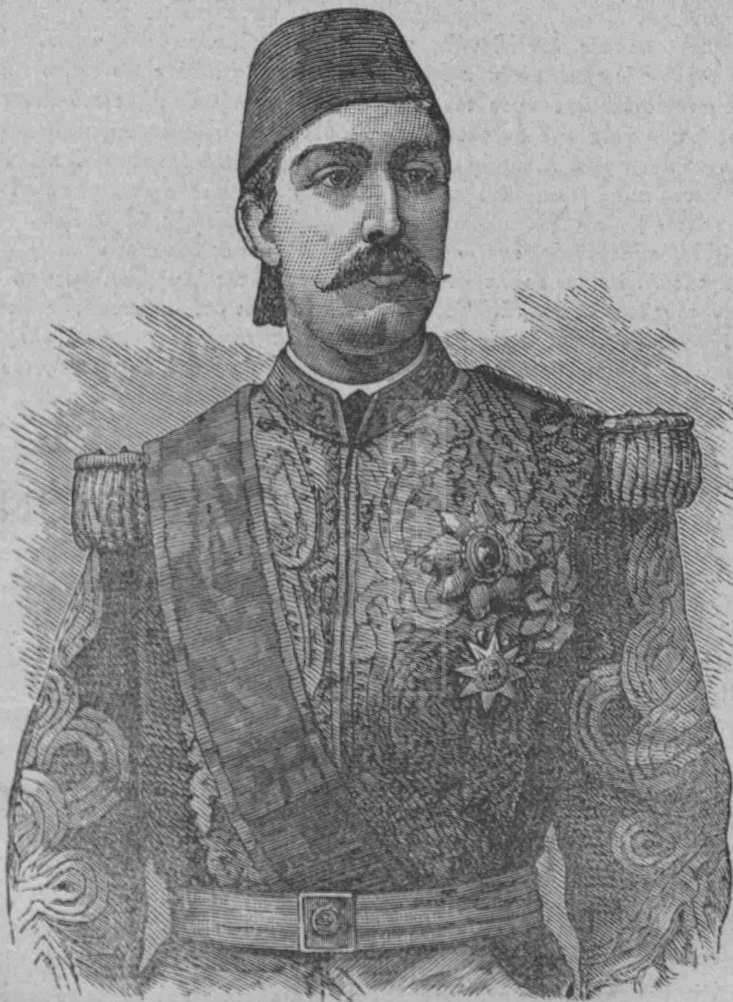
Ο ΑΝΤΙΒΑΣΙΛΕΥΣ ΤΗΣ ΑΙΓΥΠΤΟΥ ΜΩΧΑΜΕΤ ΤΕΒΦΙΚ ΠΑΣΣΑΣ

ξατο νὰ φαίνεται ἐπὶ τῶν ἀγρίων κυμάτων τοῦ Ἰλιάδας καὶ μυριάδας, κατὰ γενεὰς καὶ αἰῶνας, ὠκεανοῦ· ἡ θάλασσα ἐφαίνετο ἐστρωμένη ὑπὸ ἀ- ναριθμήτων προσώπων, ἐστραμμένων πρὸς τὸν ἡ ταραχῆ μου ἦτο ἀκατονόμαστος, ἀπερίγρα- οὐρανόν· βλέπω πρόσωπα ὠργισμένα, ἰκετεύον- πτος, ὁ νοῦς μου ἐταράσσετο καὶ ἐκυμαίνετο ὡς τα, ἀπηλπισμένα, θαλασσομαχοῦντα κατὰ χι- ἡ θάλασσα.» (Ἐκ τοῦ ἀγγλικοῦ ὑπὸ Π. ΙΩΑΝΝΟΥ.)