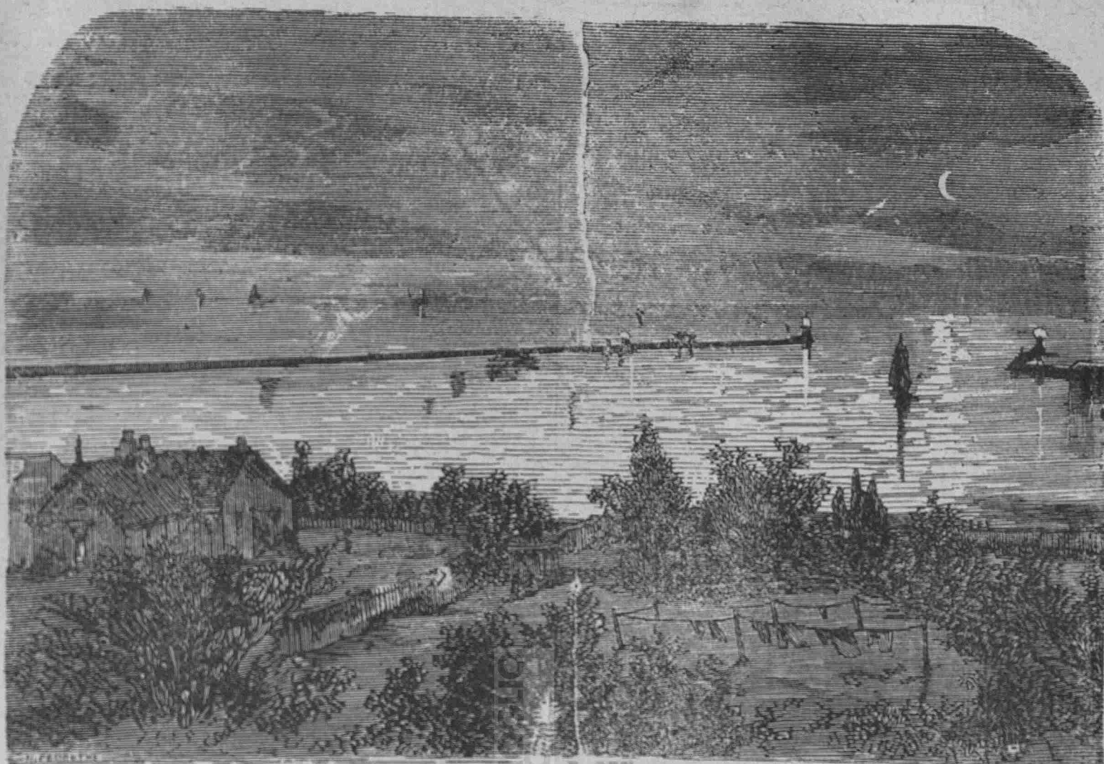
Ο ΠΟΡΘΜΟΣ ΤΟΥ ΣΟΥΛΙΝΑ (Ίδε σελ. 186).

ἀλλ' οὐδέποτε κήμοίρητα νὰ λάβω πτώμα θερ- μὸν χάριν ἐρεῦνης ἐπιστημονικῆς. Μετὰ θερμᾶς παρακλήσεις πρὸς τὸν πρόεδρον τῶν δικαστηρίων, παρέλαβον τὸν ἀπηγγετισμένον καὶ τὸν ἔθηκα ἐπὶ τῆς ἀνατομικῆς τραπέζης Περὶ τὸν 15 λε- πτὰ καὶ ἐγὼ πάντοτε τὸν ἐνόμιζον νεκρὸν. Αἱ- φνης ὁμως παρετήρησα κινήσεις τοῦ στήθους· διὰ τῶν ἐπιγενομένων τρίψεων ὁ σφυγμὸς ἀνέβη εἰς 40· αἱ τοῦ στήθους κινήσεις ἐπήρχοντο τα- χυτέραι καὶ ἰσχυρότεραι· αἱ χεῖρες καὶ οἱ πόδες ἐκινουῦντο σπασμωδικῶς. Διὰ τῆς χρήσεως τοῦ αἰθέρος τὸν ἀπεκοίμησα, ὁ δὲ σφυγμὸς ἀνέβη εἰς 80 καὶ βαθμηδὸν εἰς 120. Μετὰ μεσημβρίαν κατελήφθη ὑπὸ παροξυσμῶν πυρετοῦ καὶ ἐδέησε νὰ δεθῆ. Τῇ ὀγδόῃ ἐσπερινῇ κατέστη ἡτυχώτε- ρος, ἀλλ' ὁ λαιμὸς του ἐξωγχοῦτο πάντοτε πλειό- τερον. Τὴν νύκτα ὅλην διῆλθεν ἀγωνιῶν καὶ μυχιζῶν. Ἐκατοντάδες ἀνθρώπων ἴσταντο ἔ- ξωθεν τοῦ νοσοκομείου καὶ ἐκραύγαζον κατὰ τῆς ἀρχῆς. Τῇ ἐβδόμῃ τῆς πρωΐας ἤνοιξε πάλιν τοὺς