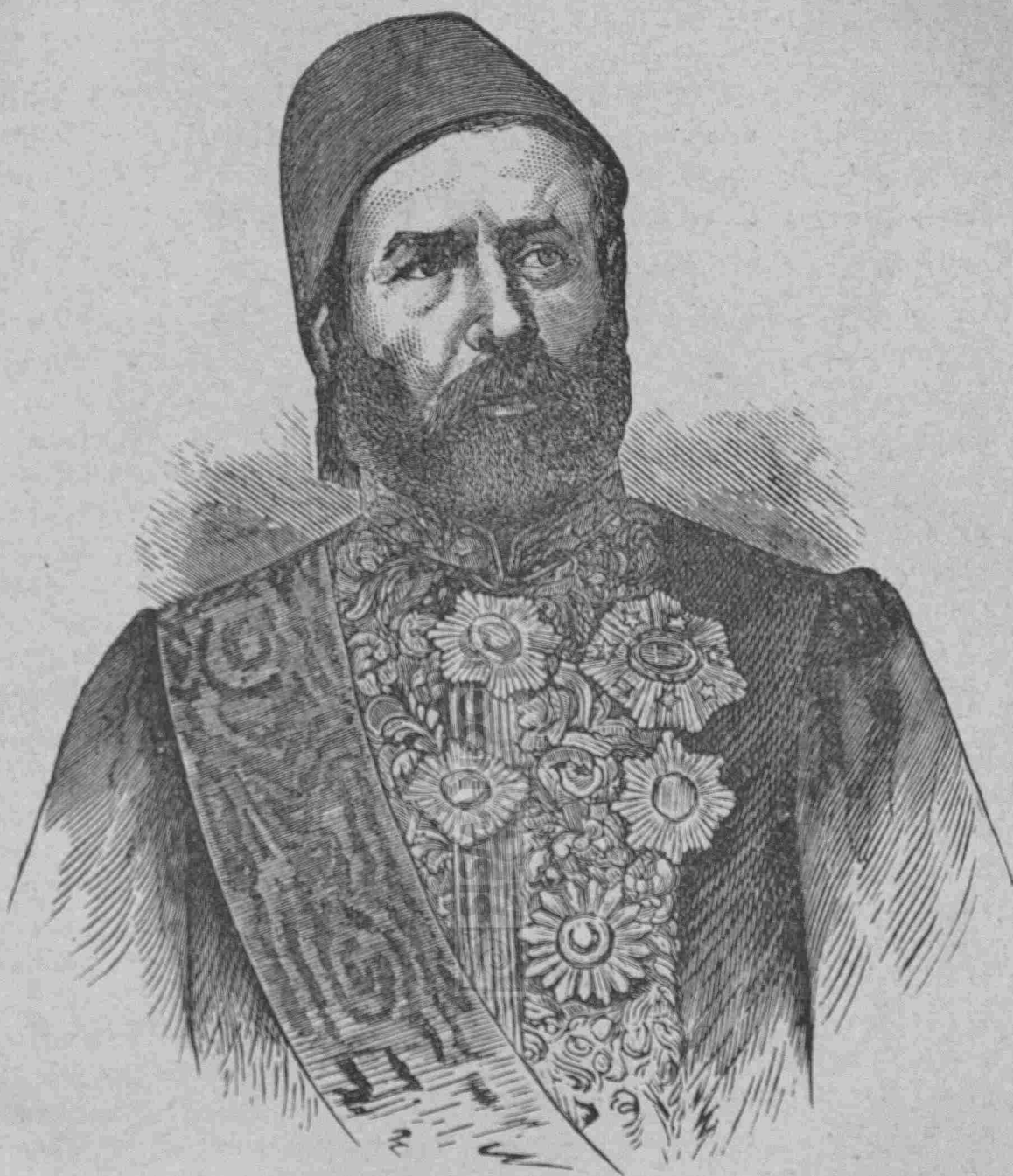
ΣΑΒΒΑ ΠΑΣΣΑΣ ΥΠΟΥΡΓΟΣ ΤΩΝ ΕΞΩΤΕΡΙΚΩΝ.

Ἡ διεύθυνσις τοῦ « Γραφικοῦ Κόσμου » ὑπόσχεται νὰ δημοσιεύσῃ προσεχῶς τὴν βιογραφίαν τοῦ ἀνωτάτου τούτου λειτουργοῦ ἅμα ὡς ἡ Α. Ε. εὐαρεστηθῆ νὰ ἐπιτρέψῃ αὐτῇ τούτο.