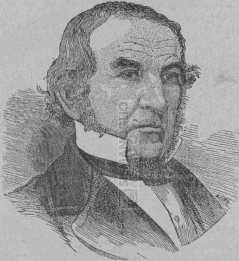
Ὁ νέος πρωθυπουργὸς τῆς Ἀγγλίας κ. ΓΛΑΔΣΤΩΝ.

Οὐδεὶς ἠδύνατο νὰ ἀμφιβάλλῃ περὶ τούτου. Ἡ βασίλισσα τῆς Ἀγγλίας οὐδέποτε παρεκτρέπη τῶν μεγάλων συνταγματικῶν ἀρχῶν, αἵτινες εἰσιν ἡ ἀρχὴ καὶ ἡ δύναμις τοῦ ἀγγλικῶ πολιτικῶ συστήματος. Δυνάμεθα νὰ εἴπωμεν ὅτι νέα ἐποχὴ ἀνατέλλει σήμερον διὰ τὴν Ἀγγλίαν. Ἡ ὑπὸ τοῦ ἐξόχου τούτου πολιτικῶ παραδοχῆ τῆς πρωθυπουργίας καὶ τοῦ Ὑπουργείου τῶν Οἰκο-