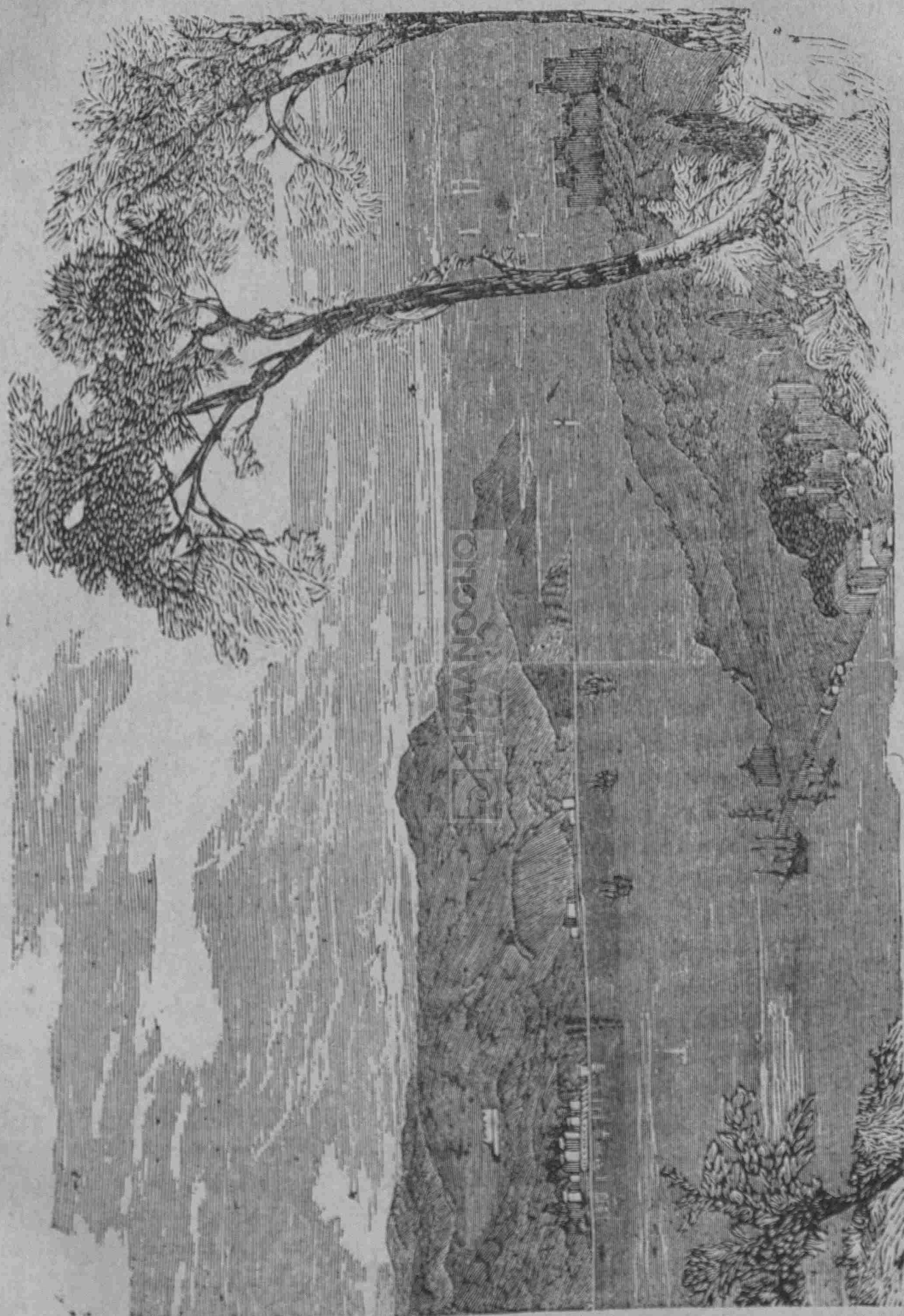
ΤΟ ΠΑΡΑ ΤΟΝ ΕΓΓΕΙΝΟΝ ΠΟΝΤΟΝ ΣΤΟΜΙΟΝ ΤΟΥ ΒΟΣΠΟΡΟΥ. (Ίδε σελ. 154)