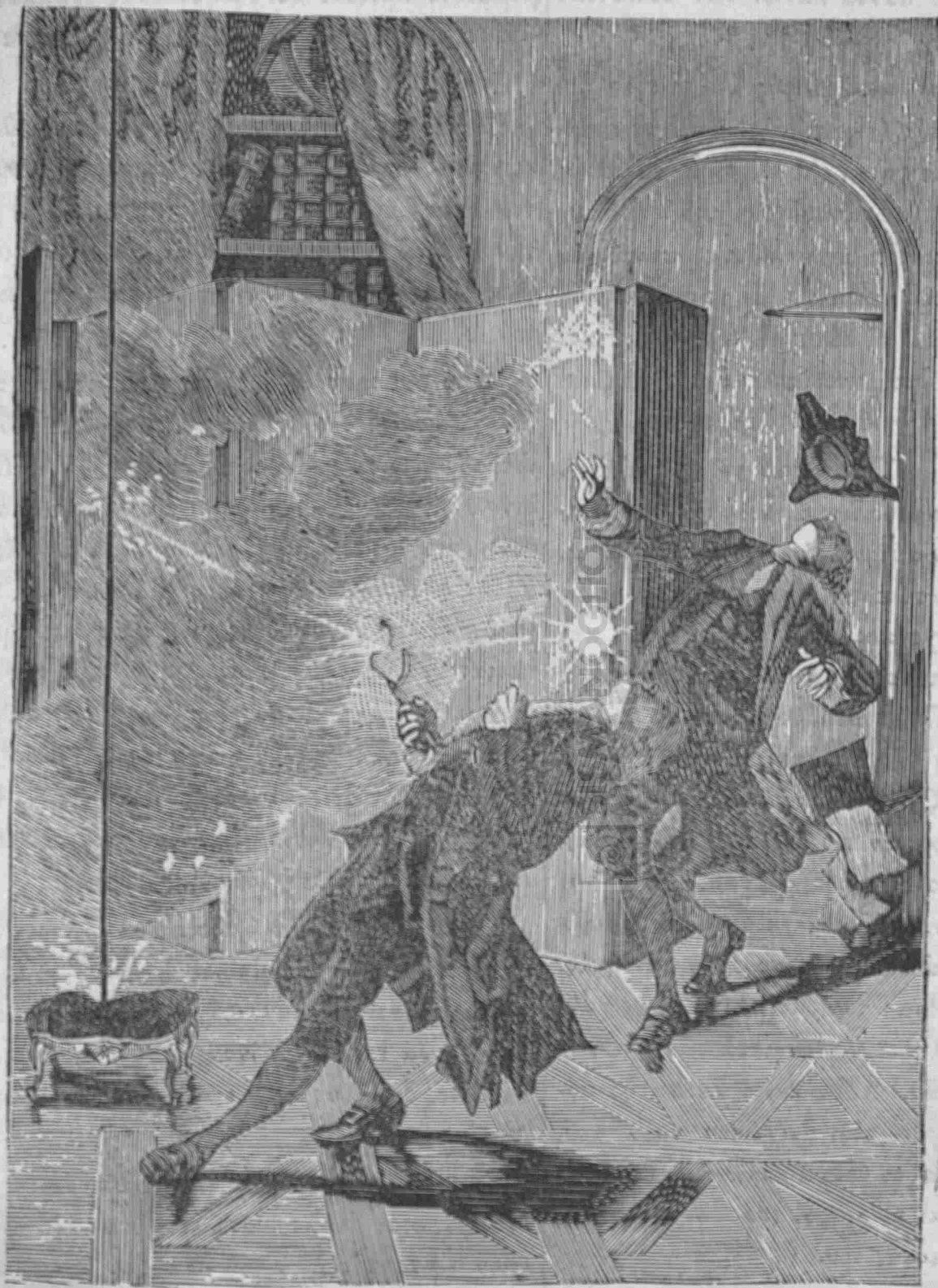
(Σχ. 2) Ὁ κεραυνοβόλος θάνατος τοῦ Ριχμάνου. (σελ 404).

Οὕτω καὶ ἐν τῷ Ἰωάννῃ ἔμελλε νὰ γεννηθῇ ὁ ἀρίστος πόνος πρὸς τὸ χειρίζεσθαι τὰ χρώματα, ἐπειδὴ κατὰ δύο ὅλα ἔτη καὶ ζωγραφίας ἔβλεπε καὶ ἐνόσων ἤκουεν ἀνδρῶν, μέγχις ἀστρῶν ἀνυψούντων τὴν ζωγραφικὴν τέχνην. Ὅθεν, θέλων νὰ ἡδύνη τὰς μακρὰς τῆς μονώσεως ὥρας, καθ' ἃς ἀνέμενε τοῦ κυρίου του τὴν ἐπάνοδον, ἐπειρᾶτο νὰ ζωγραφῇ. Εἶχε δὲ μόνα ζωγραφικὰ ὄργανα ὅσους ἐνθεν κἀκεῖθεν συνέλεγε τετριμμένους χρωστῆρας καὶ χρωμάτων ἀχρηστὰ λείψανα, διὸ καὶ