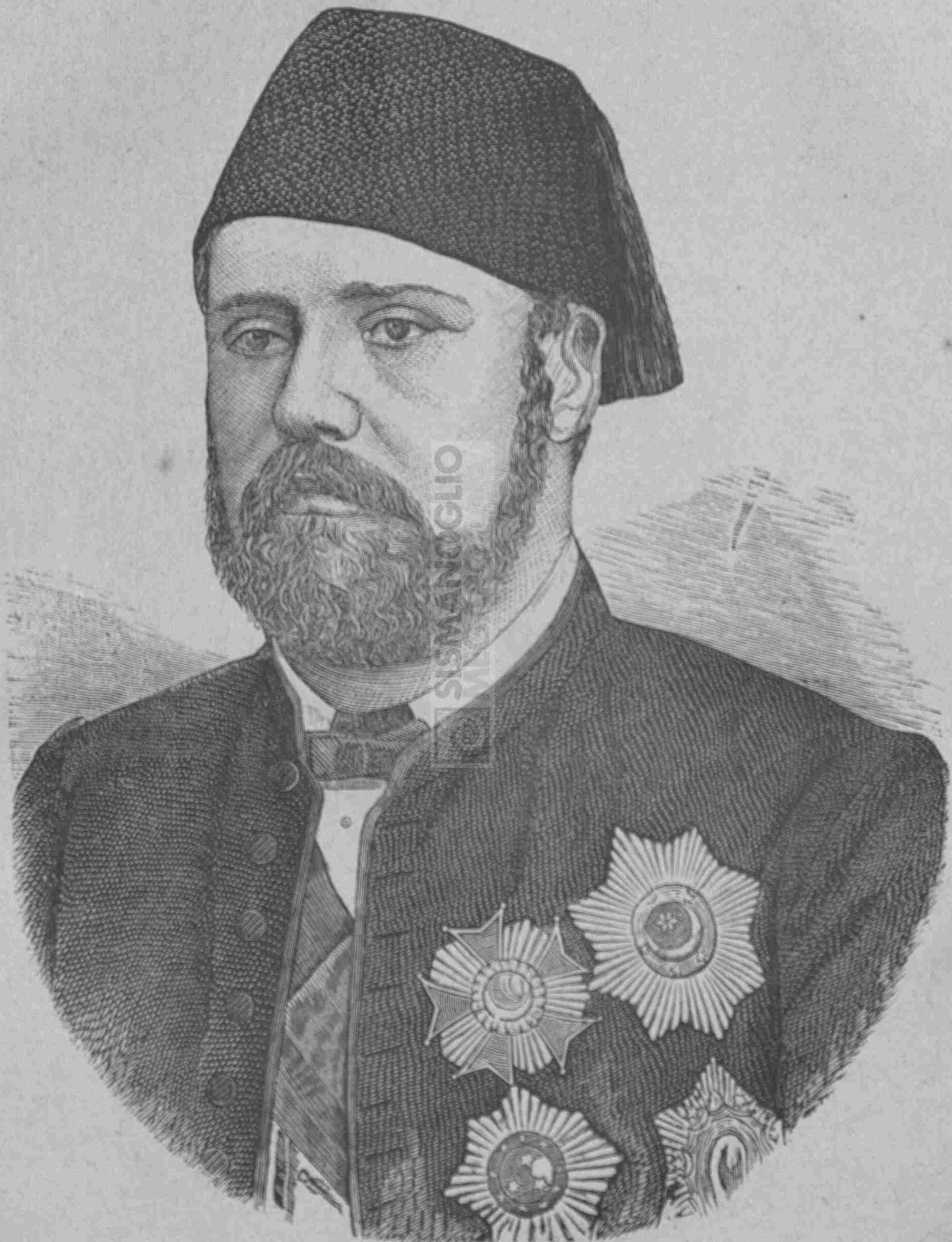
Ὁ πρῶτος ἀντιβασιλεὺς τῆς Αἰγύπτου ΙΣΜΑΗΛ ΠΑΣΣΑΣ.

Ὁ Ἀρχιμήδης δὲν ἦτο μόνον θεωρητικὸς νοῦς. Ἄν ἦτο μόνον τοιοῦτος, δὲν θὰ ἀπῆλαυε βεβαίως τῆς ἐπιστημονικῆς δόξης, ἧς μέχρι τῆς