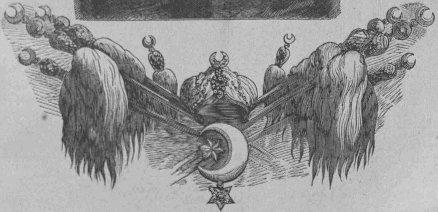
Η Α. Α. Μ. Ο ΣΟΥΛΤΑΝΟΣ ΑΒΔΟΥΛ ΧΑΜΗΤ ΧΑΝ Ο Β΄.