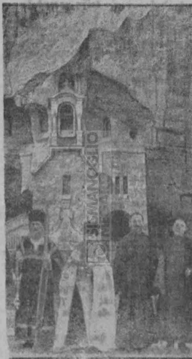
Ὁ γὰρ τῆς μονῆς Ἰνκιρμαν ἐν Οὐκρανίᾳ, ἐκτισμένος ἐν βράχῳ.

Εἰλικρίνεια δὲ δὲν σημαίνει μόνον τὸ ἐναντίον τοῦ ψεύδους, ὅπερ ἐξευτελεῖ τὸν ὑπ' αὐτοῦ κατεχόμενον ἀπέναντι αὐτοῦ τοῦ ἰδίου. Δὲν εἶναι προτιμώτερον νὰ ὁμολογήσῃ τις ἀπ' ἀρχῆς τὸ σφάλμα του, παρὰ νὰ προσπαθῇ νὰ τὸ καλύψῃ διὰ τοῦ ψεύδους; χειρότερον δὲν εἶναι τὸ αἰσχος καὶ ἡ στενοχωρία, ἡ κατακλύζουσα τὴν καρδίαν τοῦ ψεύστου, ἀπὸ τὴν ἐλαφρὰν προσβολὴν τῆς κακῶς ἐννοουμένης φιλοτιμίας; Ἄλλ' ὁ ψεύστης ἂς ἔχη πάντοτε ὑπ' ὄψιν, ὅτι οὐδένα ἀπατᾷ, ὁμοιάζει δὲ πρὸς τὴν στρουθοκά-