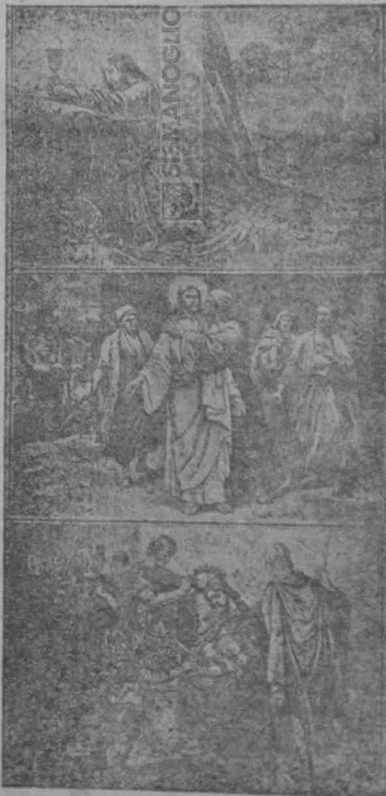
Ἡ ἀγωνία. Ἡ παράδοσις. Ἡ φραγκέλωσις.