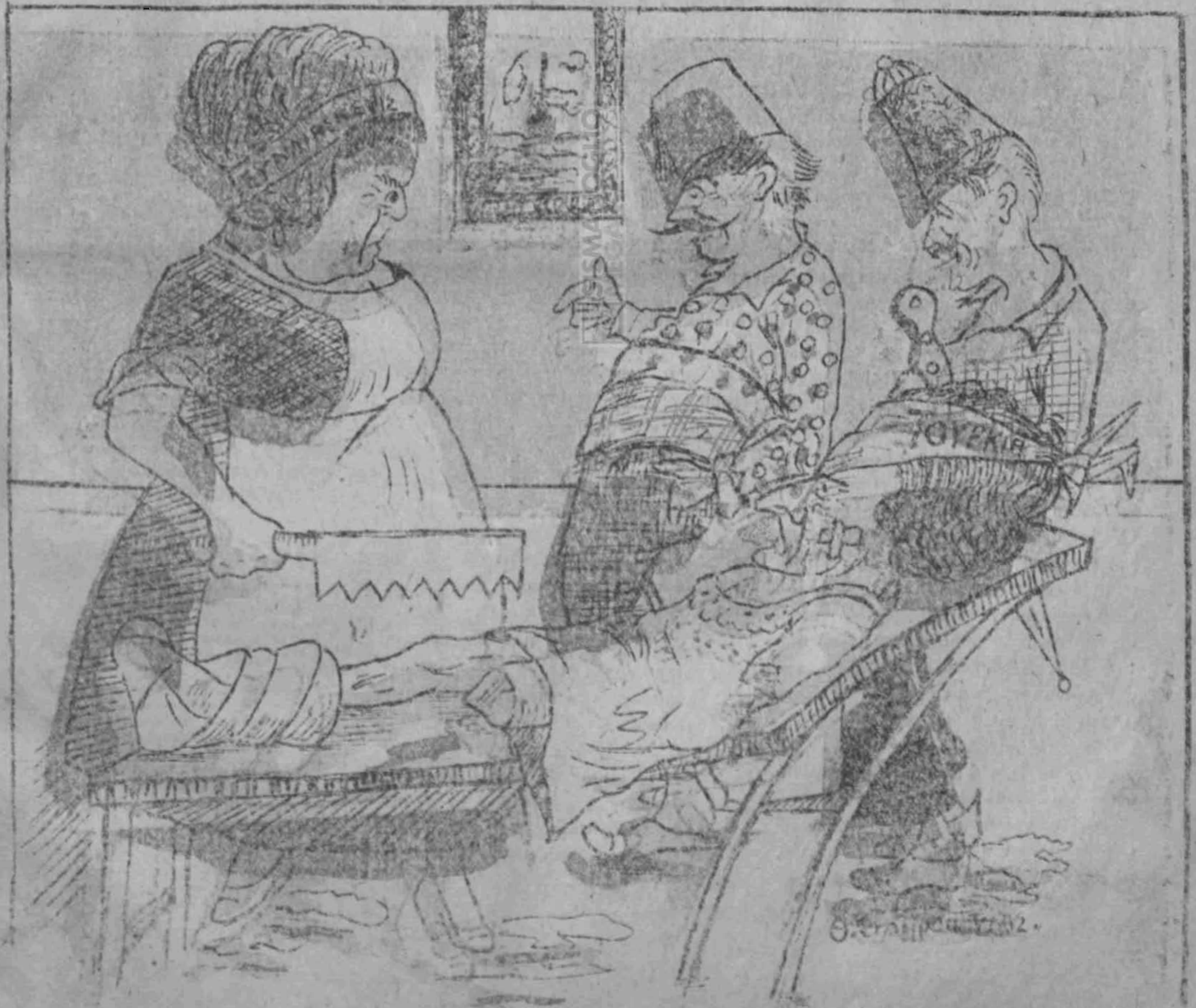
‘Ο Ταϊλάρ εις τήν γιατρέσσαν. Δίνε φάρμακον, καὶ σὲ γὰρ ποῦ τὴν εὐνοίαν εἶπες;.....