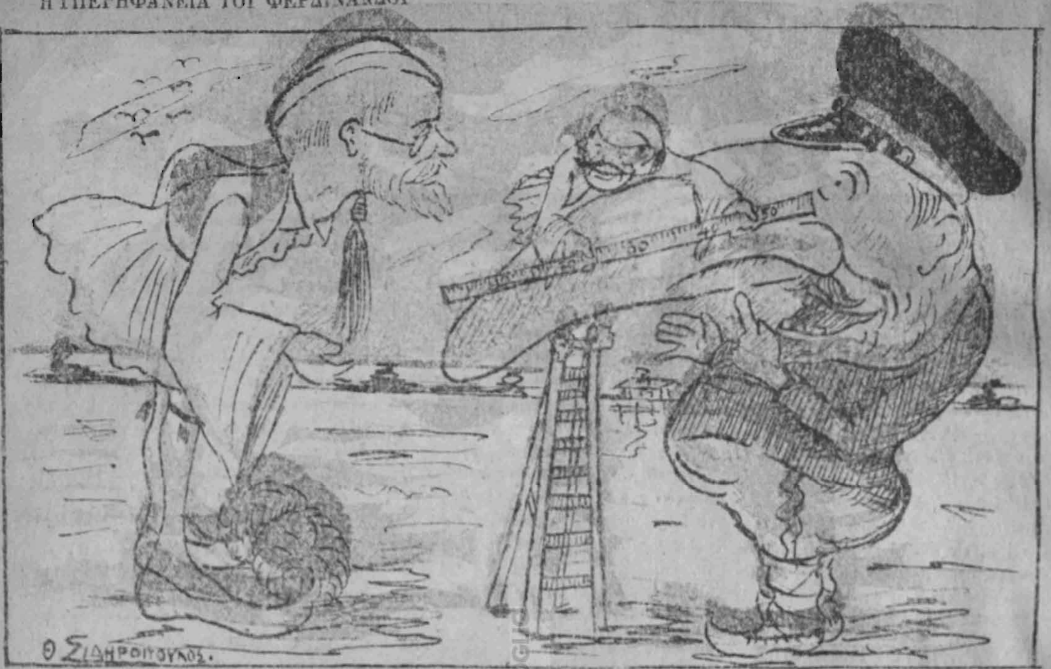
Φερδινάνδος. -- Γιατί, κύρ-Βανιζέλε, που υπαργησανάβουσαι πώς έχεις μεγάλο κεφάλι. 'Εγώ έχω μεγαλύτερη μύτη απ' τὸ κεφάλι σου.