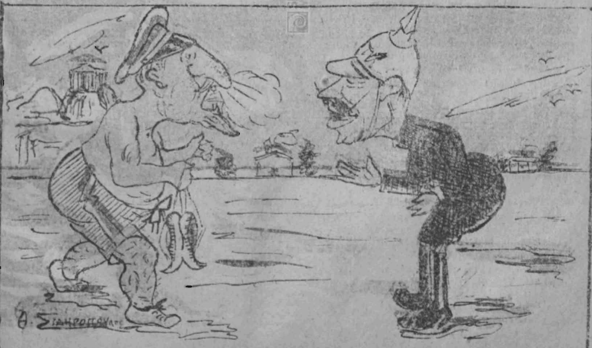
Κάζερ. — Τι γάλια είναι αυτά ; Έτσι λαχανιασμένος ; Φερνάνδος. — Έτοιμάζομαι διὰ τοῦς Ὀλυμπιακοῦς ἀγῶνας. Κάζερ. — Ἄβουκα κοπιᾶζεις διότι οἱ Ἕλληνας ξεύρουν πῶς πέρασες τὸ ρεκόρ στὸν δρόμο μετὰ τὸν Βαλκάνικ κα' στὸν Παλαιολογικόν.