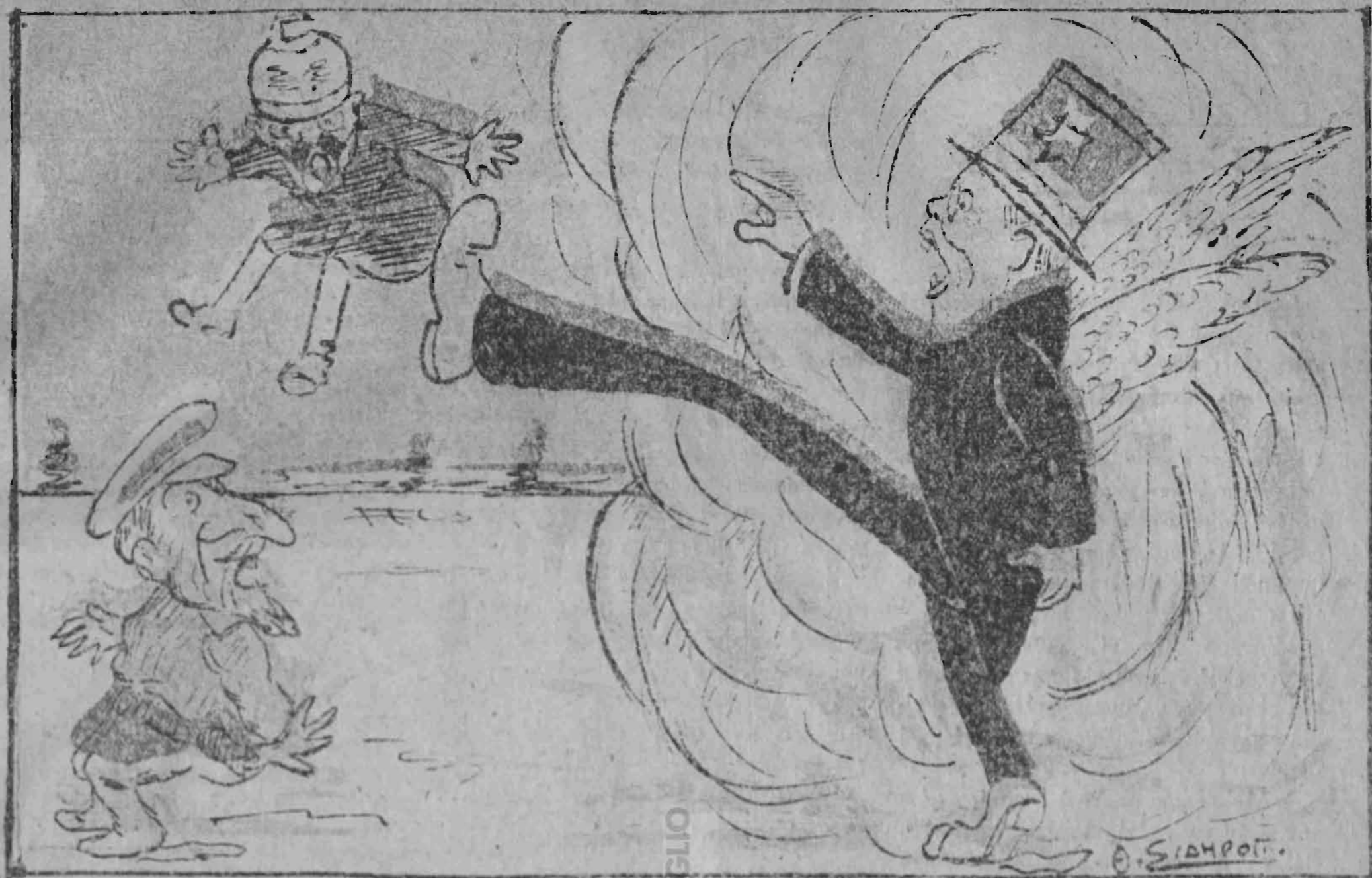
— Άγγελος πρωτοστάτης αμερικάνων επέμφθη, ειπείν αυτοίς τὸ χαιρε.....