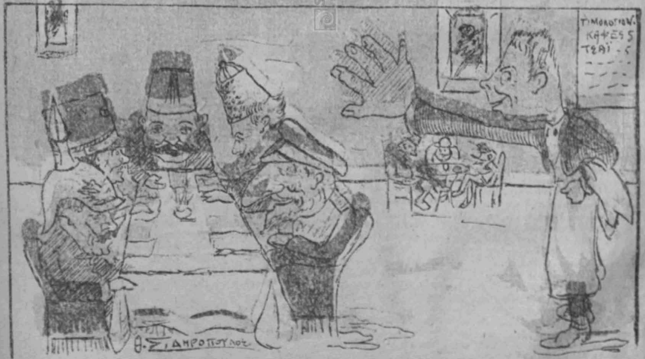
Τὸ ἀντισυνέδριον τῆς εἰρήνης!!!!..