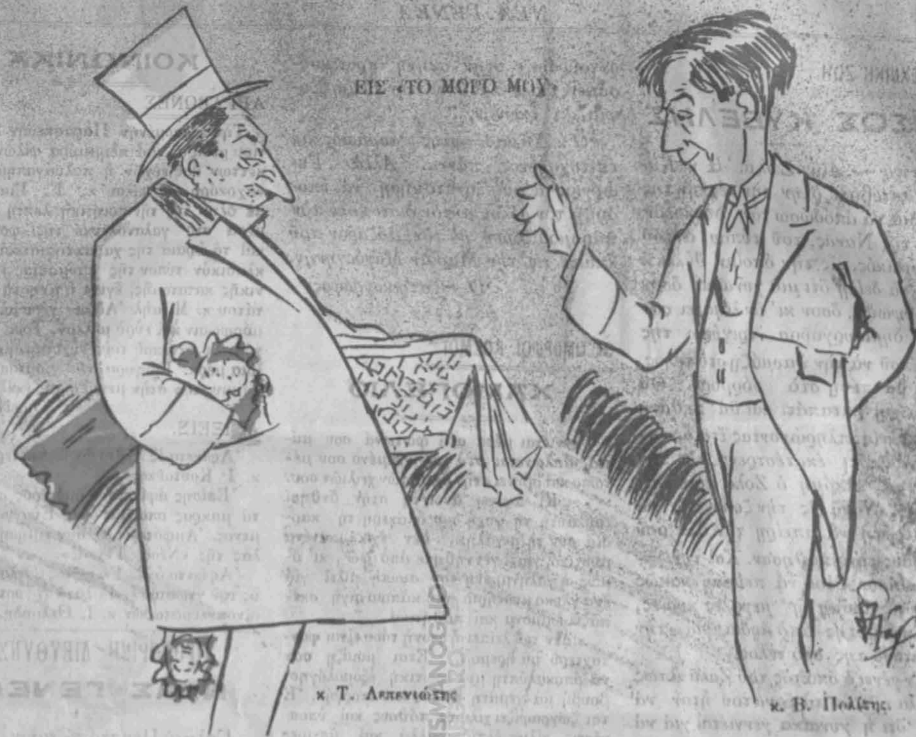
κ. Τ. Λεπενιώτης