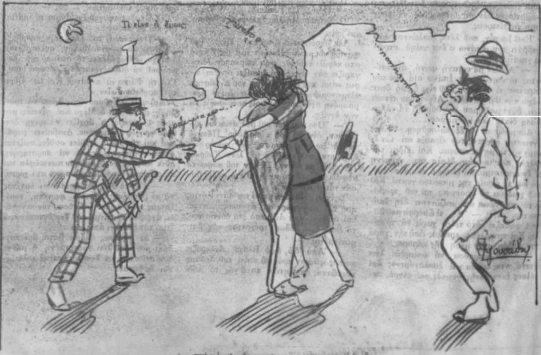
Τι είναι ο έρωας