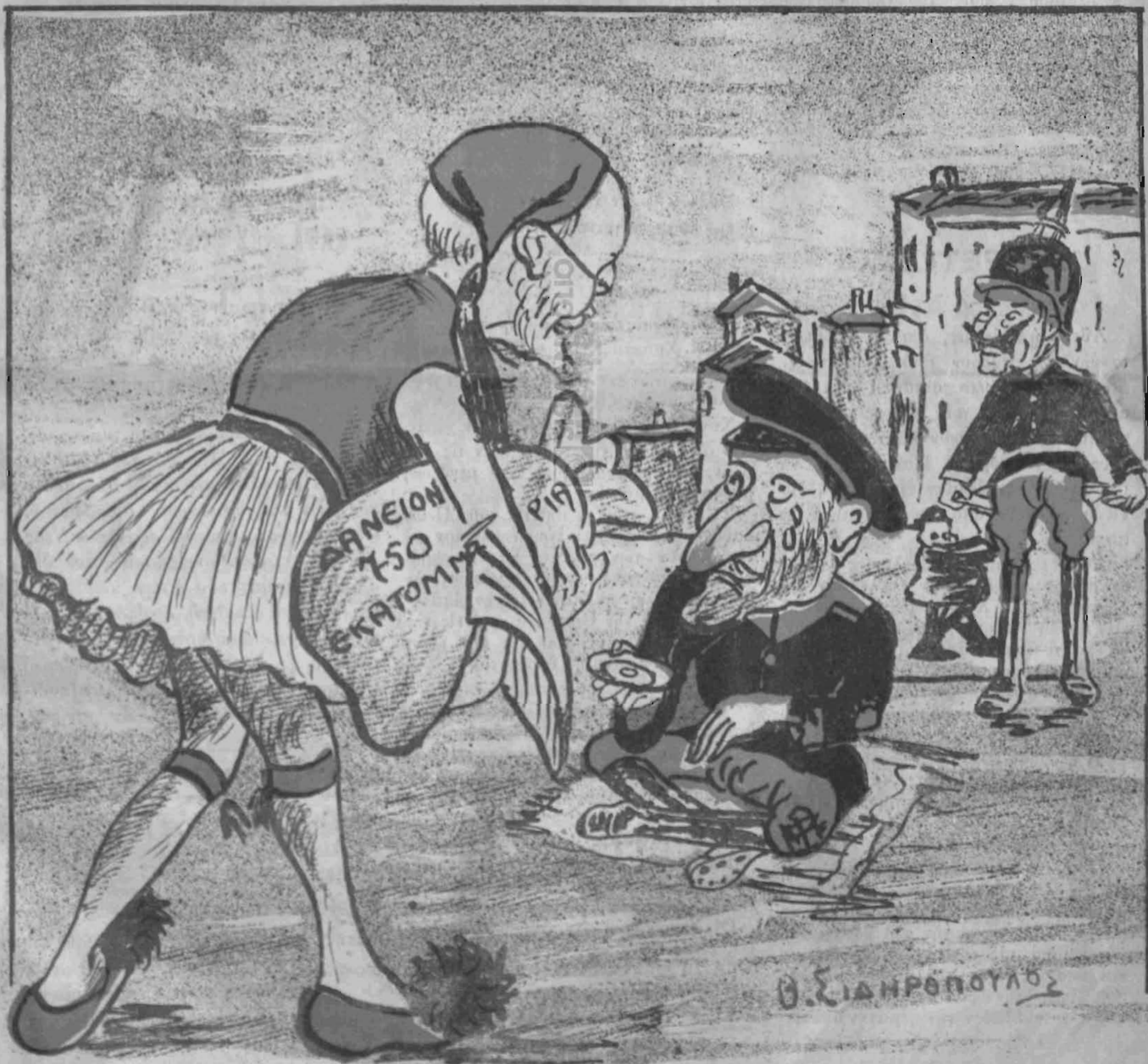
Ὁ ζητιάνος—'Ἐλέησε καὶ μένα τὸν φουκαῶ. Βενιζέλος—Σύμμαχον Κάιζερ ἔχεις, αὐτὸς νὰ σ' ἐλέησῃ.