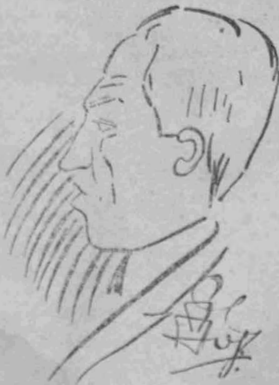
Ἐκ τῶν συντακτῶν κ. ΘΡΡΡΡ. Μ.ΤΣΑΚ.