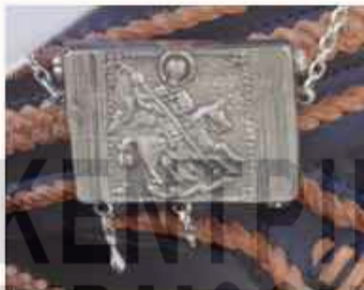
Εγκόλιπο με τον Αγ. Γεώργιο

Παραλληλόγραμμο κόσμημα διπλής όψεως από μαλακό επάργυρο ή ασήμι. Ήταν σκαλισμένο στο χέρι. Στην μια πλευρά απεικονιζόταν ο Άγιος Γεώργιος και στην άλλη μια οποιαδήποτε ψυχεδέλεια - συνήθως κλαδί της αμπέλου.