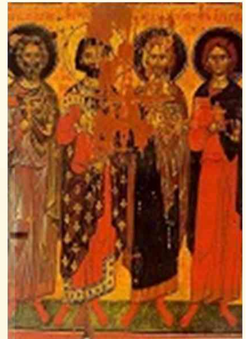
Άγιοι Ευγένιος, Ουαλεριανός, Κάντιδος και Ακύλας οι εκ Τραπεζούντας (Ο άγιος Ευγένιος φέρει χρυσό φωτοστέφανο αντι βαθυκόνανο) - γύρω στα 1375 μ.Χ. - Μονή Διονυσίου, Άγιον Όρος

Ο Άγιος Ευγένιος, ήταν ο πρώτος Επίσκοπος της Τραπεζούντας , 2ος μετά τον ιδρυτή της Απόστολο Ανδρέα .