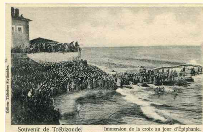
Souvenir de Trébizonde. Immersion de la croix au jour d'Épiphanie.

Το Δωδεκαήμερο τελειώνει με τη γιορτή των Φώτων. Σύμφωνα με την παράδοση των Ποντίων, την ημέρα που αγιάζουν τα ύδατα σταματούν να τριγυρίζουν μέσα στη νύχτα και να πειράζουν τους ανθρώπους και οι καλικάντζαροι (τα πνεύματα).