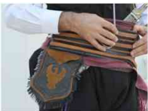
Δερμάτινο ζωνάρι σε ανοιχτό καφέ και μαύρο Στο πλάι, η καπνοσακούλα

Είδος δερμάτινης ζώνης. Την φορούσαν για να συγκρατούν τα παντελόνια (καραφόνια, σαλβάρ, ποτούρ). Το μήκος του ήταν 1 μ. ή 1,50 μ., και το φάρδος του 3, 5, ή 7 εκ., μπορεί και 10 εκ. Στο ένα άκρο υπήρχε μεταλλική πόρπη.