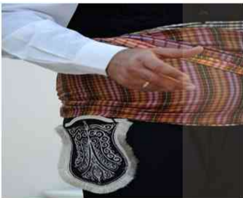
Λεπτομέρειες από ένα μεταξωτό ταραπουλούζ

Κουσακ Λέξη τουρκική. Είδος ζωναριού που το κατασκεύαζαν από μάλλινο ή βαμβακερό ύφασμα. Το φορούσαν κυρίως οι άντρες με την καθημερινή τους φορεσιά σε διάφορα χρώματα (μπεζ, κεραμιδί, ώχρα) ή ριγωτό σε διάφορα χρώματα του σαφράν και της παπαρόνας. Το μήκος του ήταν 3,5 ή 4 μέτρα και το φάρδος του ήταν 30 εκ. Στις δύο άκρες του υπήρχαν κλεμιά.