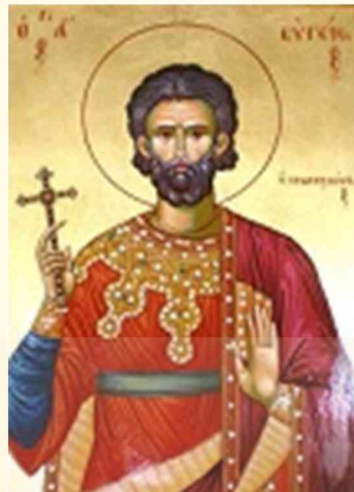
Άγιος Ευγένιος ο πολιούχος της Τραπεζούντας