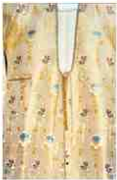
Λεπτομέρειες από αυθεντική ζιπούνα

Μακρύ μανικωτό φόρεμα χωρίς ραφή στους ώμους. Η βάση του ήταν ένα κομμάτι μήκους 3 μ. και φάρδους 50 εκ. (τα υφάσματα εκείνη την εποχή ήταν μονόφαρδα, 50-80 εκ.). Το διπλώναν στη μέση και έδιναν μια ψαλιδιά 6 εκ. οριζόντια και 8 εκ. κάθετα για λαιμόκοψη. Από τους ώμους κάθετα προς το στήθος έδιναν άνοιγμα 25 εκ. Στα τέσσερα πλαϊνά ένωναν κομμάτια υφάσματος 1 μ. ύψος, 3 εκ. επάνω και 20 εκ. κάτω.