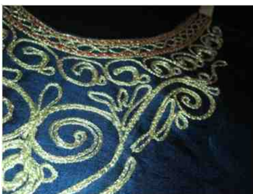
Λεπτομέρειες από το σπαρέλ (ή σπαλέρ)

Υποκάμισο που συνόδευε την επίσημη ενδυμασία. Για το καμίς χρησιμοποιούσαν μεταξωτό κουκούλι, χασέ και δαντέλα. Το μεταξωτό το έβαζαν σε εμφανή σημεία (μανίκια και στήθος) και το χασέ σε κρυφά σημεία (πλάτη και πάνω μέρος χεριών). Τη δαντέλα την χρησιμοποιούσαν στα τελειώματα του ρούχου (μανίκια και γιακά).