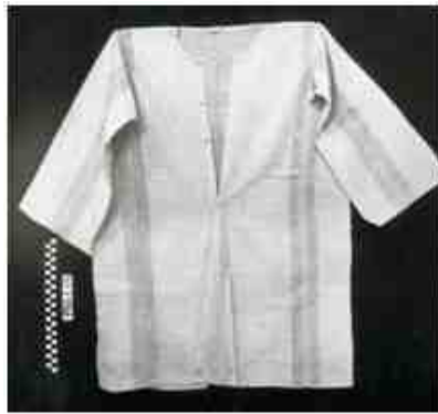
Αυθεντικό καμής

Υποκάμισο σε μπεζ ή άσπρο κυρίως χρώμα αλλά και σε ρίγα και πιτ-καρό, σε διάφορες αποχρώσεις με όρθιο ή κλασικό γιακά, μανίκια σε ίσια γραμμή ή μανσέτα με δυο κουμπιά και άνοιγμα εμπρός μέχρι το στήθος και πέντε κουμπιά.