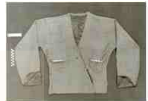
Αυθεντικό αμπάς

Αντρικό σακάκι που αποτελούσε με το γιλέκο και την ζίπκα την αντρική φορεσιά. Το ύψος της ξεκινούσε από τους ώμους και κατέληγε στους γοφούς. Την κατασκεύαζαν από τσόχινο ή κασιμιένιο ύφασμα σε διάφορα χρώματα. Επάνω είχε στενό γιακά και κουμπωνε μπροστά σταυρωτά, δεξιόστροφα ή αριστερόστροφα. Τα μανίκια ήταν μακριά και στις άκρες σχιστά. Μερικά ήταν επενδυμένα με γυαλιστερό ύφασμα σε διαφορετική απόχρωση από το υπόλοιπο ρούχο. Στους ώμους και στους αγκώνες ήταν ραμμένο διπλό ύφασμα που στο τελειωμά του είχε κεντημένο κορδόνι. Αντρική ζιπούνα συναντάμε σε διάφορα σχέδια σε όλο τον Πόντο.