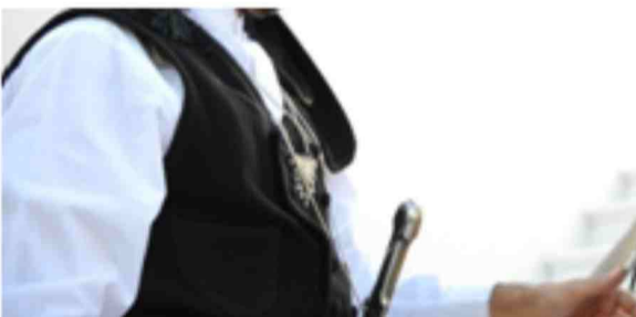
Μαύρο ανδρικό γιλέκ

Γιλέκο σε τσόχα ή κασμίρ ύφασμα μονόχρωμο, αλλά και βαμβακομέταξο ριγωτό. Το μήκος του ξεκινούσε από τον ώμο έως την λεκάνη περίπου στα 65 εκ., και ήταν κεντημένο με κορδόνι σε διάφορα χρώματα. Είχε δύο τσέπες δεξιά και αριστερά κάτω από το στήθος. Έκλεινε από τα δεξιά προς τα αριστερά. Το γιλέκο ήταν σε σταυροκούμπωτο ή μονοκούμπωτο σχέδιο. Τα κουμπιά ήταν μεταλλικά, υφασμάτινα ή γαϊτάνι.