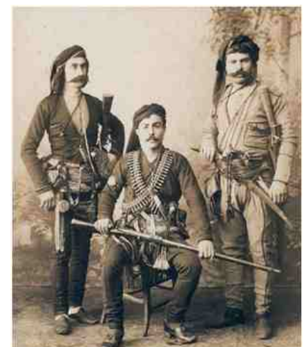
συνεχίζεται στο επόμενο φύλλο

Κατασκευασμένη από μάλλινο ύφασμα, φοδραρισμένη ή αφοδράριστη. Την αντρική τσόχα την συναντάμε σε τρία διαφορετικά μήκη. Στην μια περίπτωση το ύψος ξεκινάει από τους ώμους, καταλήγει στη μέση και κουμπώνει μπροστά. Στη δεύτερη περίπτωση το ύψος ξεκινάει από τους ώμους και καταλήγει στους γοφούς, και στην τρίτη περίπτωση το ύψος ξεκινάει από τους ώμους, καταλήγει στο μπούτι και κουμπώνει μπροστά. Έχει τσέπες δεξιά και αριστερά, και μερικές φορές την συναντούμε με γιακά μονόπετο.