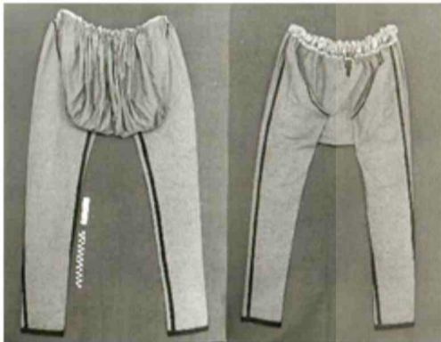
Αυθεντική Ζίπκα

Ενδεχομένως σύνθετη λέξη από την ξενική ζιπ (παντελόνι) και την ελληνική κα (κάτω). «Το παντελόνι το φτάνει μέχρι κάτω». Καυκασιανό κουστούμι το οποίο το υιοθέτησαν όχι μόνο οι Πόντιοι, αλλά και οι Αρμένιοι, οι Τούρκοι (τσέτες), οι Λαζοί και οι Γεωργιανοί. Εμφανίζεται λίγο πριν από το 1900. Το φορούν κυρίως οι ένοπλοι για ελευθερία της κίνησης.