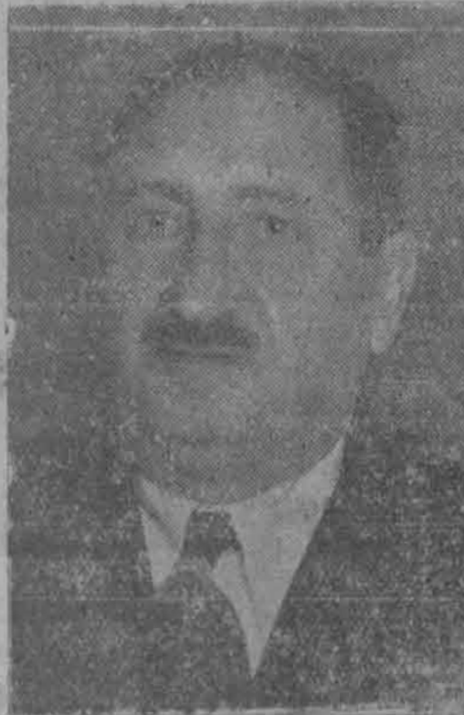
Ὁ κ. Κ. Σαλονικιός

Ἀγαπητοὶ μου συμπατριῶται, Ὑπακούων εἰς τὰς συγκινητικὰς ἐκκλήσεις πολλῶν ἐπιλέκτων μελῶν τῆς ἰδιαίτερας μου πατρίδος, καθὼς και τῶν βασιλοφρόνων ὀργανώσεων μετὰ τῶν ὁποίων στενῶς συνεργάζομαι, και διὰ τοὺς ἰδανικοὺς και πατριωτι-