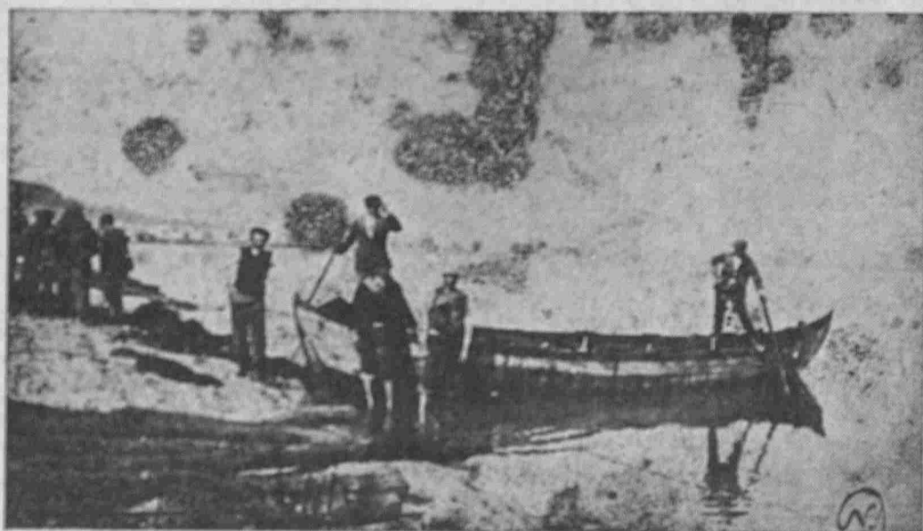
Παλατιανοὶ ψαράδες στὴ γραφικὴ ἀκρογιαλιά τῶν Νέων Παλατιῶν