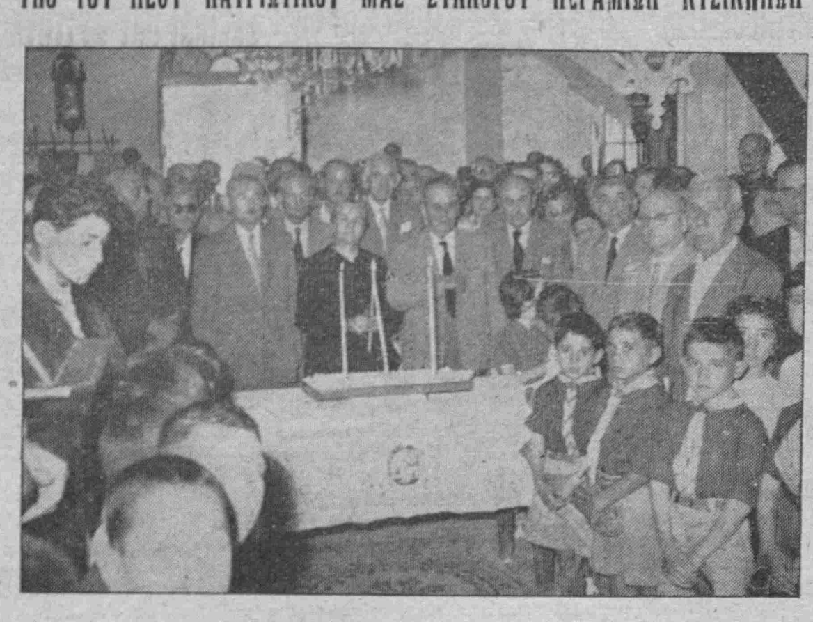
Ἀπὸ τὸ μνημόσυνον ποὺ ἐτέλεσεν ὁ Σύλλογος Περαιῶν Κυζικηνῶν τὸν παρελθόντα Μάιον εἰς Νέαν Πέραμον Μεγαρίδος εἰς ἀνάμνησιν τῆς γενετήρας Περάμου τῆς Κυζίκου. Εἰς τὴν φωτογραφίαν τὸ Δ. Συμβούλιον τοῦ Συλλόγου, οἱ κοινοτάρχαι καὶ λοιποὶ προσκεκλημένοι μέσα εἰς τὸν Ναὸν τοῦ Ἁγίου Γεωργίου, ὅπου ἔχει μεταφερθῆ τὸ παλαιὸν εἰκόνισμα τοῦ Ἁγίου ἀπὸ τὴν φερώνυμον παλαιὰν ἐκκλησίαν τοῦ Ἁγ. Γεωργίου Κάστρου.