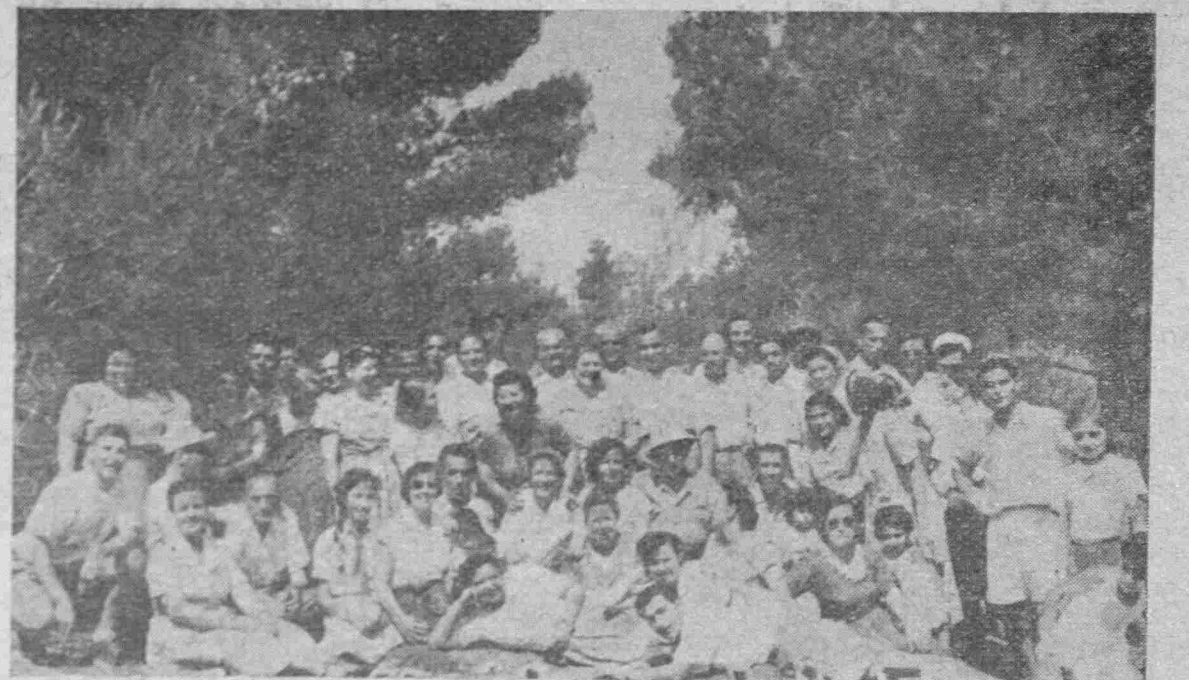
Ένα στιγμιότυπον από τίς πάληές χαρούμενες έκδρομές τού Προκοννησιακού Συνδέσμου