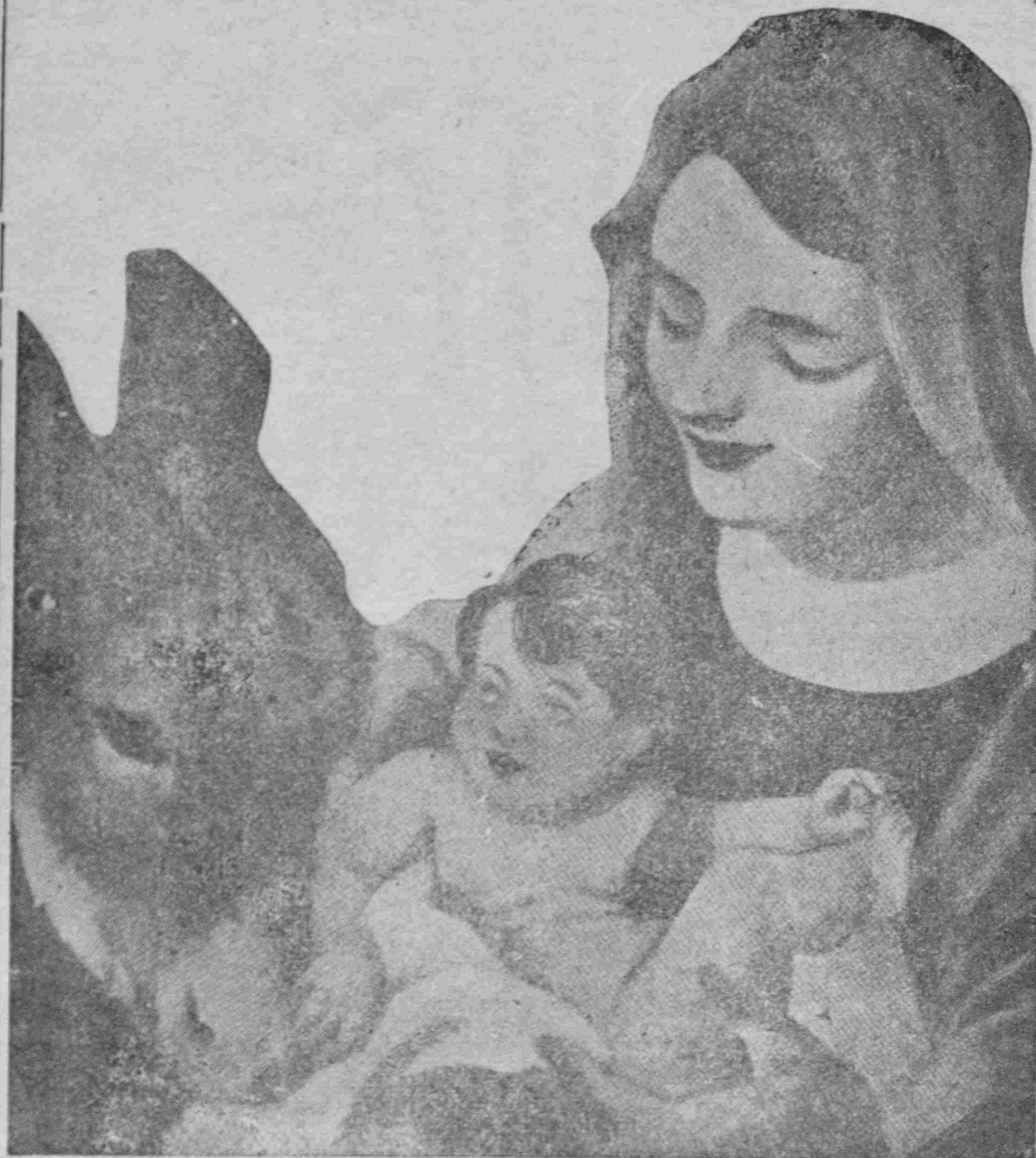
Ἡ Παρθένος σήμερον τὸν Ὑπερούσιον τίκτει.....

Ε ΑΝ μένετε εὐχαριστήμενοι ἀπὸ τὰ «Μαρμαρινὰ Νέα» συστήσατέ τα στοὺς φίλους καὶ γνωστοὺς σας συμπατριώτας.