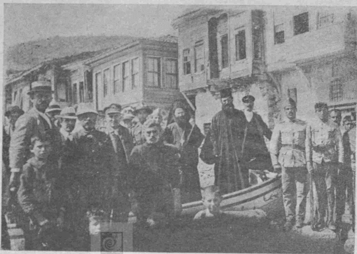
Ὁ ἀείμνητος Μητροπολίτης Δράμας Γεώργιος ὡς Πατριάρχικος Ἐξάρχος τῆς Ἱερᾶς Μητροπόλεως Προικοννήσου, κατὰ τὸν Σεπτέμβριον τοῦ 1920, ἐπισκεπτόμενος τὰ χωρία τῆς ἐπαρχίας του. Ἀνωτέρω εἰς τὸ χωρίον Ἀφθόνει τοῦ Μαρμαρά, φωτογραφούμενος μετὰ τοῦ Ιερέως τοῦ χωρίου ἀειμνήστου Παπαπαναγιώτου Καρατζᾶ, ὁμάδος Ἑλλήνων στρατιωτῶν καὶ κατοίκων τῆς Ἀφθόνης.

Κοσμάς 1821—1830, ἐπὶ τούτου ἔλαβον σὺστασιν τὸ πρῶτον τὸ σχολεῖα τῶν ὁμογενῶν Κοινοτήτων τῆς Ἐπαρχίας, Σαμουὴλ 1830—1835, Βησσαρίων 1835—1841, Γεδεών 1841—1853, Σωφρόνιος 1853—1861, Γεδεών 1861—1877 ποιμένας διὰ δευτέραν φοράν τὴν ἐπαρχίαν μέχρι τοῦ θανάτου του, Διονύσιος 1877 παυθεὶς τῇ 12ῃ Μαρτίου 1885 συνεπέα κατηγοριῶν τῶν Προικοννησίων, Νικόδημος 1885—1892, Ἰγνάτιος ὁ ἐκ νήσου Ἀλώνης 1892—1893, Βενέδικτος ὁ ἐκ Μουδανίων 1893. Εἰς διαδοχὴν τοῦ Βενεδίκτου ἐκλήθη ὁ ἐκ Μηχανιάνας τῆς Κυζίκου Παρθένιος . Οὗτος θεασά-