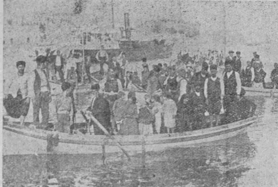
... Ούτω τήν έσπέραν τής 7ης Ιουνίου 1915, προτού άκόμη δίσση ο ήλιος, τό πρώτον φορτίον των προσφύγων του Μαρμαρά, έπεβιάζετο του άτμοπλοίου και έγκατέλειπε τά πάτρια έδάφη.

Εις τούτον τον παγκόσμιον πόλεμον ή νήσος αυτή πολλά συνεισέφερε εις τάς θυσίας του με αίμα και περιουσίαν. Πολλοί έκ των κατοίκων της, οι όποιοι είχαν έπαναπατρισθή εις τήν έλευθέραν Ελλάδα, προσέτρεξαν άμέσως ως έθελονταί εις τόν Έλληνικόν και Γαλλικόν στρατόν και πολεμοϋν σήμερα με τούς συμμάχους. Άλλοι εϋρίσκονται εις τήν Γαλλιαν άπηχολημένοι με έργασίας σχε-