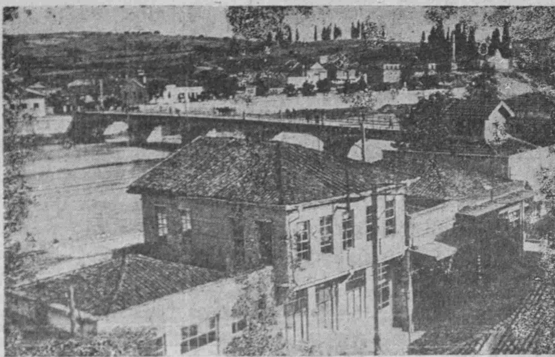
ΚΕΡΜΑΣΤΗ, ὁ τόπος τής πρώτης ἐξορίας μας

Ἐνα τμήμα τής σημερινῆς πόλεως με τήν γνωστήν μας γέφυραν, ἀλλά κατά πολὺ ἀλλοιωμένην ὡς πρὸς τήν κατασκευήν τής.