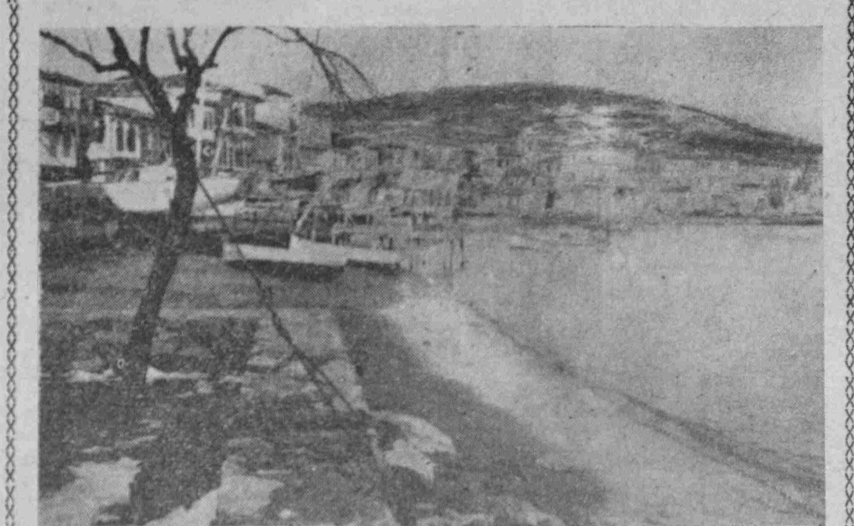
Γενάρης στήν Πατρίδα Ἡ Κούταλις χιονισμένη κατὰ τὴν πρὸ τοῦ ἐκπατρισμοῦ ἐποχῆν

ΠΑΛΗΣ ΦΩΤΟΓΡΑΦΙΕΣ ΠΟΥ ΦΕΡΝΟΥΝ ΣΤΟ ΝΟΥ ΜΑΣ ΓΛΥΚΕΣ ΑΝΑΜΝΗΣΕΙΣ