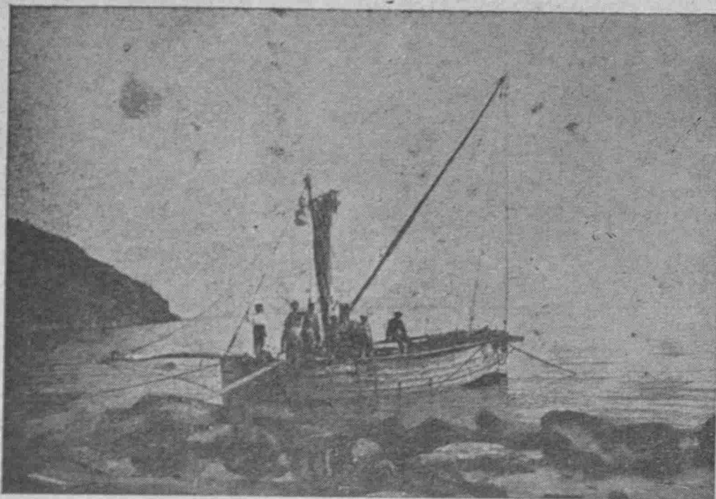
Στήν 'Αφθόνη τού Μαρμαρά

'Η «πόστα» τού Κώστα πού έκτελοϋσε συγκοινωνία 'Αφθόνη - Κωνσταντινούπολι