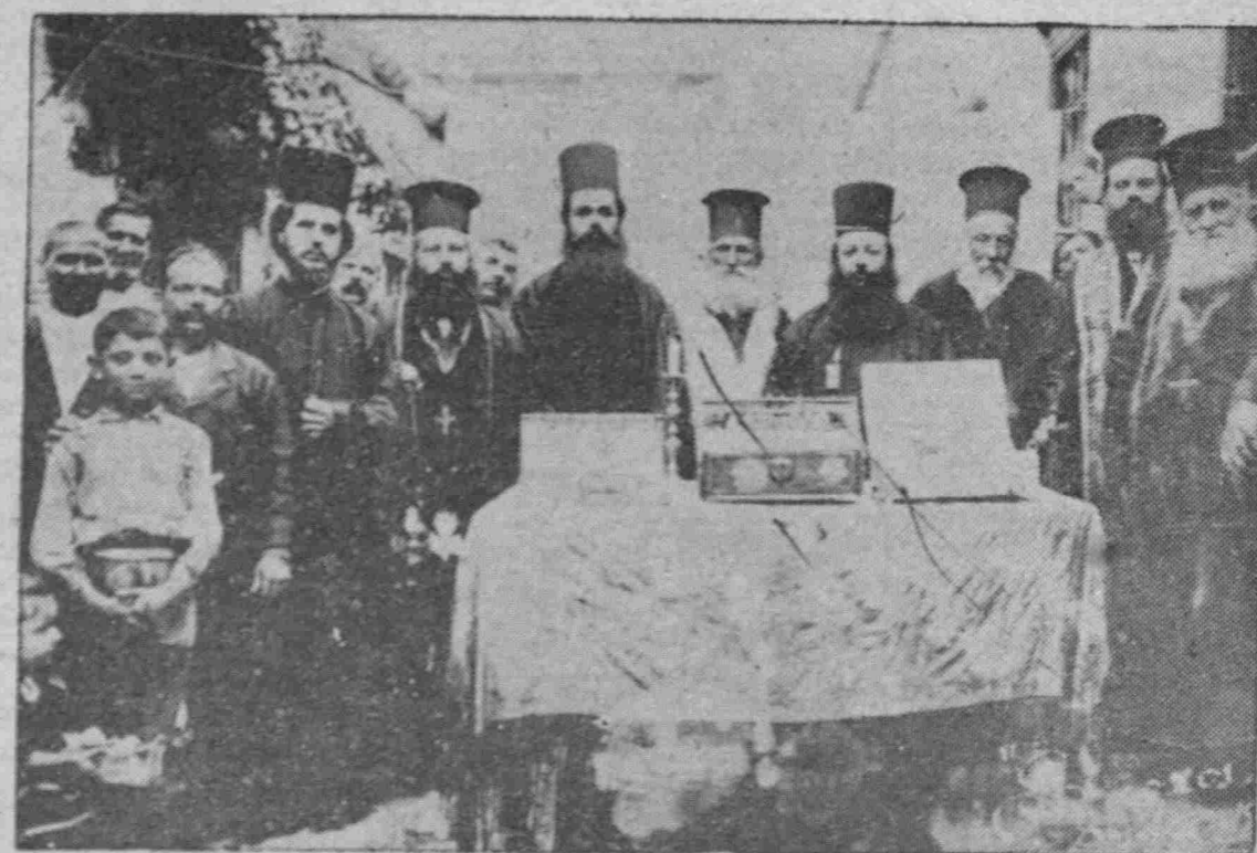
Ἡ Ἁγία Ζώνη στὸ Πραστεῖδ τοῦ Μαρμαρᾶ

ΠΑΛΛΗΣ ΦΩΤΟΓΡΑΦΙΕΣ ΠΟΥ ΦΕΡΝΟΥΝ ΣΤΟ ΝΟΥ ΜΑΣ ΓΛΥΚΕΣ ΑΝΑΜΝΗΣΕΙΣ