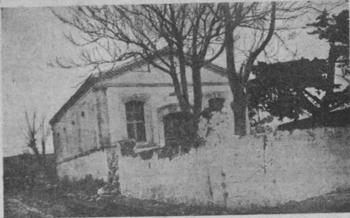
ΠΑΣΑΛΙΜΑΝΙ (Μαρμαρά) : Τὸ Ἄρρεναγωγεῖον

ΠΑΛΗΣ ΦΩΤΟΓΡΑΦΙΕΣ ΠΟΥ ΦΕΡΝΟΥΝ ΣΤΟ ΝΟΥ ΜΑΣ ΓΛΥΚΕΣ ΑΝΑΜΝΗΣΕΙΣ