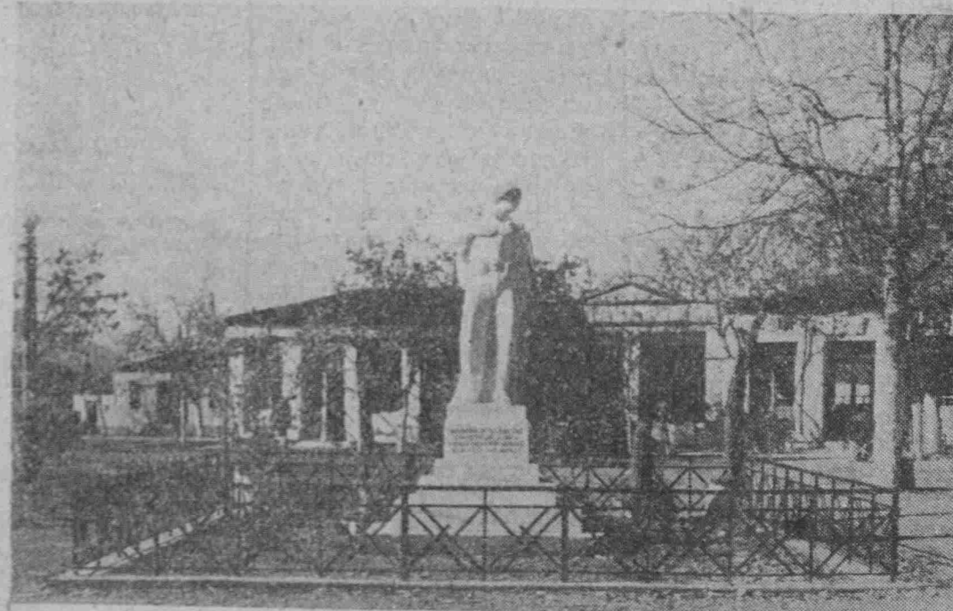
"Η κεντρική πλατεία Νέας 'Αρτάκης με τό 'Ηρώον πεσόντων.

Στό μέσον της κομο-πόλεως και ολιγον προς τό ανατολικόν μέρος, ύ-ψώνεται μεγαλοπρεπής ο καθεδρικός Ναός τών 'Αγίων 'Αποστόλων, πού κτίσθηκε λίγα χρόνια μετά τήν έγκατάστασι- των 'Αρτακηνών στη ση-μερινή τους Πατρίδα και άποτελει μια ένορία με δυό Ιερείς. Στόν Ιε-ρόν τουτον Ναόν τελούν-ται πάντοτε αι θείαι λει-τουργίαι και έορταί κα-τά τό Βυζαντινόν, με τά παλαιά εκείνα ώραία έ-θιμα πού προξενούν κα-τάνυξι και βαθύ θρη-σκευτικό σεβασμό και μεταρσιώνουν τόν νοϋν του ανθρώπου στον 'Υ-ψιστο. Οι κάτοικοι γε-μάτο εύσέβεια και πίστη κατακλύζουν πάντοτε τόν Ναό, για ν' ακού-σουν τά ώραία τροπά-ρια και να ξαναζήσουν τά άθάνατα και άξέχα-στα βυζαντινά έθιμα, ό-πως τά διατηρούσαν και τά ζούσαν στην παλαιά Πατρίδα των. "Οσοι ξε-