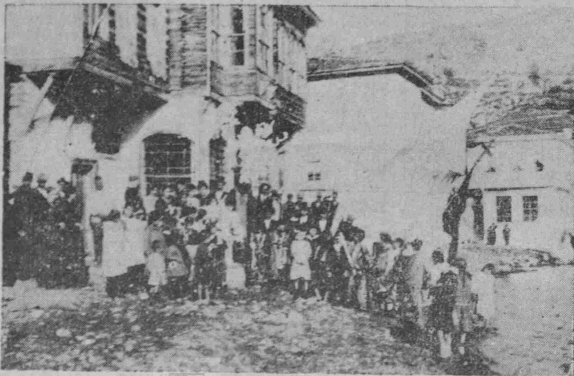
Στὴν Ἀσθὸν τοῦ Μαρμαρᾶ τὸ 1919

ΠΑΛΗΣ ΦΩΤΟΓΡΑΦΙΕΣ ΠΟΥ ΦΕΡΝΟΥΝ ΣΤΟ ΝΟΥ ΜΑΣ ΓΛΥΚΕΣ ΑΝΑΜΝΗΣΕΙΣ