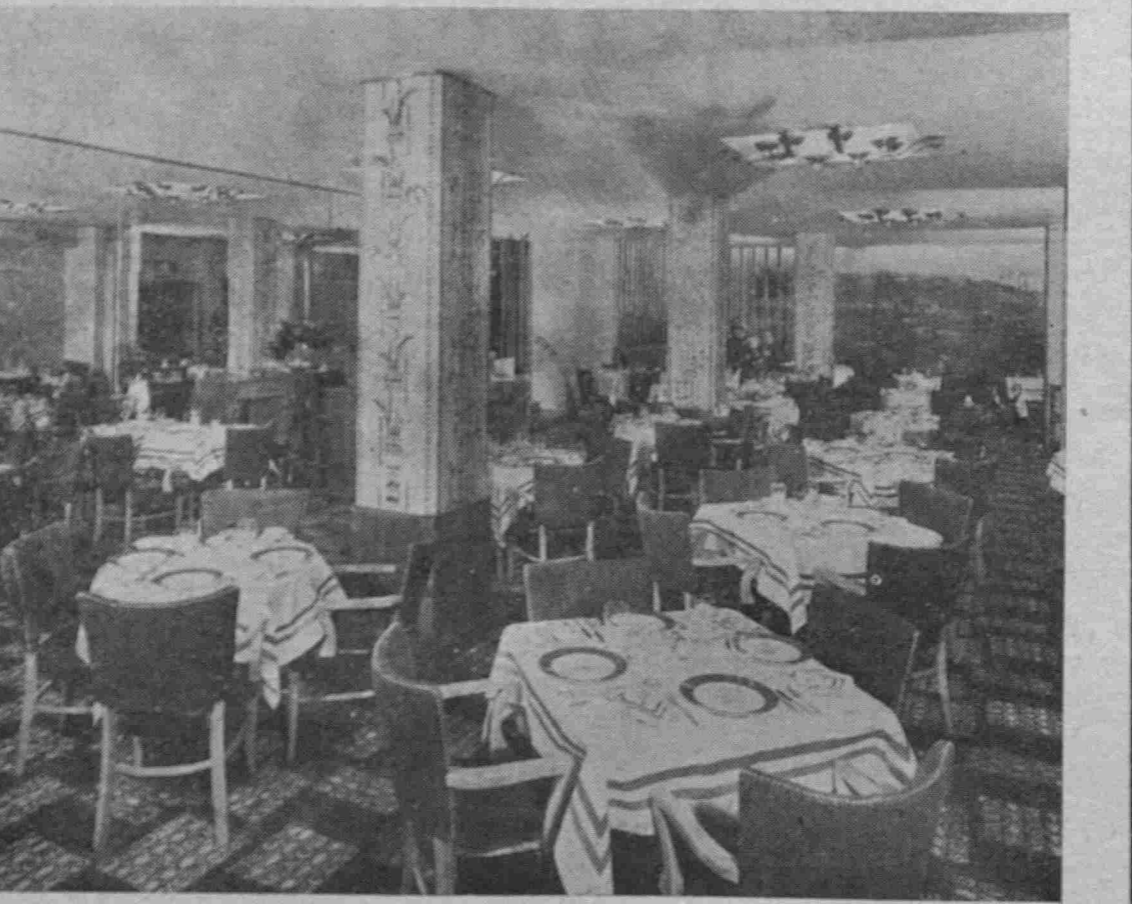
Ἐν τῶν διαμερισμάτων τῆς αἰθούσης «Ρομπλεμάιερς» τοῦ «Σαιντ Μοριτζ»

Μ ε πρόγραμμα συνεχούς ἀνακαινίσσεως καὶ ἀλλαγῆς ἐπιπέδων, ἢ Διευθύνσις τοῦ Σαιν Μόριτζ προσεπάθησε πάντοτε ὅπως παρέχῃ εἰς τοὺς ταξιδιώτας τὰς καλλιτέρας εὐκολίας καὶ ἀναπαύσεις. Τὸ κατὰ πόσον ἐπετύχαμεν φαίνεται ἀπὸ τὰς χιλιάδας τῶν διακεκριμένων Ἑλλήνων καὶ ἄλλων Εὐρωπαίων, πού κάμνουν τὸ Σαιν Μόριτζ σπιτί των, ὁσάκις ἐπισκέπτονται τὴν Νέαν Ὑόρκην. Τὰ Ἑστιατόρια Ρομπλεμάιερς καὶ Καφέ ντὲ λά Παί φημίζονται διὰ τὴν Ἀνατολίτικην καὶ Εὐρωπαϊκὴν κουζίνα των.