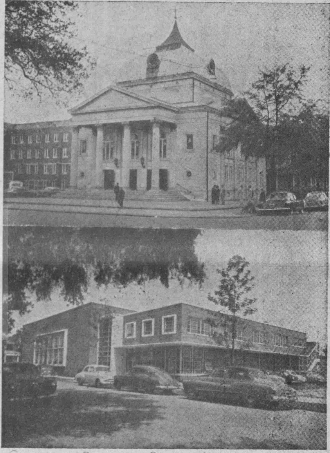
Ο μεγαλοπρεπής Ναός του 'Αγίου Παύλου και τó θαυμάσιον Κοινοτικόν Κέντρον της 'Ορθόδοξου 'Ελληνικής Κοινότητος Σαβάννας

κροί. Πλούσιοι και φτωχοί. Εύποροι και βιοπαλαισται, ό κάθε άνδρας, ή κάθε γυναίκα και τó κάθε παιδί της κοινότη- Στο πρώτον μέρος και στο κάτω πάτωμα, άριστέρα, εύρίσκεται ή κυρίως εισοδος, χώρος κυκλοφορίας, ή σκάλα του ηθητικούς χώρους. Τό κτίριον είναι φιαγμένο από μπετόν άρμε και τούβλα, ή όλη δέ κατασκευή του έστοίχισε