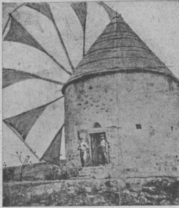
Ο ανεμόμυλος του Μανωλίδη στο Πασαλιμάνι πρό του έκπατρισμού.

Αράξουμε μπροστά στο Χότζα τη βρύση, μεταξύ Αγίου Νικολάου και τζαμιού. Η εκκλησία είναι κατεδαφισμένη και όλο το Πασαλιμάνι έρειπιον. Το νεκροταφείο του Πασαλιμανίου και η εκκλησία του Αγίου Ιωάννου έχουν μεταβληθί σε χωράφια φυτευμένα καλαμπόκι. Μπροστά στην τραγική αυτή κατάσταση τα μάτια μας γέ-