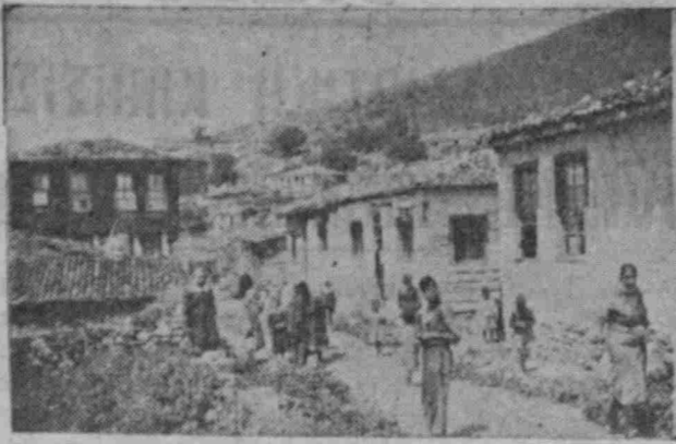
Μία εἰκόνα ἀπὸ τὴν σημερινὴ ὄψιν τοῦ ἐπάνω μαγαζιῶ τοῦ Μαρμαρᾶ