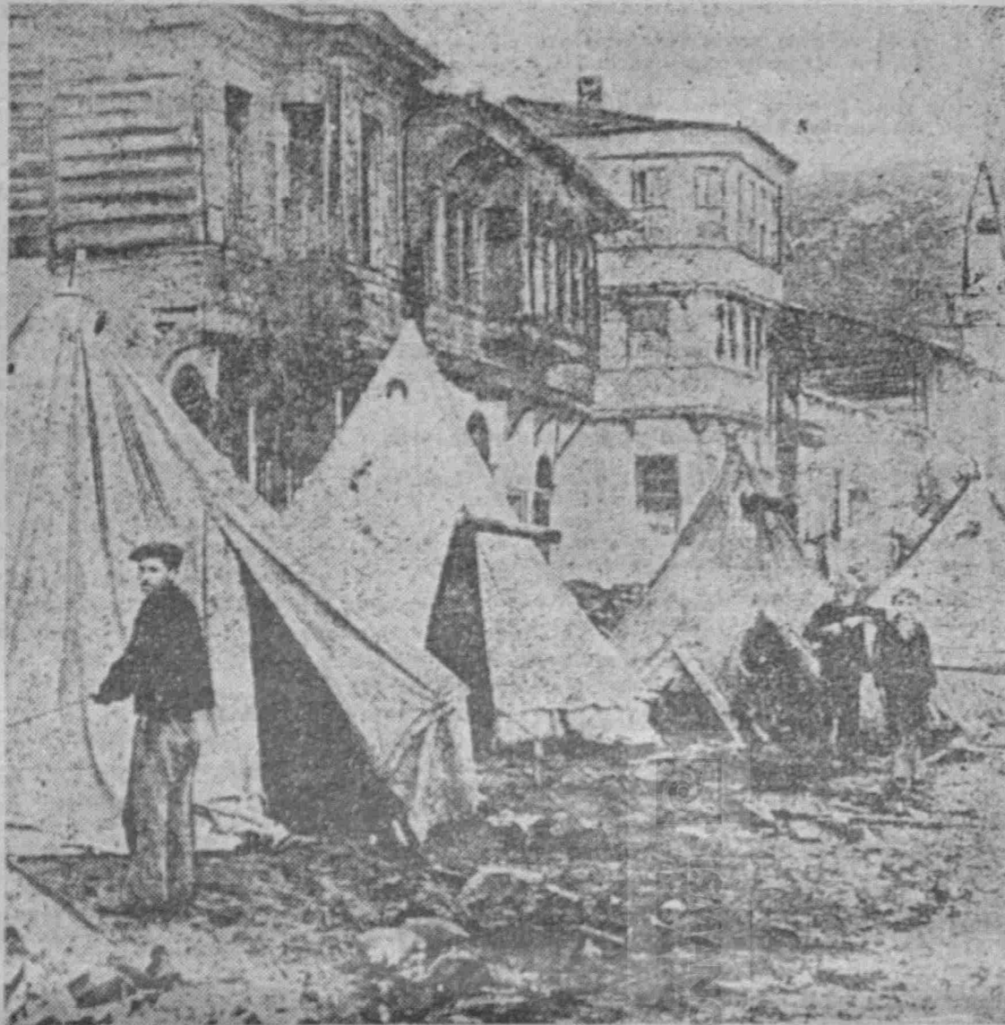
ΜΙΑ ΕΙΚΟΝΑ ΑΠΟ ΤΟΥΣ ΚΑΤΑΣΤΡΕΠΤΙΚΟΥΣ ΣΕΙΣΜΟΥΣ ΠΟΥ ΕΠΑΨΑΝ ΤΑ ΝΗΣΙΑ ΤΟΥ ΜΑΡΜΑΡΑ ΤΟΝ ΙΑΝΟΥΑΡΙΟ ΤΟΥ 1935

Από τους σεισμούς της Τουρκίας, που είχαν τόν επίκεντρόν των στο Τσανάκ Καλέ και την θάλασσαν του Μαρμαρά έπληγησαν επίσης ή Έλληνοκατοικημένη Ίμβρος και οι Έλληνικές έπαρχίες Σαμοθράκης, Λήμνου και Μυτιλήνης, με μεγαλύτερες ζημιές στην κωμόπολι Καλλονής, δ-