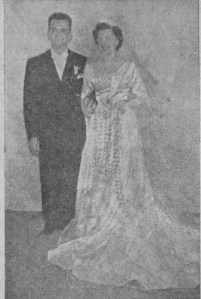
ΕΚΛΕΚΤΟΙ ΓΑΜΟΙ ΣΤΟΝ ΑΓΙΟ ΦΡΑΓΚΙΣΚΟ