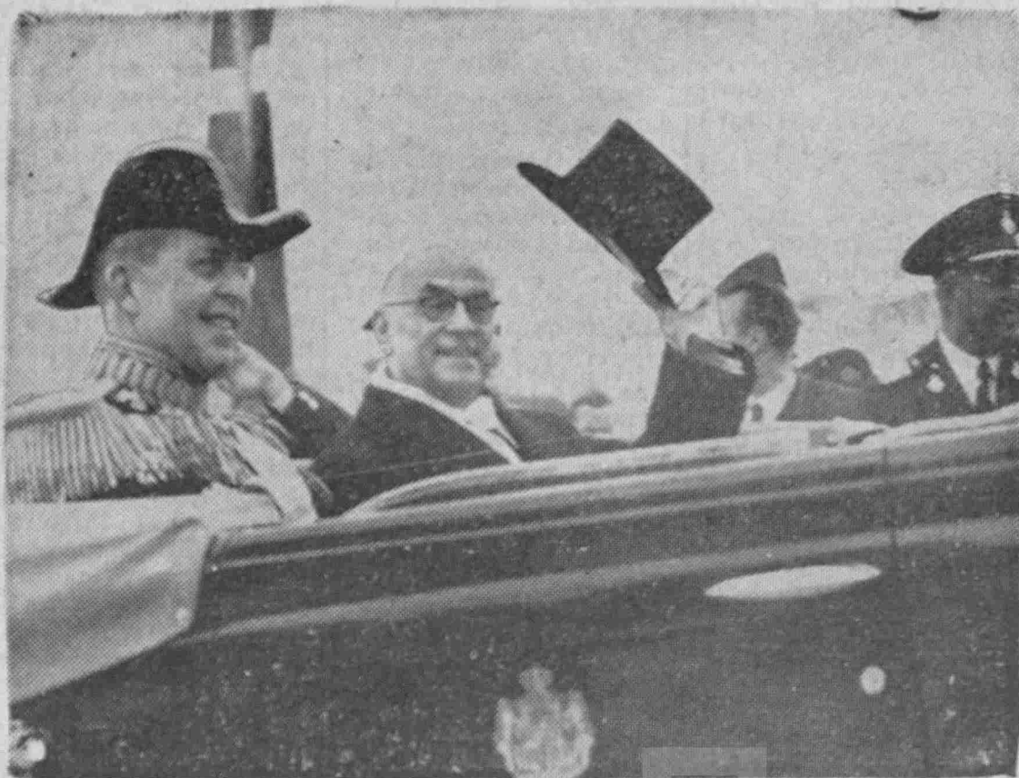
Ο Πρόεδρος της Τουρκικής Δημοκρατίας και ο Βασιλεύς επιβαίνοντες του βασιλικού αυτοκινήτου κατευθύνονται, μετά την αποβίβασιν του κ. Τζελάλ Μπαγιάρ, από τον λιμένα της Ζέας (Πειραιώς) στάς Αθήνας.

Πρόκειται περί του διακαούς πόθου των Προικονησι