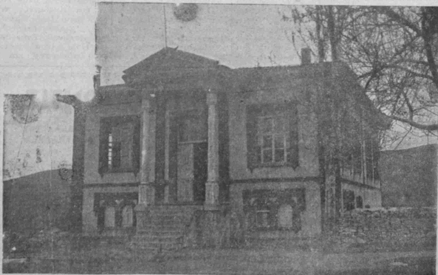
Τὸ ὠραῖο σχολεῖο τῆς Ἄφυσιάς, πὸ σώζεται καὶ σήμερον ὅπως τὸ ἀφήσαμε τὸ 1922