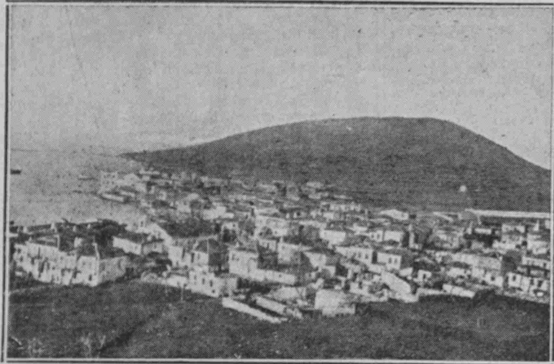
Ἡ Κούταλι ὅπως τὴν ἀφίσαμε τὸ 1922

ΔΗΜΟΣΙΟΓΡΑΦΙΚΟ ΟΡΓΑΝΟ ΤΩΝ ΣΥΜΦΕΡΟΝΤΩΝ ΤΩΝ ΑΠΑΝΤΑΧΟΥ ΔΙΑΒΙΟΥΝΤΩΝ ΜΑΡΜΑΡΙΝΩΝ - ΗΜΙΕΠΙΣΗΜΟ ΔΗΜΟΣ. ΟΡΓΑΝΟ ΤΟΥ ΠΡΟΙΚΟΝΗΧΗΣΙΑΚΟΥ ΣΥΝΔΕΣΜΟΥ