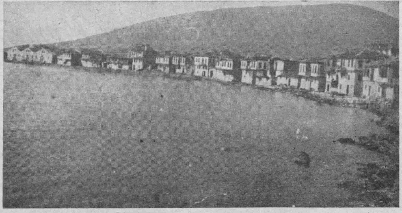
Το « από 'κει κάτ' » τμήμα τής Κούταλης κατά τήν πρό του έκπατριισμού έποχή

έγκαταλείπων δε νεαρών αύχλων και όκτω άνήλικα τέκνα ΓΑΙΩΝ ΕΧΕΤΩ ΕΛΑΦΡΑΝ Συνεχίζουμε τόν περιπατό μας άνάμεσα στα τραγικά χαλάσματα τής Κούταλης και φθάνουμε στην Παναγία Φανερωμένη, που είναι κι' αυτή σωριασμένη σ' ένα άμορφο δγκο από πέτρες και χώματα. "Από τήν δμορφή εκκλησιά δέν σώζονται παρά μόνο μερικά κομμάτια από τούς τοίχους της και ένα