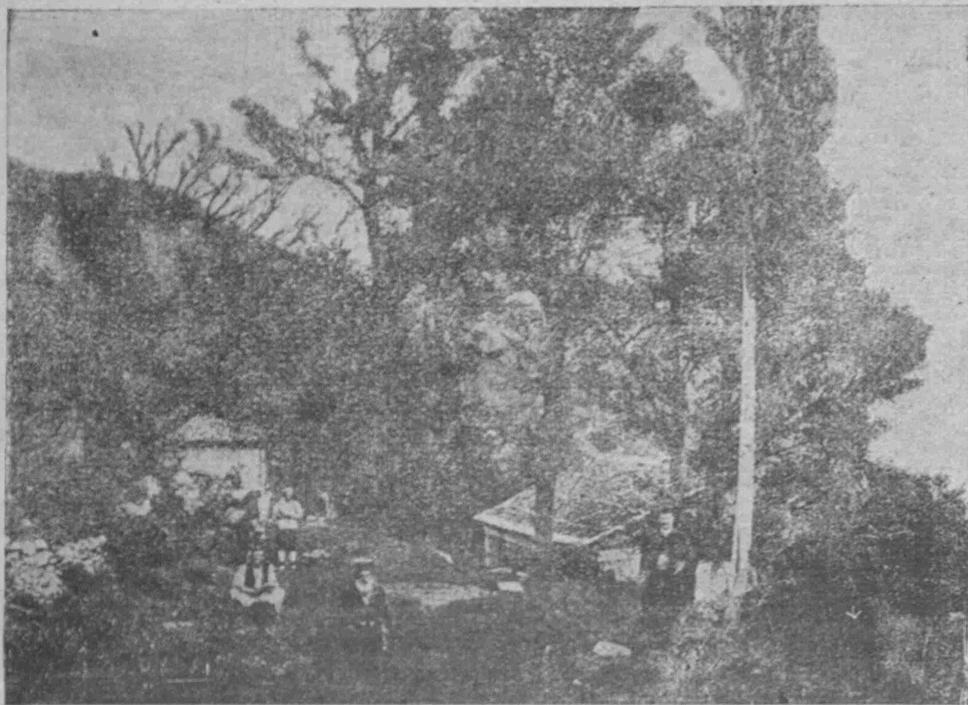
Ο Άγιος Τιμόθεος όπως τον αφήσαμε το 1922...

ΔΗΜΟΣΙΟΓΡΑΦΙΚΟ ΟΡΓΑΝΟ ΤΩΝ ΣΥΜΦΕΡΟΝΤΩΝ ΤΩΝ ΑΠΑΝΤΑΧΟΥ ΔΙΑΒΙΟΥΝΤΩΝ ΜΑΡΜΑΡΙΝΩΝ - ΗΜΙΕΠΙΣΗΜΟ ΔΗΜΟΣ - ΟΡΓΑΝΟ ΤΟΥ ΠΡΟΙΚΟΝΗΗΣΙΑΚΟΥ ΣΥΝΔΕΣΜΟΥ