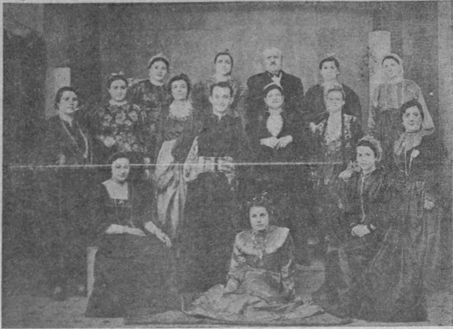
— Ἀπὸ τὴν προπολεμικὴν δρᾶσιν τοῦ Πατριωτικοῦ μας Σωματείου —

Στὴν αἴθουσα τοῦ Βιοτεχνικοῦ Ἐπιμελητηρίου Πειραιῶς ἔγινε στίς 16 Ἀπριλίου ἡ προαγγελθεῖσα Γενικὴ Συνέλευσις τῶν μελῶν τοῦ Προικονησιακοῦ Συνδέσμου Πειραιῶς γιὰ τὴν ἀνάδειξιν νέου Διοικητικοῦ Συμβουλίου τῆς νέας σωματειακῆς περιόδου. Ὁ ἀριθμὸς τῶν παρευρεθέντων συμπatriωτῶν ἐν συγκρίσει μετὰ τὴν προσκλήσεις ποὺ ἐστάλησαν (350 τὸν ἀριθμὸν) δὲν ἦτο ἐκεῖνος ποὺ ἔπρεπε νὰ εἶναι καὶ τοῦτο ἀπεγοητεύσε πολλὸ τὸ Διοικητικὸν Συμβούλιον, ποὺ καταβάλλει τόσες φιλότιμες προσπάθειες γιὰ τὴν πρόδοσιν τοῦ Συνδέσμου. Ἀπὸ τῆς Γενικῆς Συνελεύσεως τοῦ πατριωτικοῦ μας Σωματείου δὲν δικαιολογεῖται καμμιά ἀπουσία ἀνθέλουμι νὰ διατηρηθῇ καὶ νὰ πάη μπροστὰ ἢ ἀδελφότητά μας. Κανένας πατριώτης δὲν πρέπει νὰ ἀδιαφορῇ στίς προσκλήσεις τοῦ Συνδέσμου, μὴ προβάλλοντας λόγους ἐργασίας (τὴν Κυριακή), ἢ ἄλλης αἰτίας. Τὸ Σωματεῖο μας εἶναι ἡ Πατρίδα μας ἐδῶ, καὶ στὴν φωνὴν τοῦ, στήν φωνὴν τῆς Πατρίδας, δὲν χωρεῖ καμμιά δικαιολογία ὀλιγωρίας.