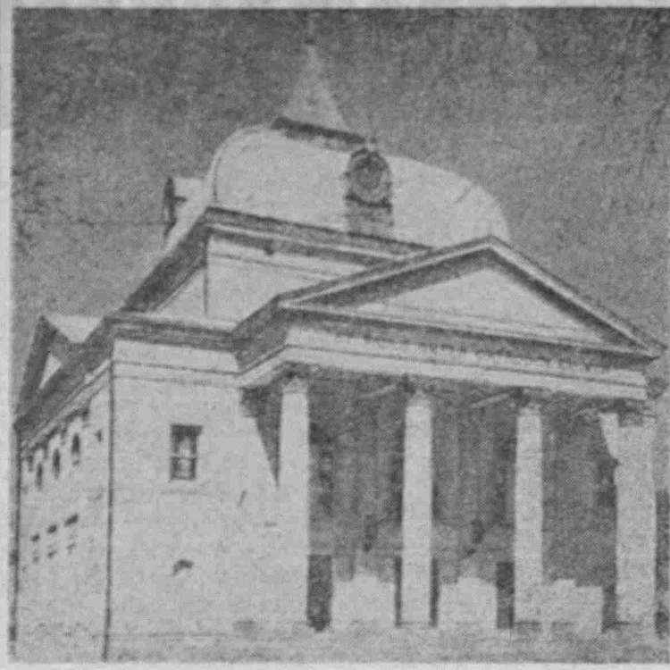
Ο Μεγαλοπρεπής Ναός του Άγιου Παύλου τής Έλλη- νικής Ορθόδοξου Κοινότητος Σαβάννας

Ευχάριστο γεγονός για τήν παροικία μας ύπηρ- ΣΥΝΕΧΕΙΑ στη 1η σελίδα