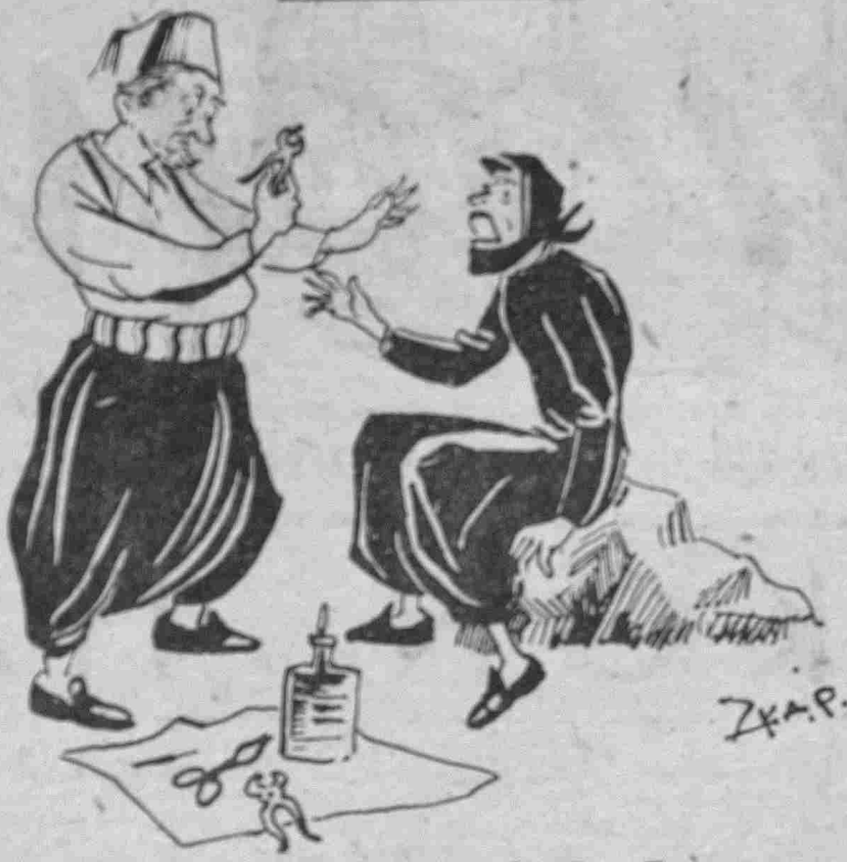
Ὁ Σινιὸρ ΣΑΜΑΡΙΑΣ θγάζει δόντια

Σκίτσον τοῦ συμπατριώτη σκίτσογράφου κ. ΒΑΣΙΛΕΙΟΥ ΣΚΑΡΛΑΤΟΥ