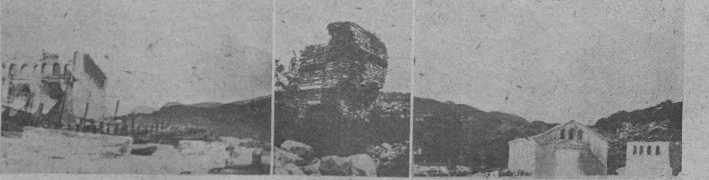
Η πρόσοψις του Ι. ναού της Παναγίας, στα Παλάτια, όπως είναι σήμερα γκρεμισμένη. Τα απομεινάρια του άρχαίου Πύργου (της τόποθεσίας Χώρα) στα Παλάτια, όπως είναι σήμερα. Το μέρος και ή προς την θάλασσα πλευρά του Ι. ναού της Παναγίας, στα Παλάτια, όπως είναι σήμερα.