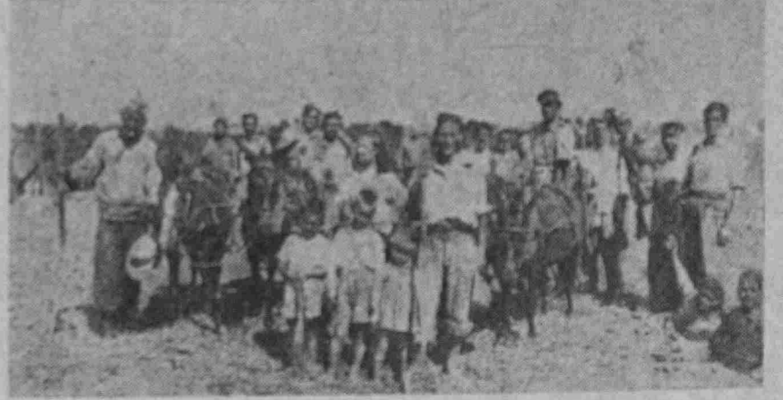
ΕΙΚΟΝΑ 1η : Όμιλος γεωργών Νέου Μαρμαρά κατά το άλώνισμα των αιτηρών. ΕΙΚΟΝΑ 2η : Οι μαθηταί του Δημοτικού Σχολείου 'Αμμουλιανής σε μιὰ συγκέντρωσή τους έξω από το χωριό τήν ημέρα των γυμναστικών επιδείξεων. ΕΙΚΟΝΑ 3η : Οικογένειες γεωργών του Νέου Μαρμαρά ποζάρουντας μπροστά στο φωτογραφικό φακό των «Μαρμαρινών Νέων».