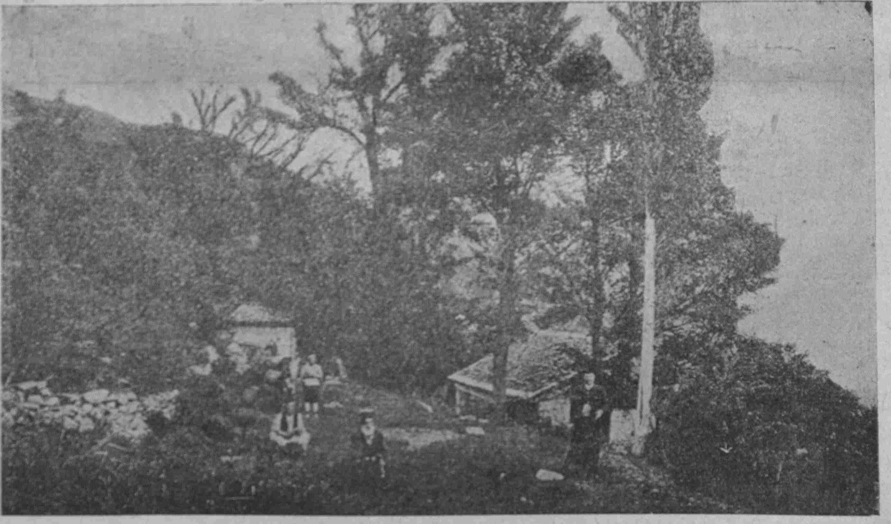
Τό γραφικό μοναστήρι του Άγιου Τιμοθέου στό Μαρμαρά

Μετά Εξ Ετη δυστυχή, μακρά όπέρ αιώνας, σ' έπαναβλέπω, ω Μονή, και έκθαμβος την έμμελή άκνού άηδόνα, ή τις της χείρα μου κινεί. «Όποία θείας ήμερας! Έδώ ο ρυαξ ρέει και οίον κελαρύζει εκεί γλυκός ο Ίερωτος επί των φύλλων πνέει κι' έν άσμα ψιθυρίζει. Έν μέσω δένδρων θαλαρών επί όροπεδίου ύφονται πάντατος Ναός, έβου κατ' έτος έλασβος είς μνήμην του Άγιου σωφρεί εσσεβής λαός. Πάσα ψυχή εβούθητος μακράν της κοινωνίας εδώ τούς πόρους λημονεί και μετά κατανοήσεως και άρας εύλαβείας τόν Παντοκράτορα ύμνει. (Κατά Μάιον 1879)