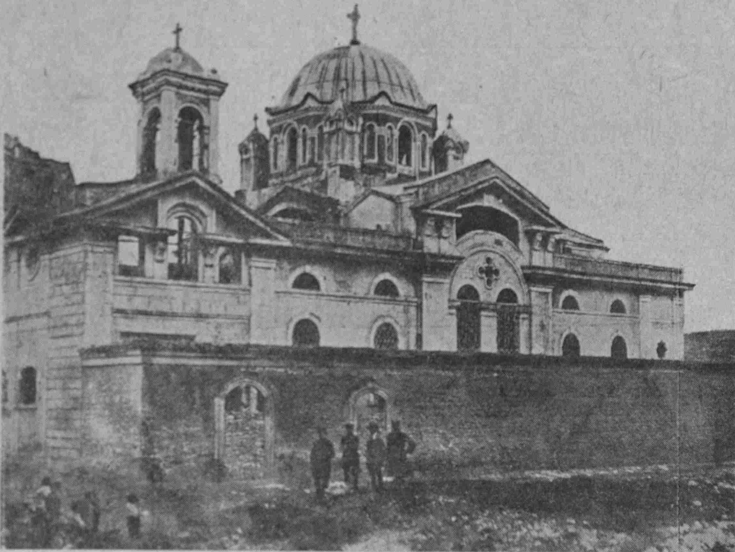
Ὁ περίφημος ναὸς τοῦ Ἁγίου Νικολάου τῆς Ἀρτάκης πού κατεστράφη στὴ μεγάλη φωτιά τῆς 14 Αὐγούστου τοῦ 1917