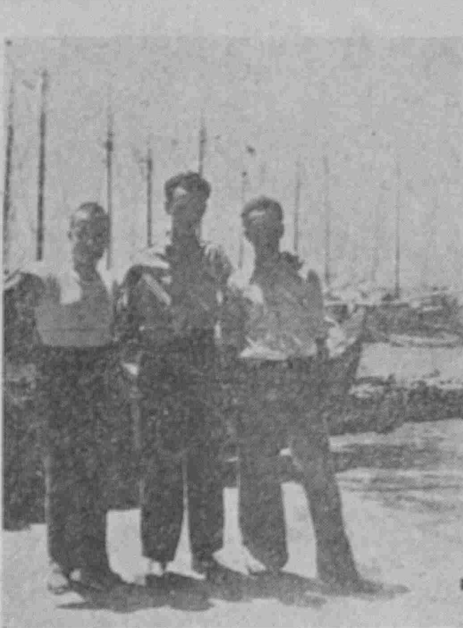
Στόν αγαπητό μας Μαρμαρά: Τρεις όμογενείς έμποροι, στην προκυμαία του Μαρμαρά, ποζάρουν μπροστά στό φωτογραφικό φανό των «Μαρμαρινών Νέων». Στο βάθος διακρίνονται «Ελληνικά και Τουρκικά βενζινόπλοια, που άκυροβολήματα κοντά ήτά σκάλα περιμένουν να φορτώσουν με τό φημισμένο προϊόν του νησιού μας τους μυρωδάτους Μαρμαρινούς κολλίους

15 λεπτά πριν τόν Μαρμαρά είμεθα τό πρωί στό χωριό Πρασός, έυμορφο ένα χωριουδάκι, γεμάτο πρασινάδες. Μετά ήλθαμε στό Μαρμαρά. Νά σας πώ όλη την άλήθεια, με άρεσε πάρα πολύ, παρ' όλον που είναι μικρό ένα χωριό τώρα, άλλοτε λέγονται πός ήτο άρκετά μεγάλο, αλλά τό περισσότερο σπίτια του, τά προς τά πλάγια του βουνού, δέν σώζονται πλέον. Τό λιμανάκι του, είναι πολύ έυμορφο, ή άκροθαλασσιά του άποτελείται και από μία έυμορφη άρκετά μεγάλη πλατεία σκεπασμένη από μεγάλους πλα-