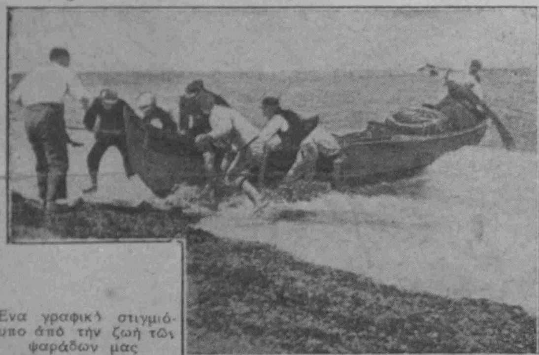
Ένα γραφικό στιγμιότυπο από την ζωή των ψαράδων μας