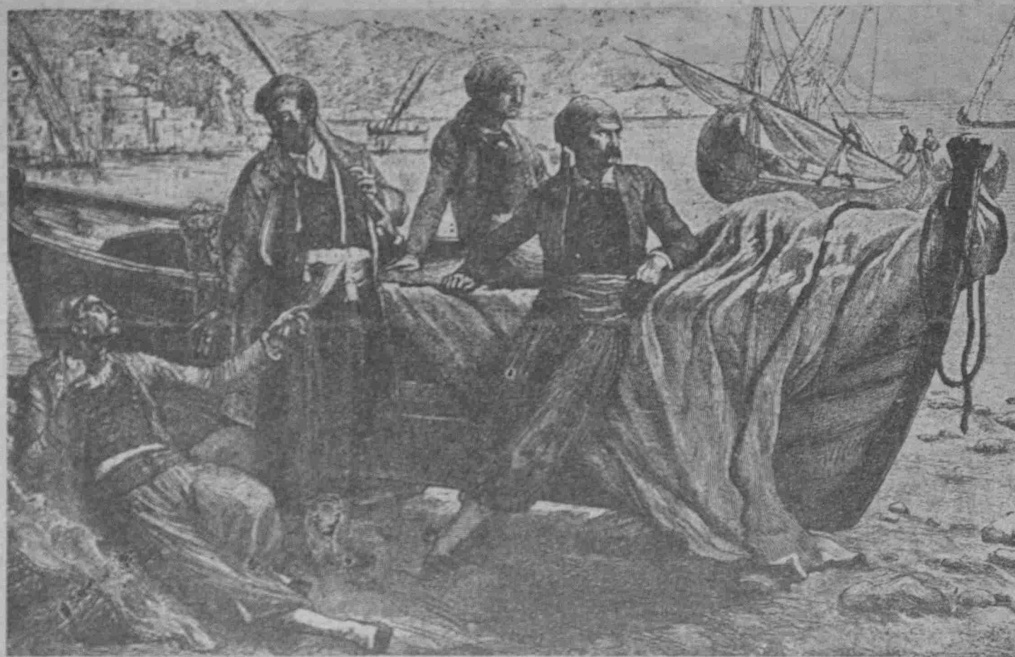
Νησιώτες Άγωνιστάι του 1821