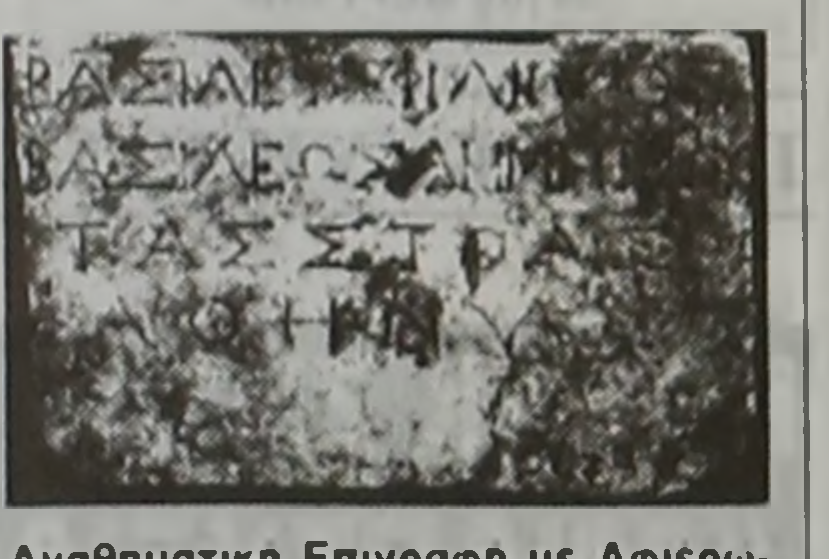
Αναθηματική Επιγραφή με Αφιερώ- ση Στόων από τον Φίλιππο Ε' στην Θεά Αθηνά. (Αρχαιολογικό Μουσείο Βερροίας, Αρ. Ευρ. Α -175). [Από το Βιβλίο της L. Brocas - Deflassieux “ΑΡΧΑΙΑ ΒΕΡΡΟΙΑ”. Εικ. 31, σελ. 74].

Η Βεροία ευτύχησε στα χρόνια της Βασιλείας του Φιλίππου Ε' να αποκτήσει μια σειρά από Μνημειώδη Οικοδομήματα! Απο Αναθηματική Επιγραφή που φύλασσεται στο Αρχαιολογικό Μουσείο της Πόλης μας, πληροφο- ρομαστε για την Α-ρίερωση Στόων από τον Βεροί-αίο Ανακτα Φίλιππο Ε', στο Ιερό της Θεας Αθηνάς! Οι Στοιές, αποτελούσαν χαρακτη- ριστικά στοιχεία των Ελληνιστικών Πολέων, και ο-ροβέτον με σαφή- νεια τους δημόσιους χώρους, προ- σδιδόντας τους την αναλογη κομψο- τήτα και παλεοδομική αρμονία! Σε ο,τι αφορά την Βεροία, οι Στοιές στις οποίες αναφερομαστε δεν έχουν εντοπισθεί ακόμη, γί- αυτό και είναι αδύνατο να εντοπι- σθεί και η θέση του Ιερού της Αθηνάς. Η Αναθηματική Επιγραφή που προσάφωραμε, έχει την ε-ξής Αφιερώση: “ΒΑΣΙΛΕΥΣ ΦΙΛΙΠΠΟΣ/ ΒΑΣΙΛΕΥΣ ΔΗΜΗ-ΤΡΙΟΥ/ ΤΑΣ ΣΤΟΑΣ ΑΘΗΝΑΙ”. Επίσης στην γενναιοδωρία του Βασιλέως Φιλίππου Ε', Γιου του Βασιλέως Δημητρίου Β', οφείλει η