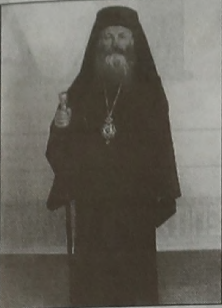
Το 1954 Εχειροτονήθης Πρεσβύτερος - Αρχιμανδρίτης Υπηρετήσεν ως Στρατιωτικός Ιερέυς εις Τρίκαλα, Κοζάνη, Βέρ- ροια, Θεσσαλονίκη, απ' όπου το 1968 εξελέγη Μητροπολίτης Βέρ- ροίας και Ναουσής. Στις 24-11-1968 Εχειροτονήθης Επισκοπός εις τον Ιερόν Ναόν Αγίου Δημητρίου Θεσσα- λονίκης. Στις 15-12-1968 Ενεθρονί- σθη εις Βέρροια.