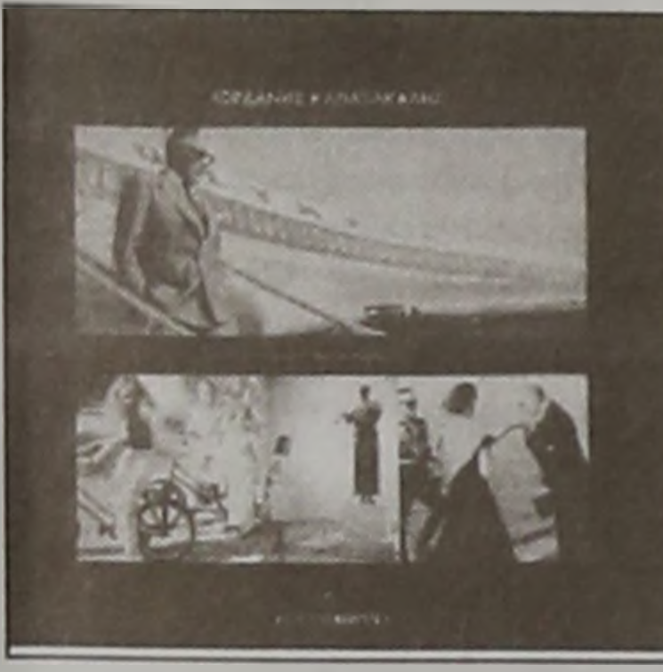
Σοφίας και Ειρήνης, των Βασιλέων Κωνσταντίνου και Άννας - Μαρίας και των Παιδιών τους, γνωστών Πολιτικών (Ελλήνων και Ξένων), των Οικογενειών Ήνσση, Νιάρχου και Βαρδινωγιάνη, καθώς και Προσωπικότητων, Δικών μας αλλά και του Διεθνούς Τζετ - Σετ!

Στο Λευκώμα, υπάρχουν Φωτογραφίες της τωής Βασιλικής Οικογενείας των Γλιξμπουργκ, των Βασιλέων Παύλου και Φρειδερίκης, των Πριγκιπων Κωνσταντίνου