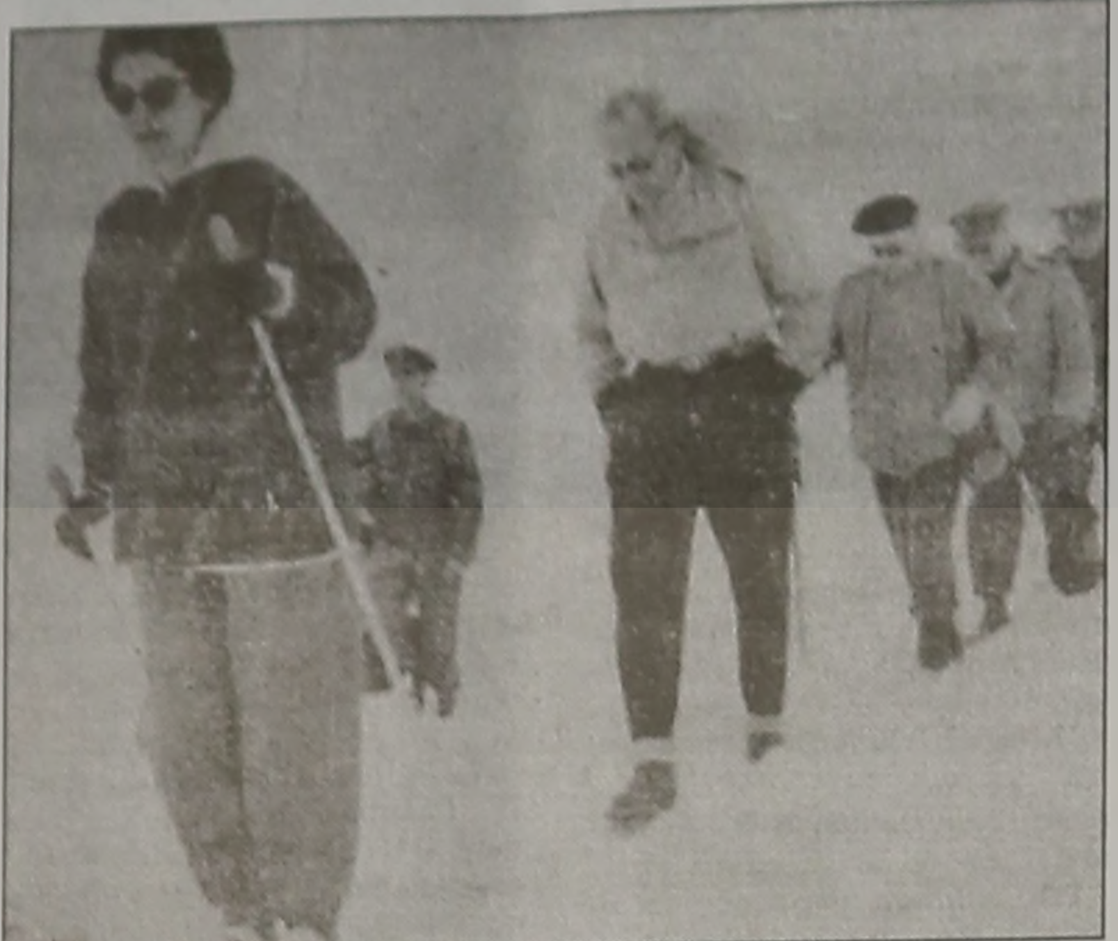
* 2η φωτο. Ασπρομαυρου χρωματος, απο Στρατιωτικο, προφανως, Εγχειριδιο, ανευ λεζαντας, Δειχνει την Βασιλισσα Φρειδερική, προπορευομενη με τα σκι, ακολουθουμενη υπο το Βασιλειωσ Παυλου, με ανεση και με το χερια στις τασεις, και την Ακολουθια τους.

τιών, παρακολουθήσαμε στη θέση Αρσμουπάσι, όπου σήμερα το χιονοδρομικό κέντρο, στρατιωτικούς αγώνες και εν συνεχεία αγώνες εφήδων, μεταξύ των οποίων και ο μαθητής τότε διαδοχος Κωνσταντίνος. Την επομένη 28 Φεβρουαρίου με