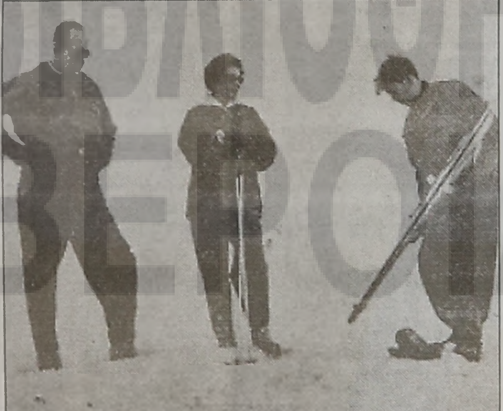
* 3η φωτο: Ασπρομαυρου χρωματος, απο Εφημεριδα της Εποχης, με την λεζαντα: "Οι Βασιλεις και ο Διαδοχος εις το χωριον Σελι του Βερμιοιου οπου παρακολουθουν τους Πανελληνιους αγώνες χιονοδρομιων" και χειρογραφη σημειωση με μπλε μελανι, η χρονολογια "1954". Δειχνει, το Βασιλικό Ζευγος Παυλου και Φρειδερικής, να παρακολουθουν τον νεαρο Πριγκιπα και Διαδοχο Κωνσταντινο, την ωρα που ετοιμαζεται να φορεσει τα σκι του.

Για την υλοποίηση της αποφασεως του Βασιληα, χρειαστηκαν κι άλλες πολλές ενεργειες, ταξίδια στην Αθήνα, κινητοποίηση Βουλευτων,