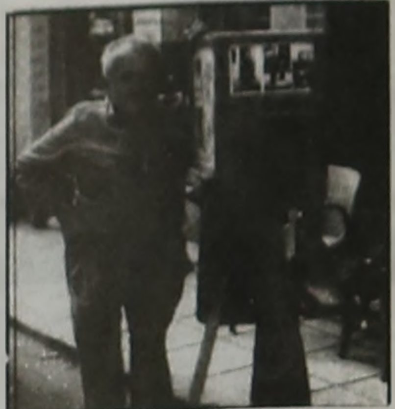
Εβγαλε. Ένα ασπρόμαυρο αριστούργημα! Για χρόνια, κάθε φορά που περνούσα από το στέκι του, τον κοιτούσα με ένα θαύμασμο, γιατί η δική του παλή απέναντι στην συγχρονη πλυμνήριδα της Τεχνης του, προσέδιδε στο ύψος του κατι το μεγαλειώδες! Ήταν ένας Γιγαντας. Εφυγε κι Αυτός, στα τέλη του περασμένου μηνά. Πέρασε με την σειρά του στο Πανθρον των Καθμερινών Ανθρώπων της Βερροϊών Πολιτείας. Άφησε με την Δουλεία του και το Πείσμα του το δικό του Αποτύπωμα στην Πολή Μας. Ομως σε κάποια γωνία της Μνήμης Μας Θα Ζει...