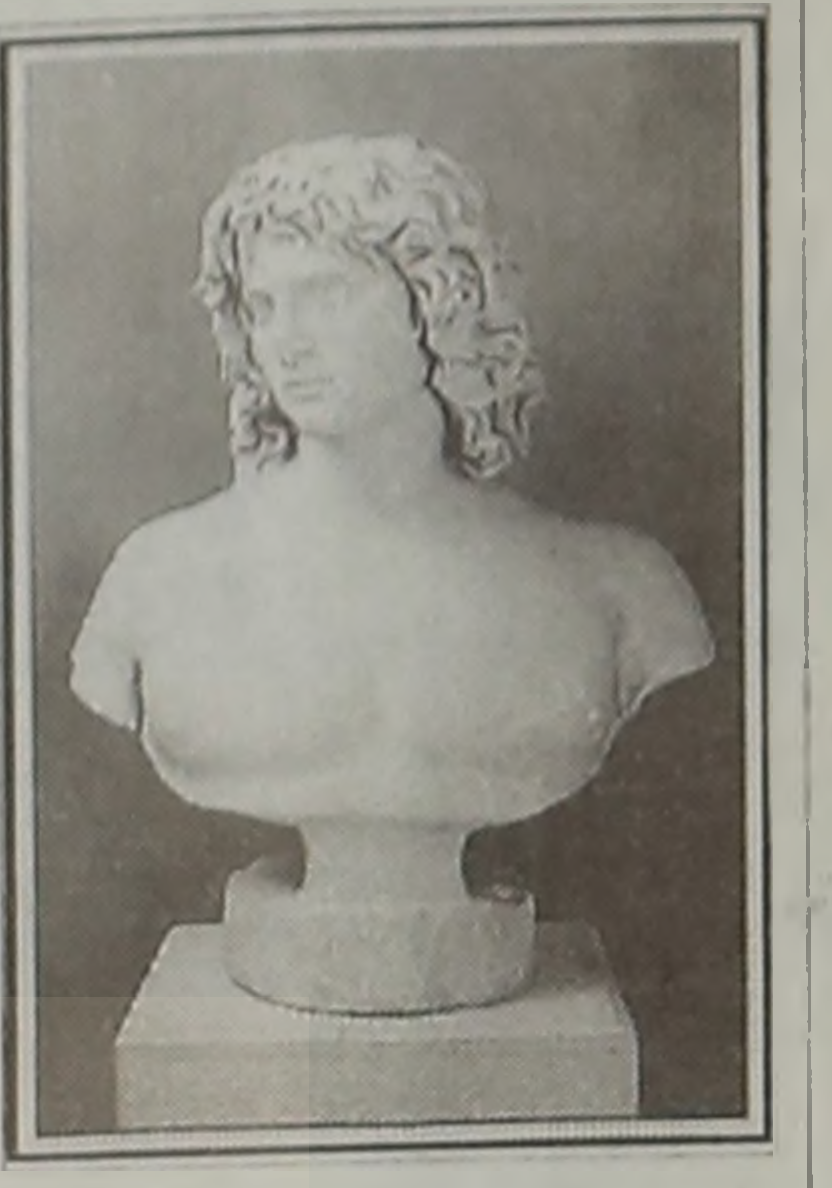
προτομή του 2ου αι. μ.Χ., η οποία φέρει την επιγραφή "ΟΛΓΑΝΟΣ" και παριστάνει Νεον εκπληκτικής ομορφιάς!

Περι της Αστρικης Καταγωγής των Ελλήνων, εγώ δεν θα λογομαχίσω, ούτε και θα αναμυχθώ σ' αυτήν την ιστορικό - φιλολογική διαμάχη.