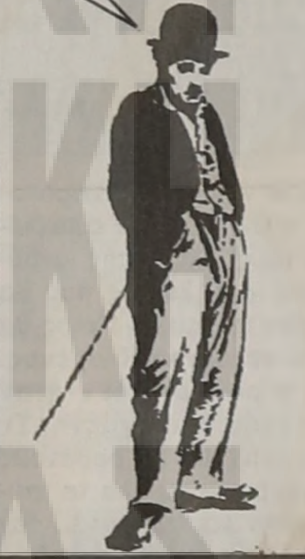
Σκίτσο: Χ.Ν.Κ. - Κείμενο: Δ.Ι.Κ.