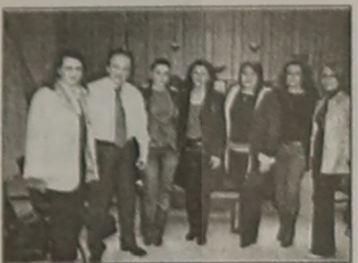
ΤΙΣ ΚΟΙΝ. ΛΕΙΤΟΥΡΓΟΥΣ

Ειδικότερα για το αίτημα στήριξης της Θεατρικής Ομάδας του Συλλόγου για παραστάση που οργανώνεται για τον Μάιο, ο Κος Καραπαναγιωτίδης συμφώνησε με την προσαρμογή και είπε ότι θα στήριχθεί από την Νομαρχιακή Αυτοδιοίκηση.