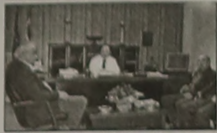
ΤΗΝ ΟΜΟΣΠΟΝΔΙΑ Α.Δ.Σ.

Τα Μέλη του Δ.Σ. του Συλλόγου Κοινωνικών Λειτουργιών Ημαθίας επισκέφθηκαν τον Νομάρχη Κο Κ. Καραπαναγιωτίδη την Τρίτη 20 Μαρτίου. Ενημέρωσαν τον Κο Νομάρχη για τις Δράσεις και Δραστηριότητες των Μελών και του Συλλόγου, ζήτησαν την Αρωγή της Νομαρχιακής Αυτοδιοίκησης στο Αίτημα για άνοιγμα Οργανικών Θέσεων του Κλάδου τους. Από την πλευρά του ο Κος Νομάρχης ενημέρωσε για τις πρόσφατες εξελίξεις αναφορικά με την σχεδιαζόμενη ίδρυση και λειτουργία στην Ημαθία Κέντρου Ψυχικής Υγείας, Κέντρου Απεξάρτησης, αλλά και στην προσπάθεια ίδρυσης Κέντρου Κακοποιημένων Γυναίκας και Παιδιού, για τα οποία ασφαλώς θα γίνουν προαληψείς Κοινωνικών Λειτουργιών. Απόλυτα θετικός ήταν ο Κος Καραπαναγιωτίδης και στο Αίτημα του Συλλόγου για συνδιοργάνωση με την Νομαρχιακή Αυτοδιοίκηση Εκπαιδευτικής Ημερίδας, αλλά και για την ένταξη τους στις δραστηριότητες της Ν.Α.