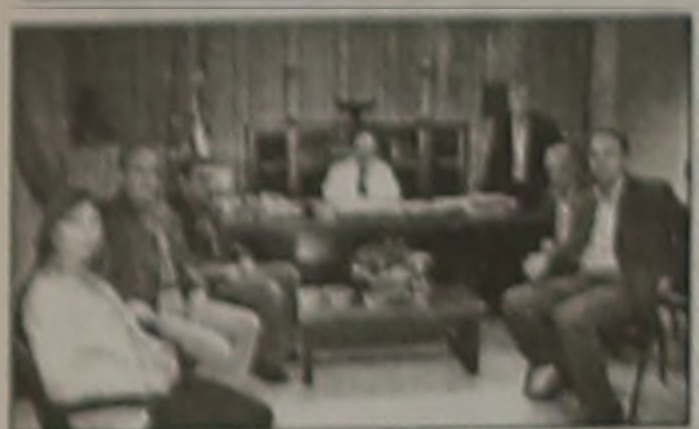
ΜΕ ΤΟΝ ΣΥΛΛΟΓΟ ΔΑΣΚΑΛΩΝ

Συνάντηση με το Δ.Σ. του Συλλόγου Δασκάλων Ημαθίας είχε την Τρίτη 20 Μαρτίου ο Νομάρχης Ημαθίας Κος Κώστας Καραπαναγιωτίδης.