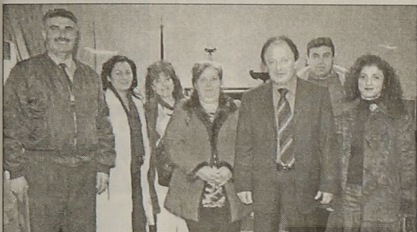
Ο Νομάρχης Ημαθίας με το Δ.Σ. του Μ.Σ. "Η Καλλιθέα"