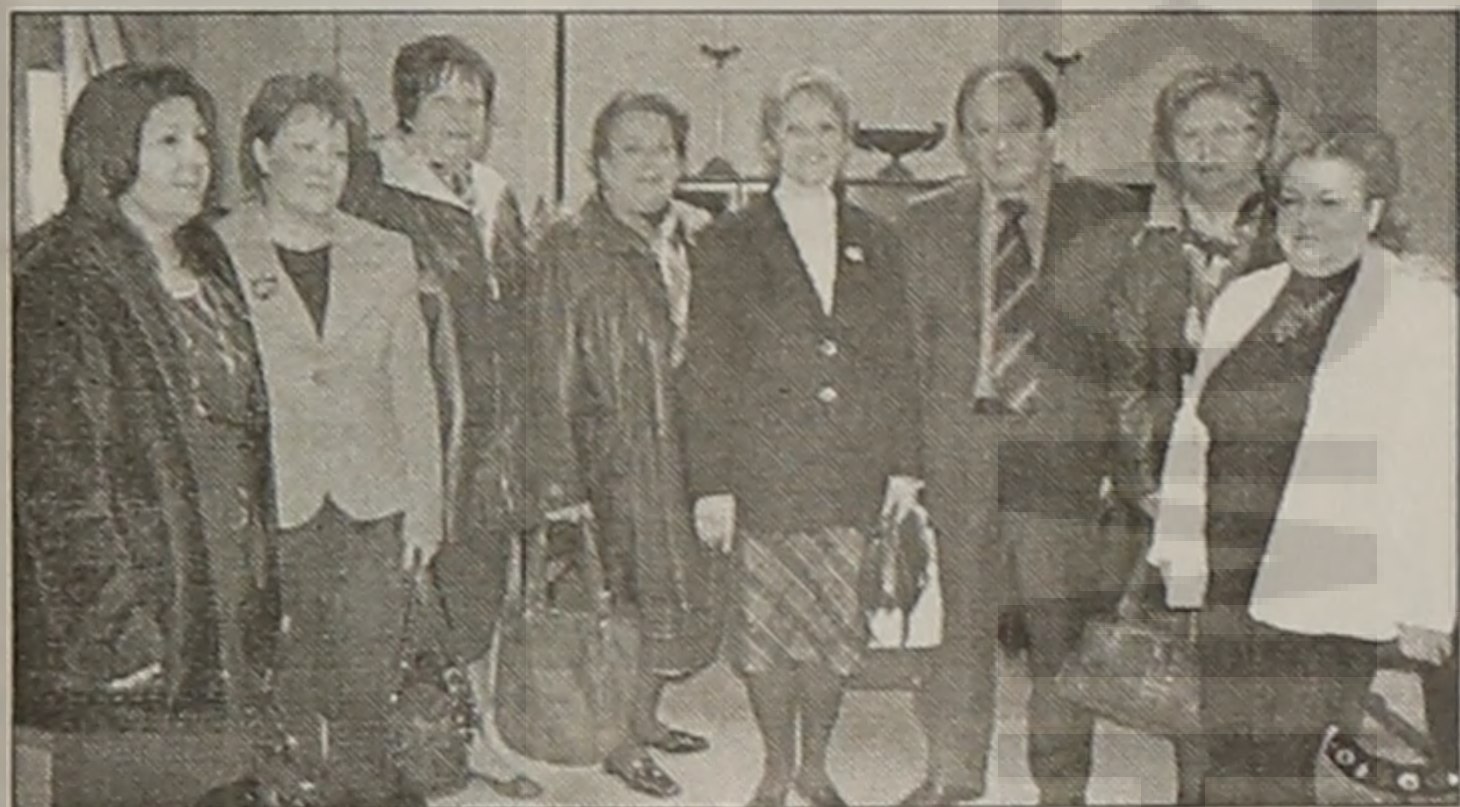
Το Δ.Σ. του Λυκείου Ελληνίδων Βέροιας με τον Νομάρχη μας

Συνάντηση με τα Δ.Σ. του Μορφωτικού Συλλόγου "Η Καλλιθέα" και του Λυκείου Ελληνίδων Βέροιας είχε προχθές ο Νομάρχης Ημαθίας Κος Κώστας Καραπαναγιωτίδης.