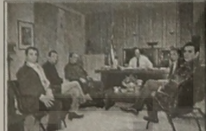
ΤΟΥΣ ΔΙΠΛ. ΜΗΧΑΝΙΚΟΥΣ

Με τα Μέλη του Δ.Σ. της Ομοσπονδίας Αγροτικών Δημοκρατικών Συλλόγων Ν. Ημαθίας συναντήθηκε την Τρίτη 20 Μαρτίου στο Γραφείο του ο Νομάρχης Ημαθίας Κος Κώστας Καραπαναγιωτίδης. Στην διάρκεια της συνάντησης και σε όλα τα ζητήματα που τέθηκαν από την Ομοσπονδία (πρόσβαση για δημιουργία Αρδευτικών Φραγμάτων, Πληρωμές ΟΠΕΚΕΠΕ κ.α.) ο Κος Νομάρχης απάντησε ότι είναι στις προτεραιότητες της Νομαρχιακής Αυτοδιοίκησης και ήδη εξετάζονται ώστε να συμπεριληφθούν στο Προγραμματισμό της, δεδομένου ότι αφορούν ένα φλέγον ζήτημα για τα επόμενα χρόνια. Ο Κος Καραπαναγιωτίδης ενημέρωσε επίσης για τις Συσκέψεις που έγιναν έγκαιρα φέτος αναφορικά με το Ροδάκινο και την Λειψυδρία, αλλά και άλλες αντίστοιχες Συσκέψεις και Πρωτοβουλίες που θα παρθούν στο μέλλον.