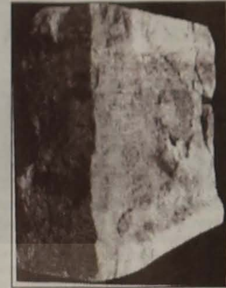
Αφθονο και Πλούσιο είναι το Ε-πιγραφικό Υλικό που διασώθηκε στην Βέρροια. Εδώ, Αναθηματική Ε-πιγραφή που μνημονεύει την Ε-ισιαστική Πύλη και Διατάξεις σχε-τικές με την Διευθέτηση των Υδά-των στην Αρχαία Βέρροια. (Αρχαι-ολογικό Μουσείο Βέρροιας, Αρ. Ευρ. 1919) - [Απο το βιβλίο της L. Brocas - Deflassusieux “ΑΡΧΑΙΑ ΒΕΡΡΟΙΑ”, σελ. 40, Εικ. 14]

Το Ερευνητικό Έργο που αφορά την Βέρροια της Αρχαιότητας, εστιά-ζεται, στις Φιλολογικές, στις Επι-γραφικές, στις Νομισματικές και στις Αρχαιολογικές Πηγές. Σε ο,τι αφορά τις Φιλολογικές Πηγές, οι Αρχαίοι Συγγραφείς, αν και δεν προσφέρουν λεπτομερείς περιγραφές της Βέρροιας, δίνουν ωστόσο χρησιμότερες πληροφο-ρίες.