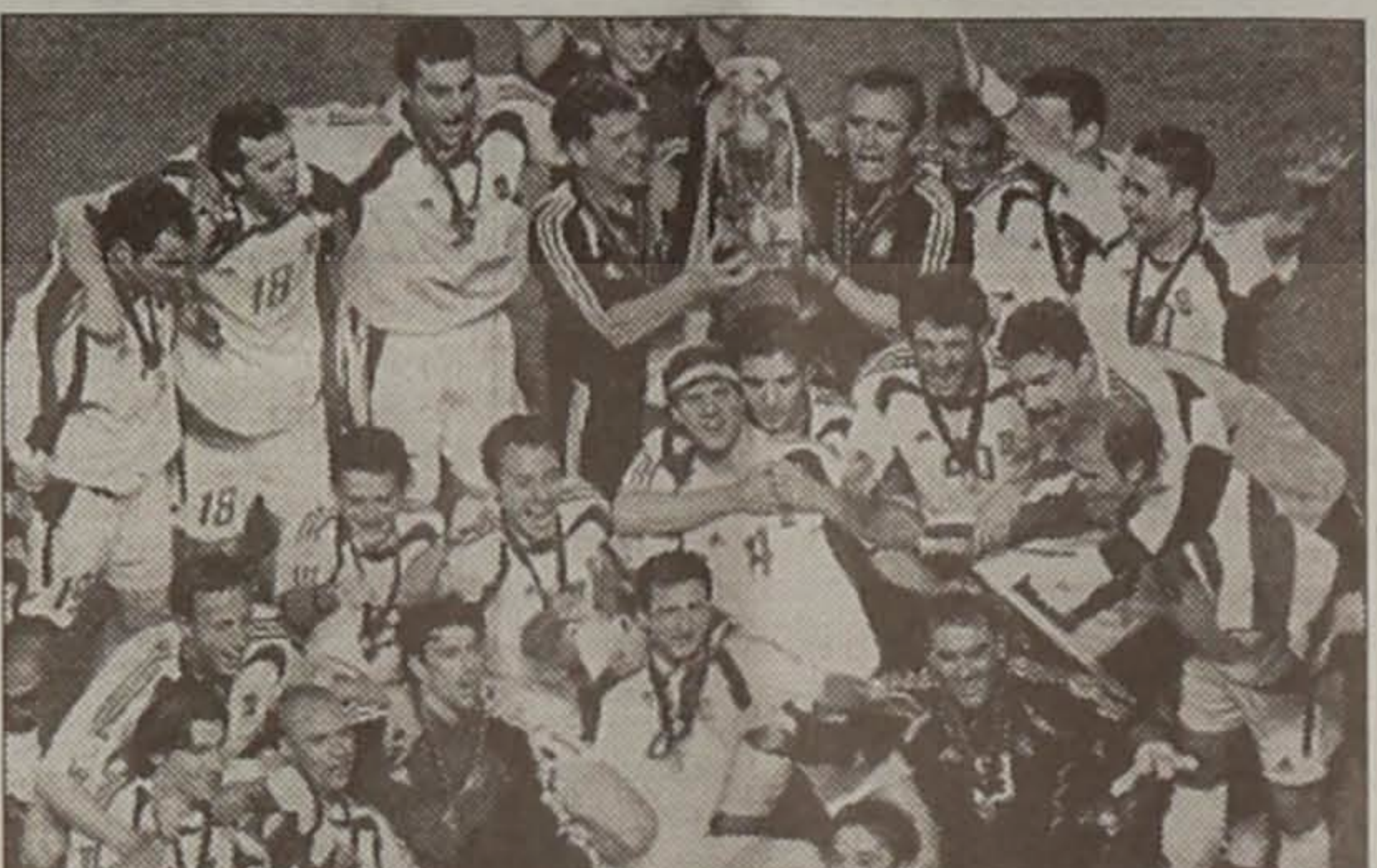
Σας Ευχαριστούμε Για Τις Στιγμές Της Χαράς Που Μας Χάρησατε! Κανате Την Ζωή Μας Ομορφότερη! Κι Ας Κρατήσε Αυτό Για Λίγο... Ήταν Κατι Θαύμασιο! Σας Ευχαριστούμε!!!